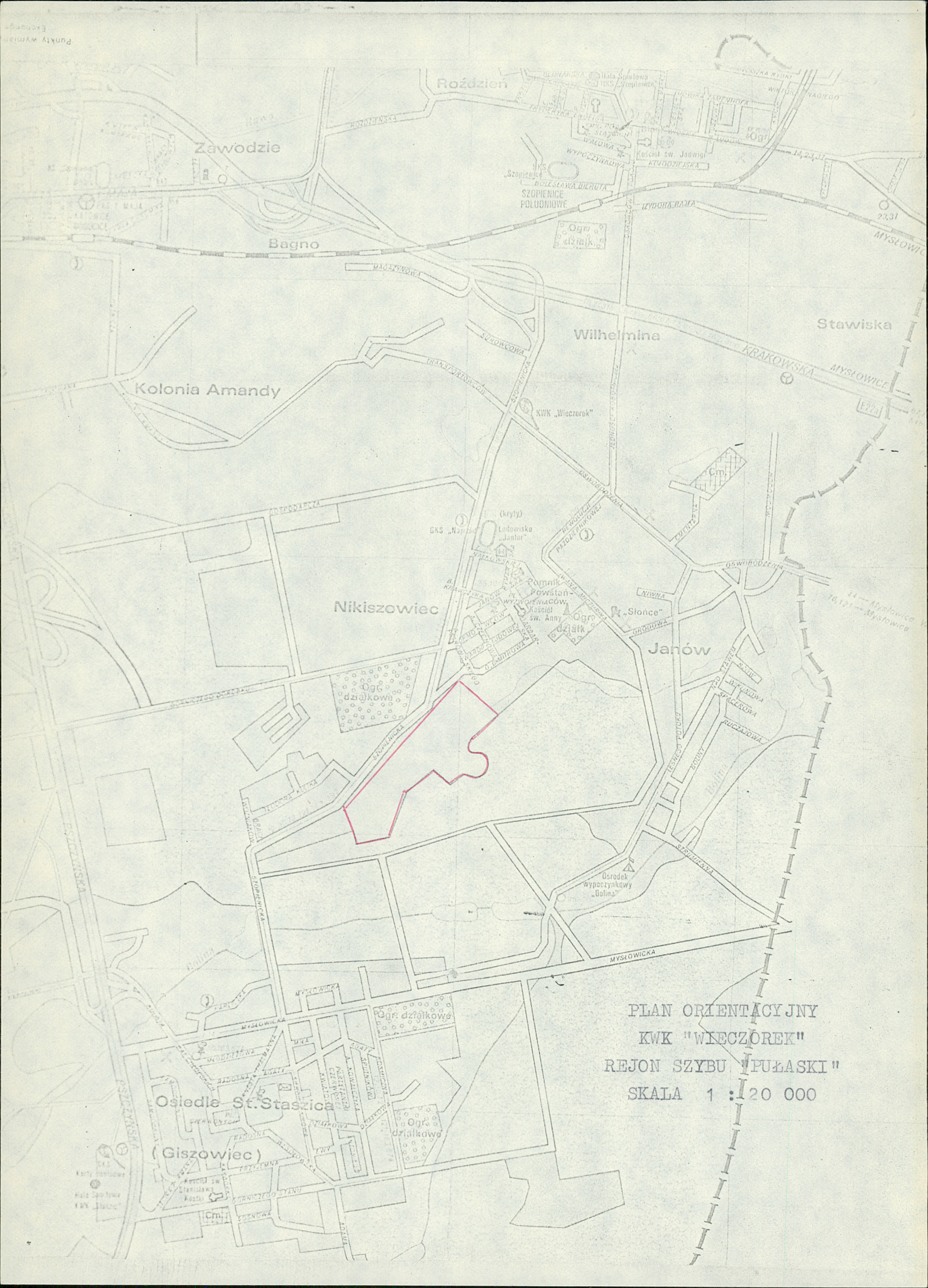
PLAN ORIENTACYJNY KWK "WIEŻOREK" REJON SZYBU "PUŁASKI" SKALA 1:20 000