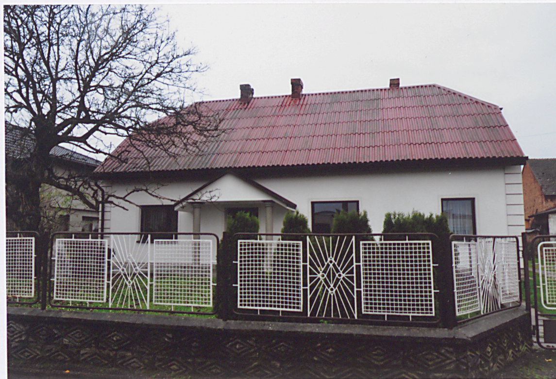
Budynek, widok od wschodu