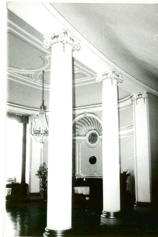
FRAGM. FOYER NA PIĘTRZE

Wkładkę założył: Mariusz Godek 30.09.1997. (imię, nazwisko, data)