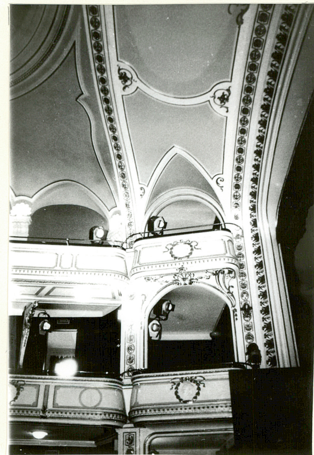
1,2 - FRAGM. WIDOWNI

Wkładkę założył: ..... Mariusz Godek 30.09.1997. (imię, nazwisko, data)