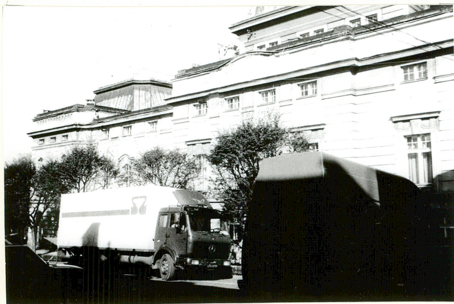
1,2 - FRAGMENT ELEWACJI PD.