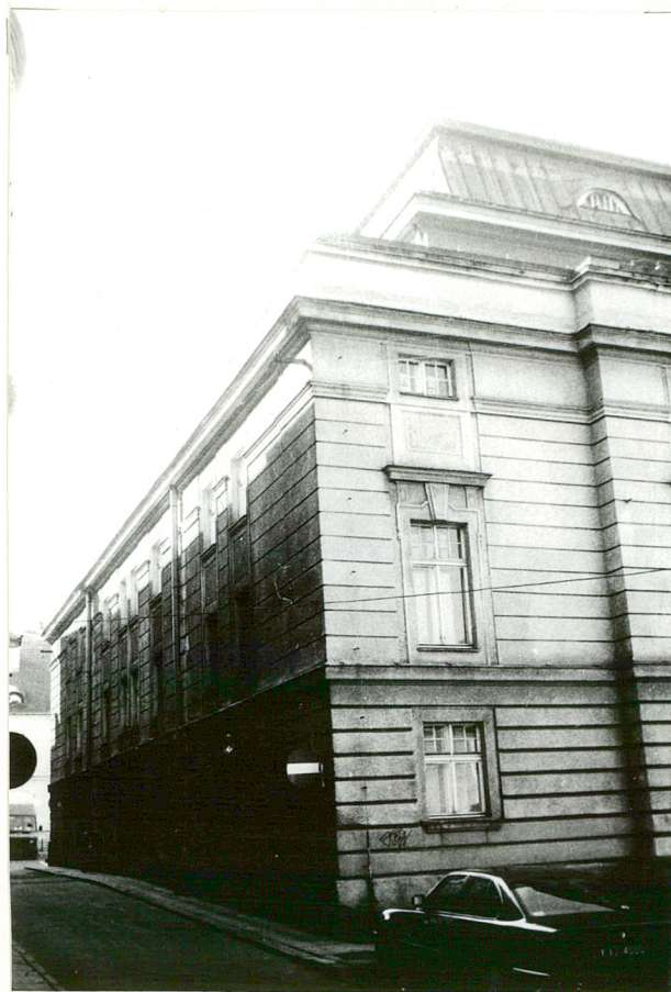
WIDOK NA ELEWACJĘ WSCH.