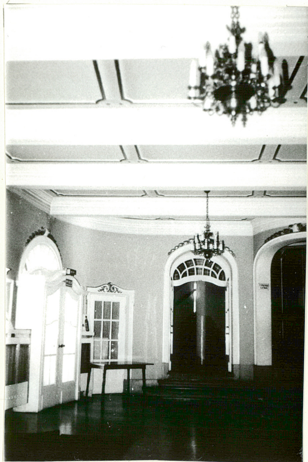
FRAGM. HALLU NA PARTERZE

3. Zawartość wkładki (nazwa obiektu lub materiału uzupełniającego) zdjęcia