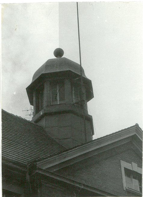
wieża w dachu