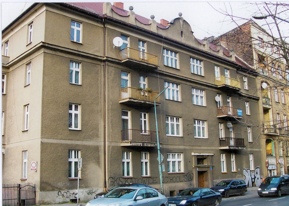
Widok: Elewacja południowa- frontowa.