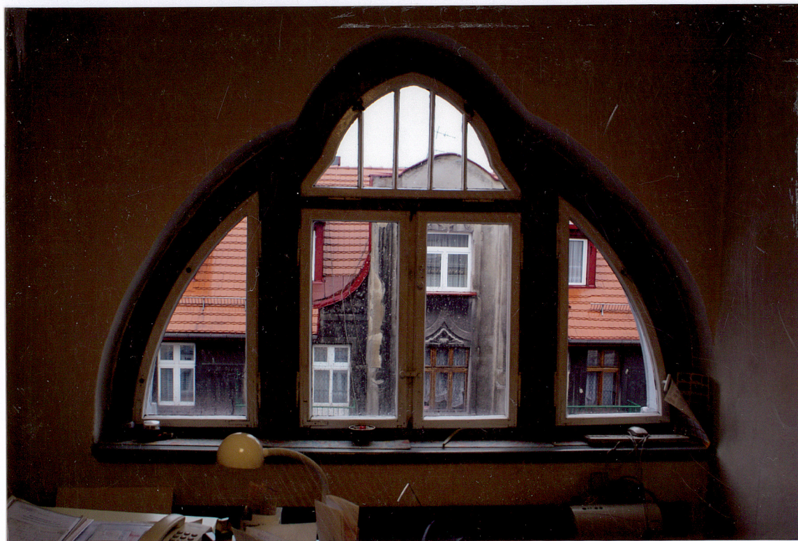
Fot. 20 Poddasze – okno w pomieszczeniu administracji budynku.