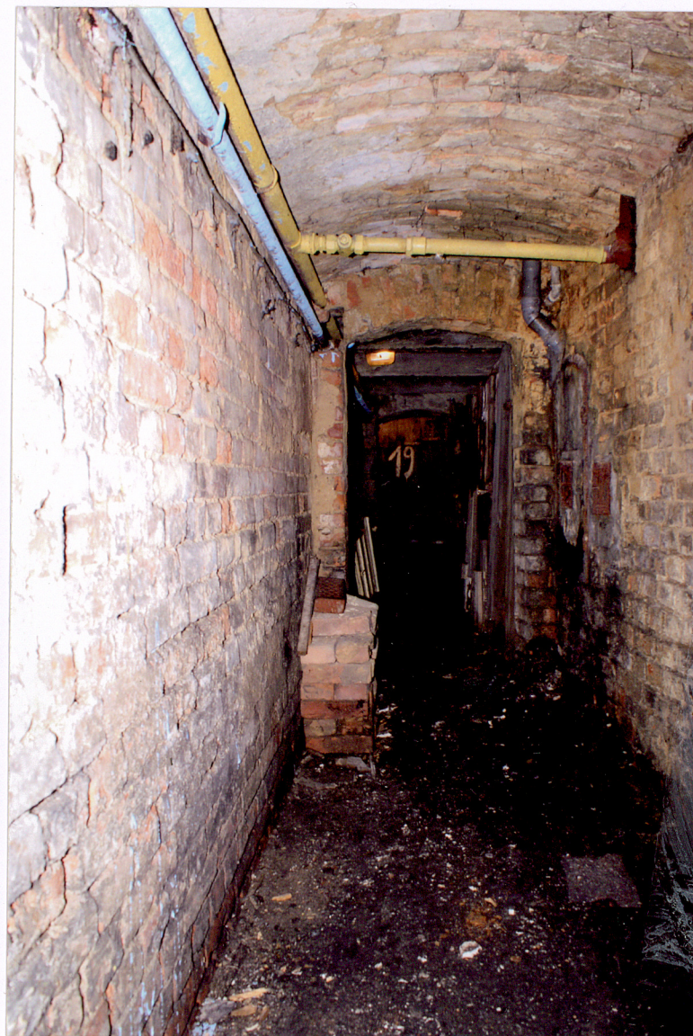
Fot. 31 Korytarz piwnicy w oficynie bocznej.