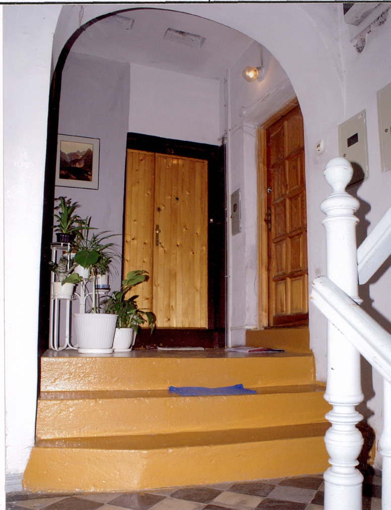
Fot. 24 Klatka schodowa oficyn – przejście do oficyny tylnej.