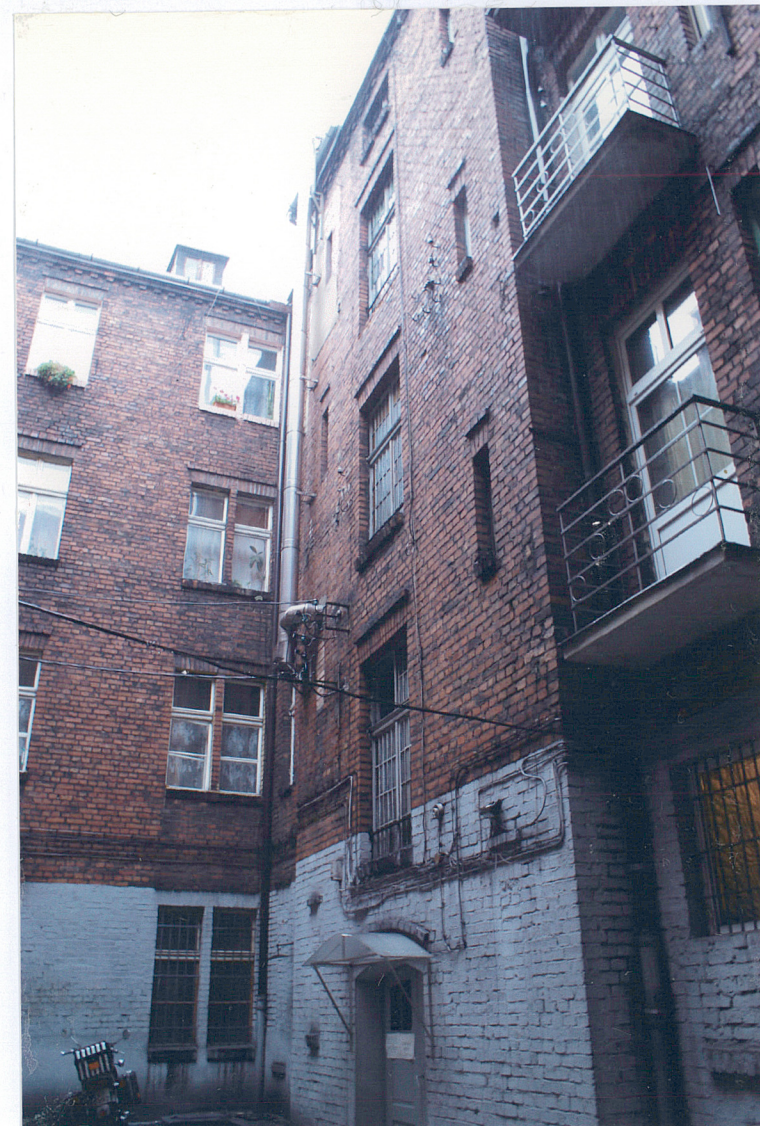
Fot. 7 Zachodnia część elewacji tylnej budynku frontowego oraz fragment oficyny bocznej.