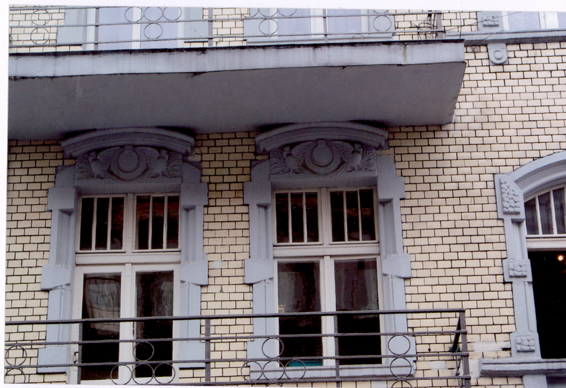
Fot. 3 Budynek frontowy – dekoracja okien balkonów pierwszego piętra fasady.