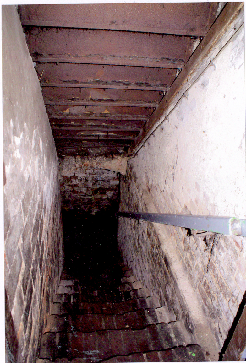
Fot. 30 Schody do piwnicy oficyny bocznej.