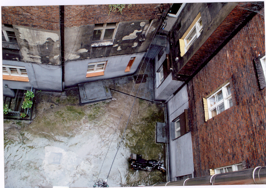
Fot. 10 Podwórko i fragmenty elewacji oficyn.