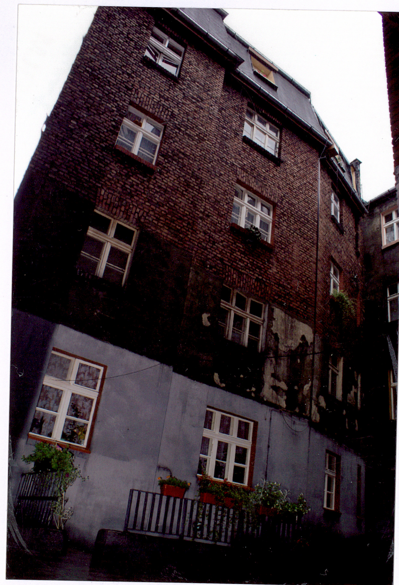
Fot. 11 Elewacja oficyny tylnej.