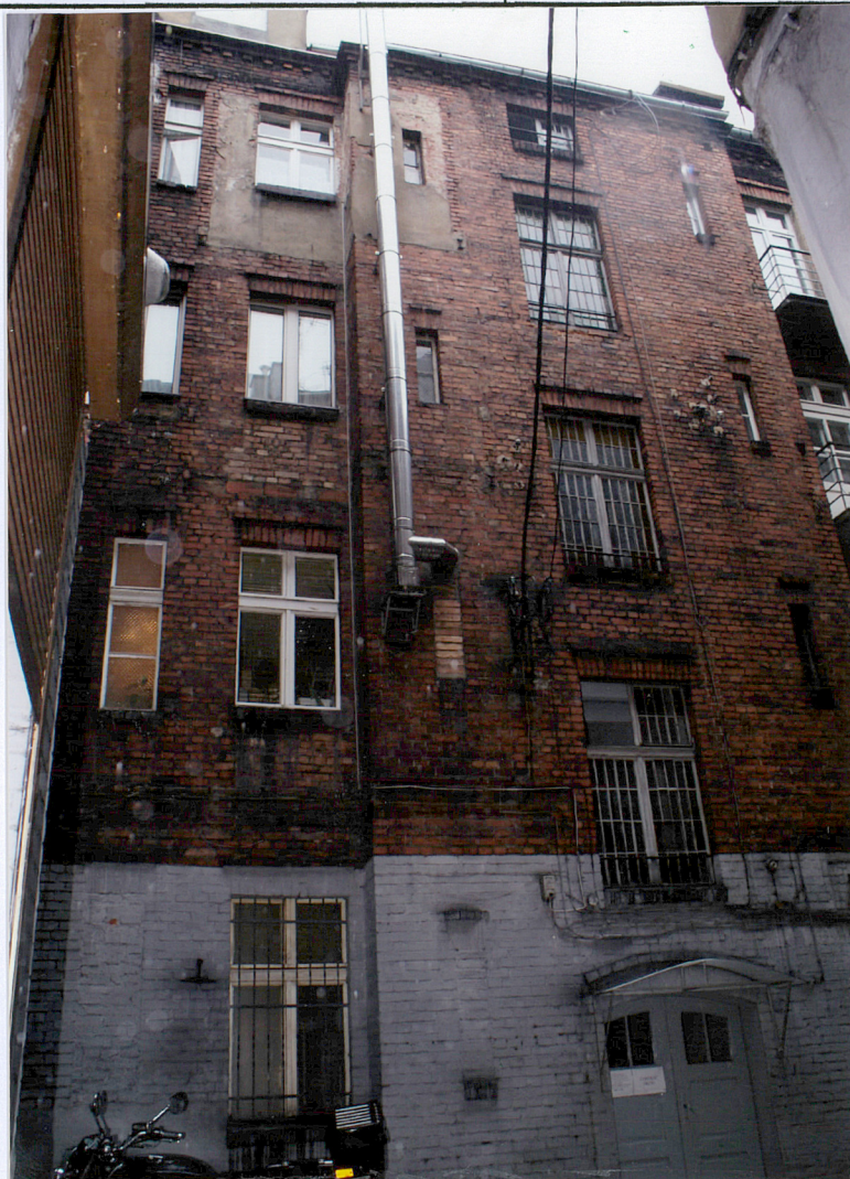
Fot. 8 Zachodnia część elewacji tylnej budynku frontowego.