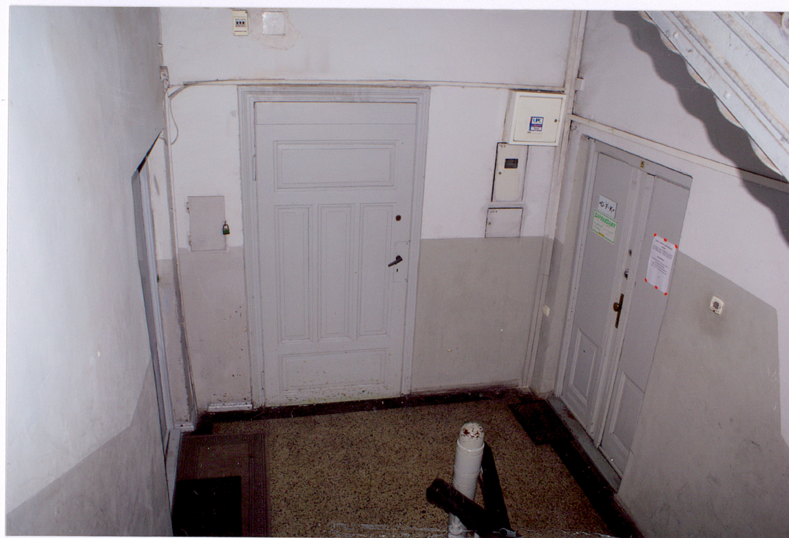
Fot. 17 Drzwi do mieszkań z klatki schodowej budynku frontowego.