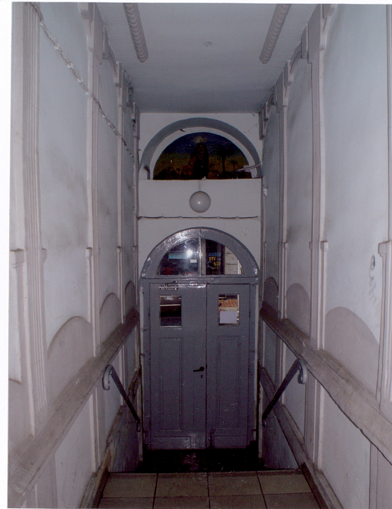
Fot. 13 Sień budynku frontowego.