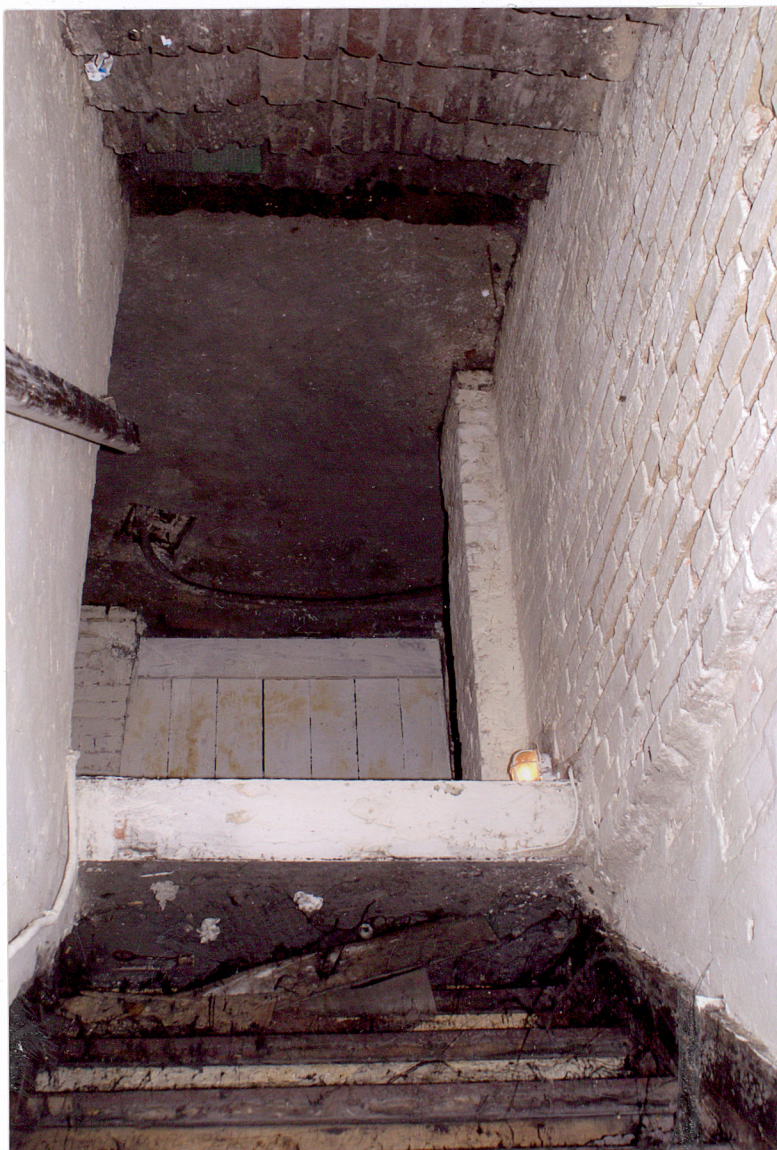
Fot. 22 Schody do piwnicy budynku frontowego.