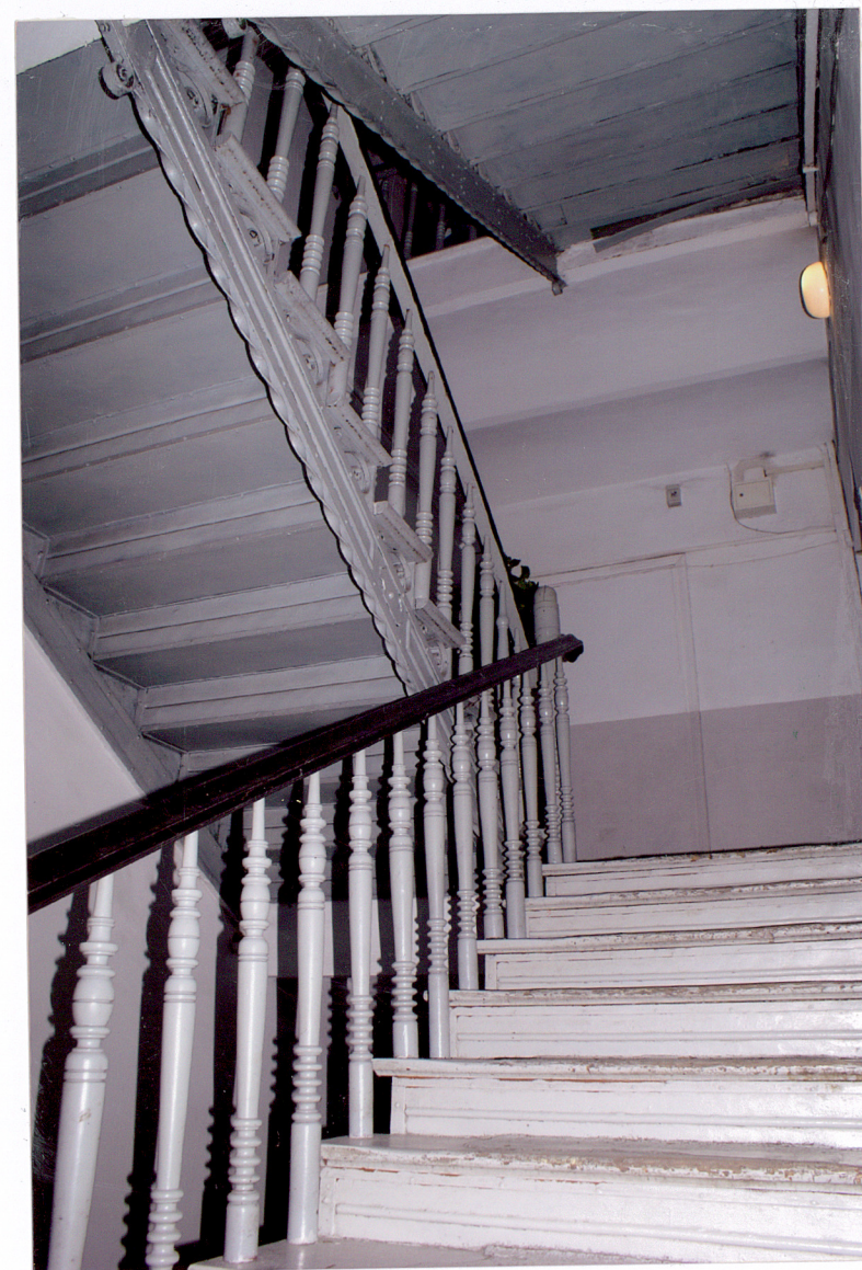
Fot. 15 Klatka schodowa w budynku frontowym.