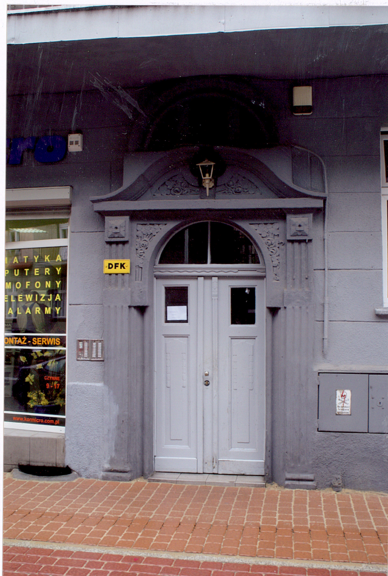
Fot. 2 Budynek frontowy – portal fasady.