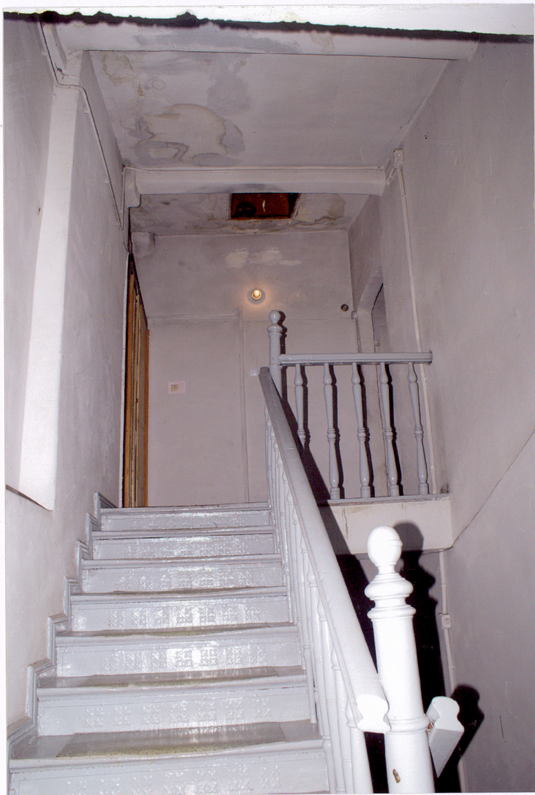
Fot. 26 Klatka schodowa oficyn – po lewej drzwi do oficyny tylnej przy ul. Jagiellońskiej 14 A, po prawej drzwi na strych.