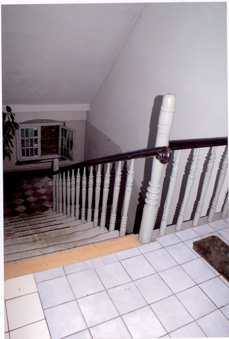
Fot. 18 Klatka schodowa w budynku frontowym – poddasze.