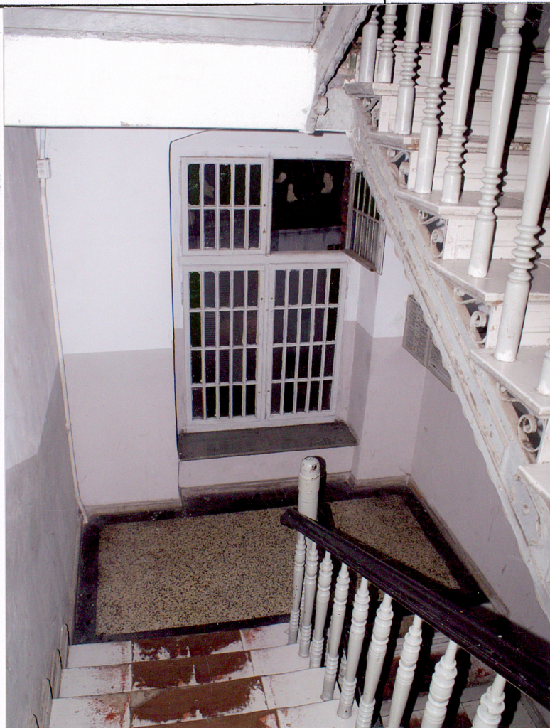
Fot. 16 Klatka schodowa w budynku frontowym – podest międzypiętrowy i okno.