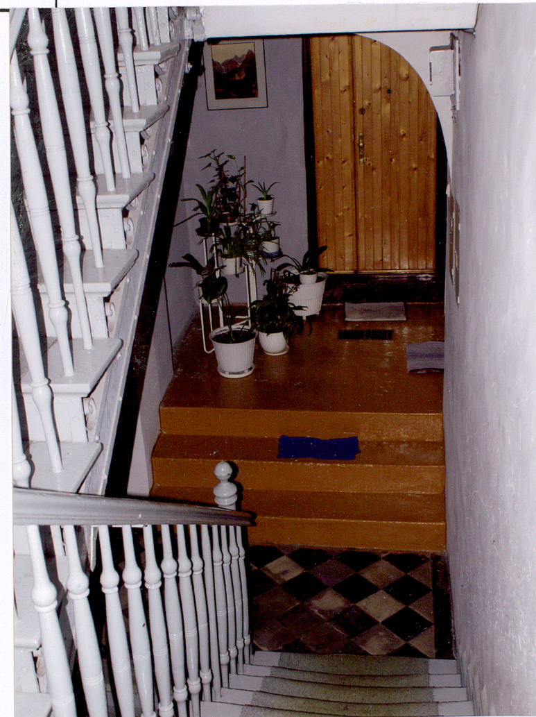
Fot. 25 Klatka schodowa oficyn – konstrukcja schodów i świetlik w podłodze korytarzyka.