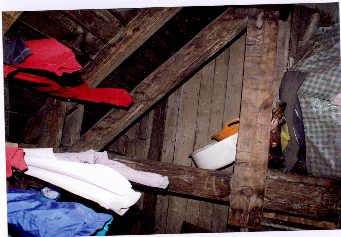
Fot. 28 Więżba dachowa oficyny bocznej.