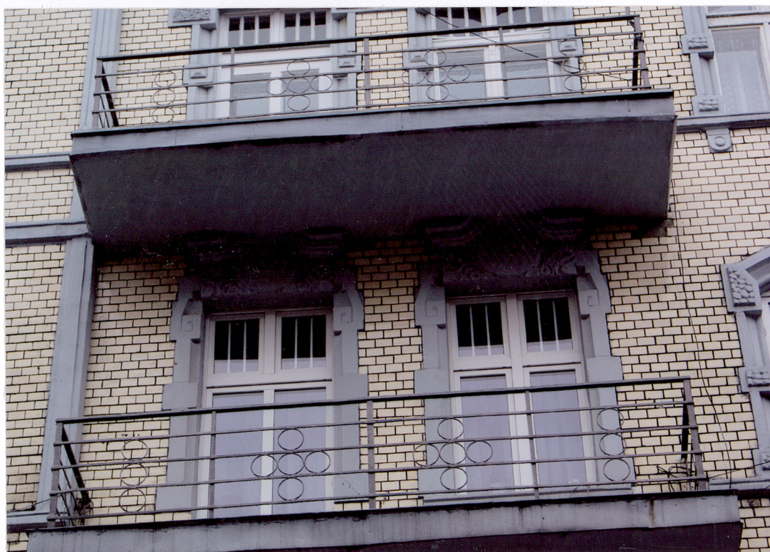
Fot. 4 Budynek frontowy – dekoracja okien balkonów drugiego piętra fasady.