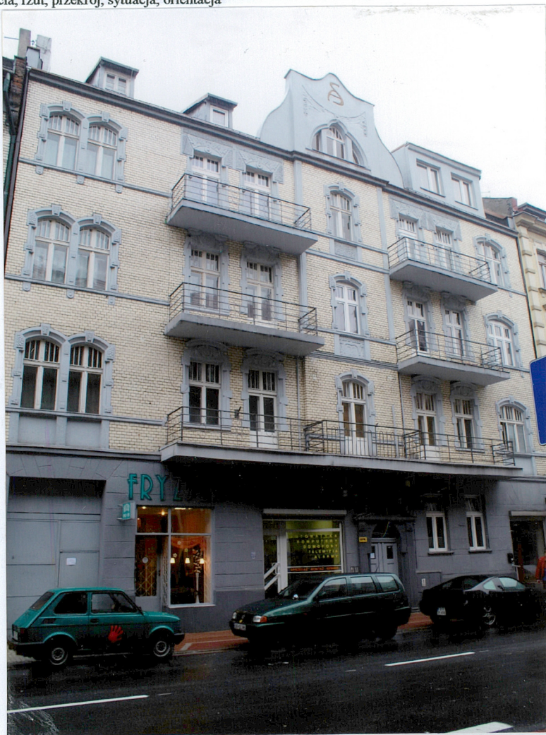
Fot.1 Fasada kamienicy – widok od strony północnej.

11. Zdjęcia, rzut, przekrój, sytuacja, orientacja