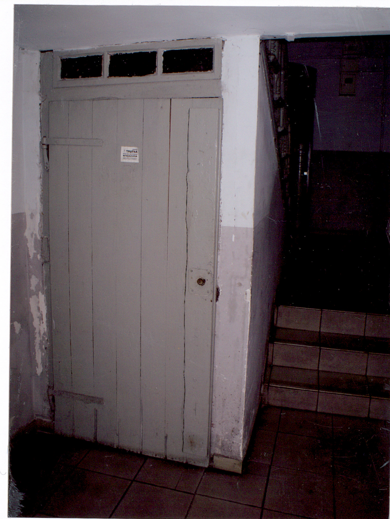
Fot. 21 Drzwi do piwnicy budynku frontowego.