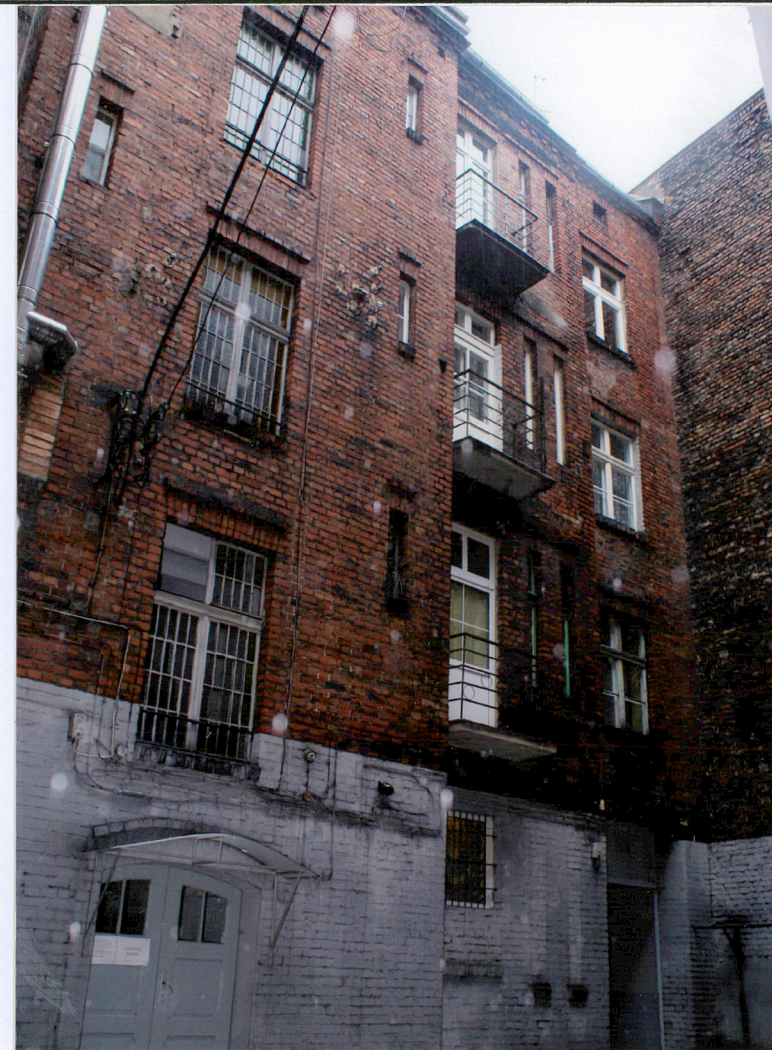
Fot. 9 Wschodnia część elewacji tylnej budynku frontowego.