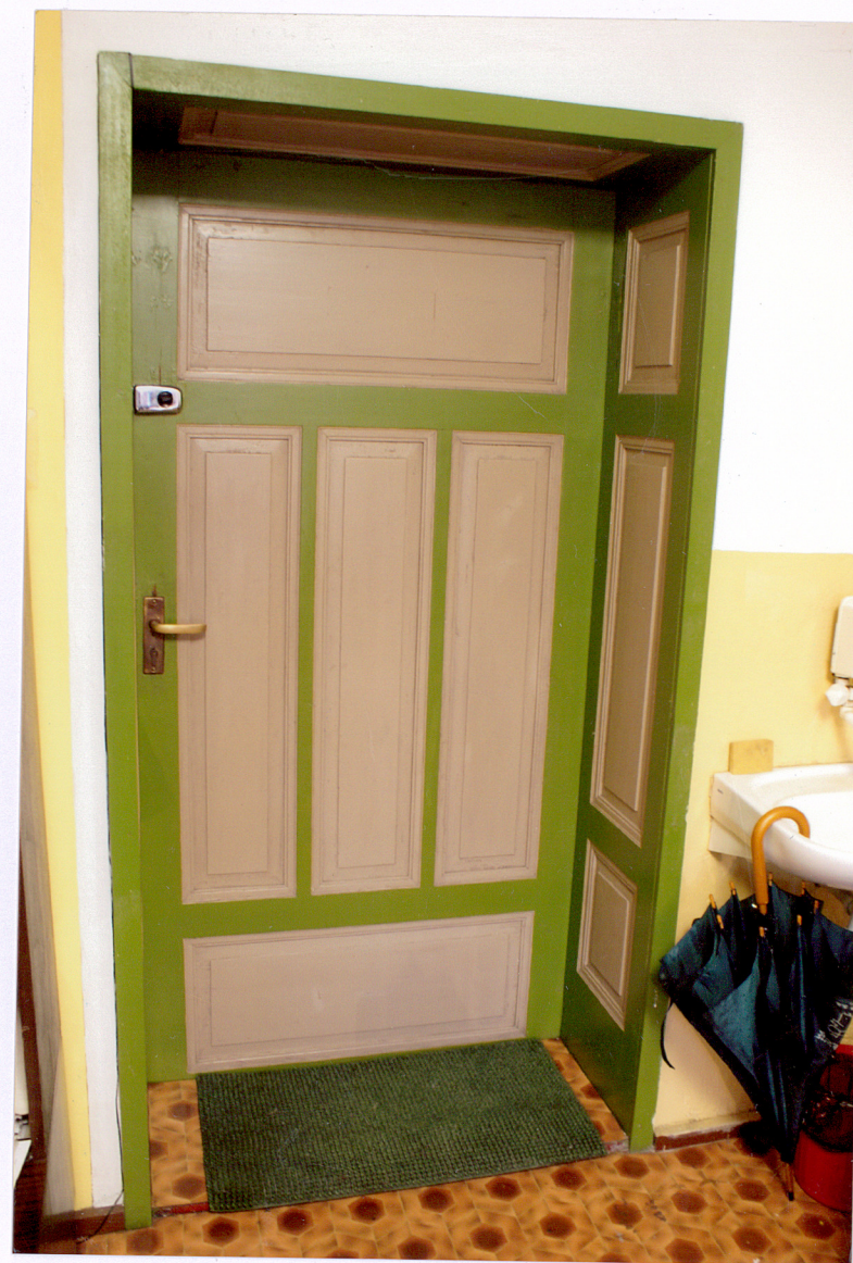
Fot. 19 Poddasze – drzwi w pomieszczeniu administracji budynku.