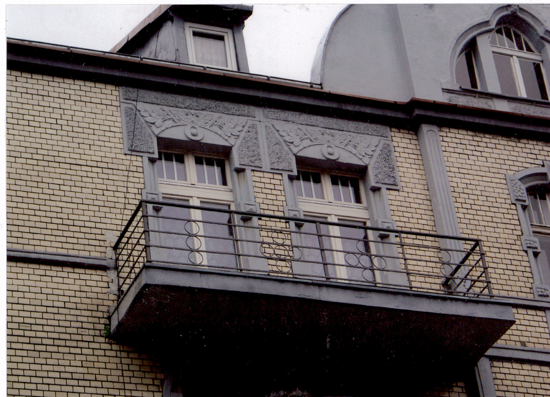
Fot. 5 Budynek frontowy – dekoracja okien balkonów trzeciego piętra fasady.

Wkładkę założył: AB OVO s. c. ul. Hoyera 6, 30-898 Kraków: mgr Paulina Lis, mgr Krystyna Zgrzebnicka (imię, nazwisko, data) 12 GRU. 2007