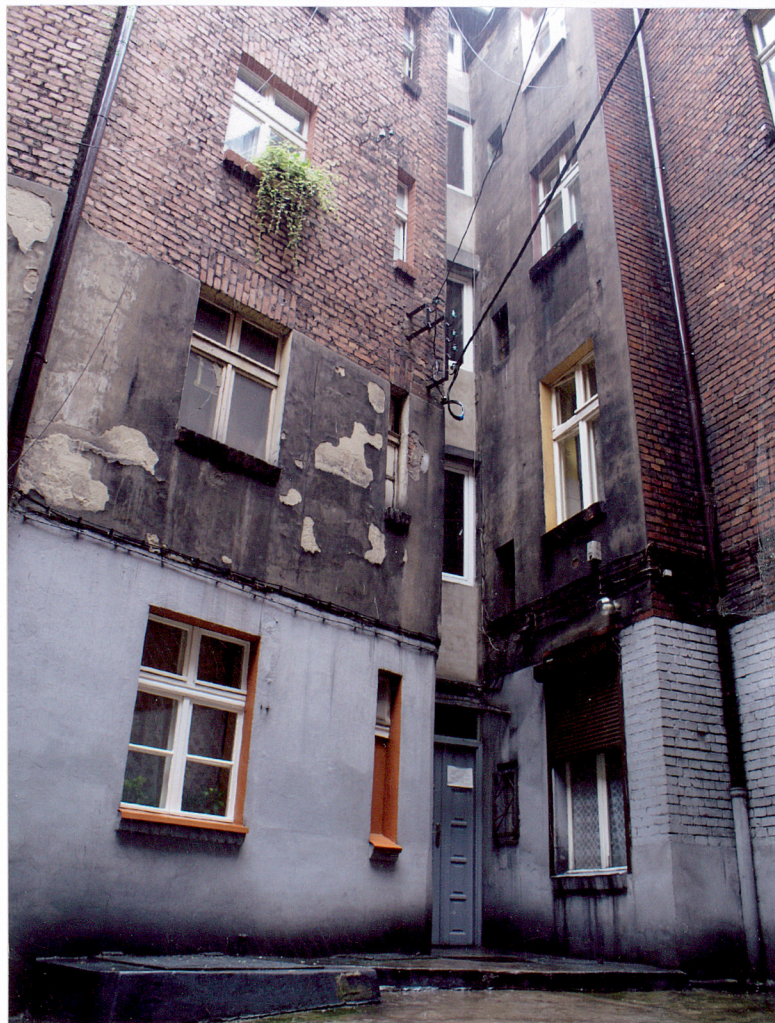
Fot 12 Fragmenty elewacji oficyn wraz z łącznikiem – klatką schodową.