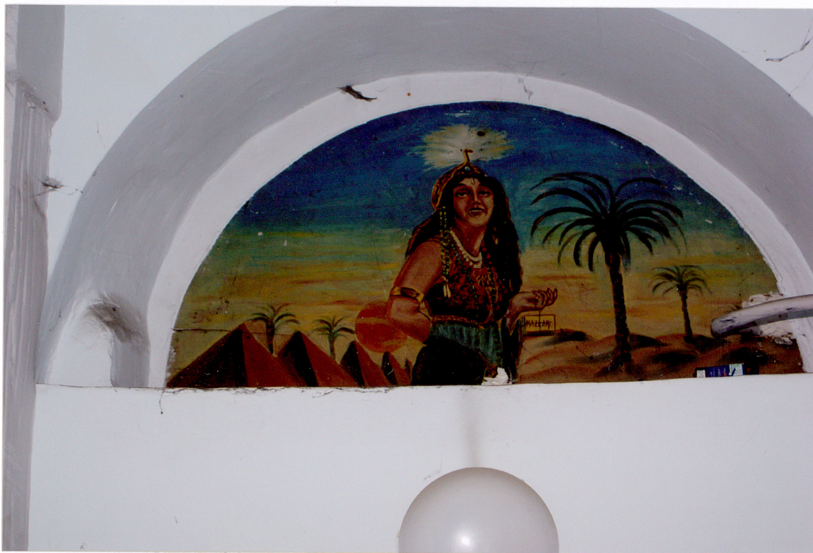
Fot. 14 Sień – malowidło w łuku ponad drzwiami wejściowymi.