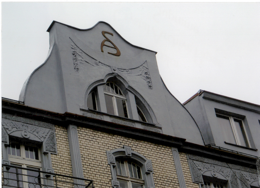
Fot. 6 Budynek frontowy – attyka.