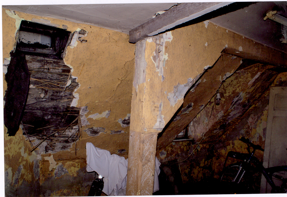
Fot. 27 Strych oficyny bocznej.