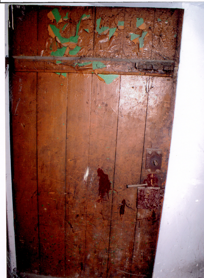
Fot. 29 Drzwi do piwnicy oficyny bocznej.