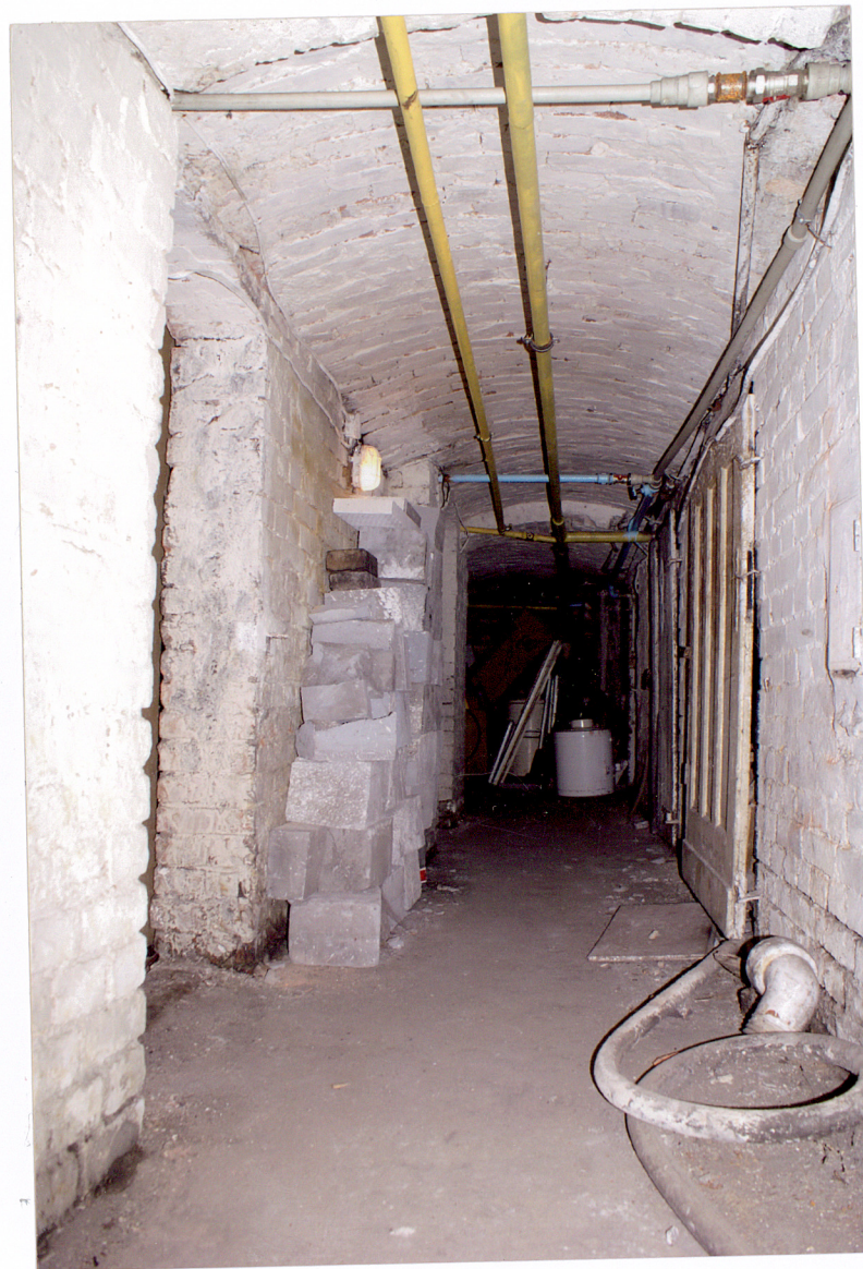
Fot. 23 Korytarz piwnicy budynku frontowego.