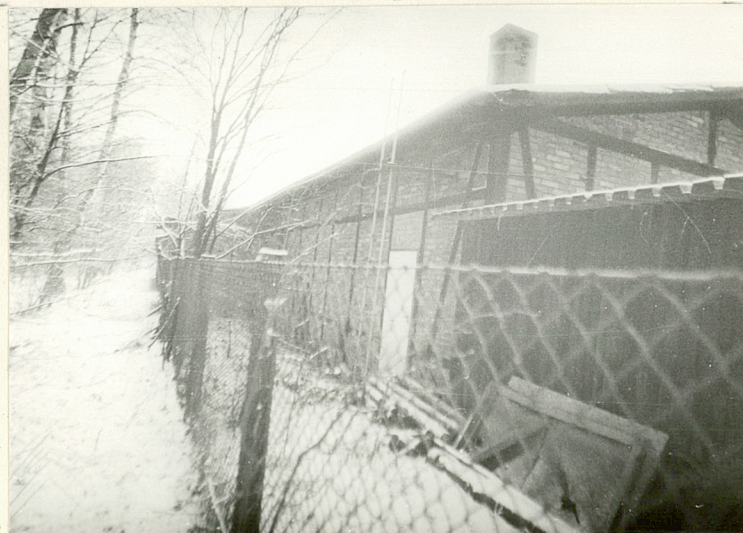
Widok z pn-wsch.