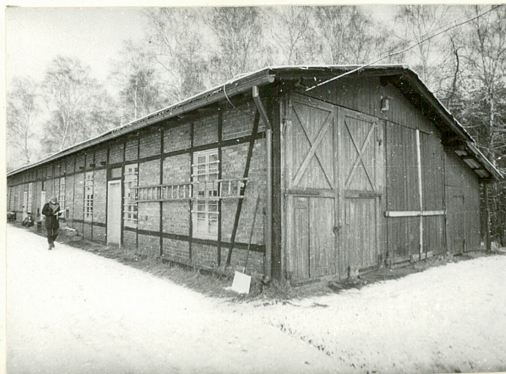
Widok z pd-zach.