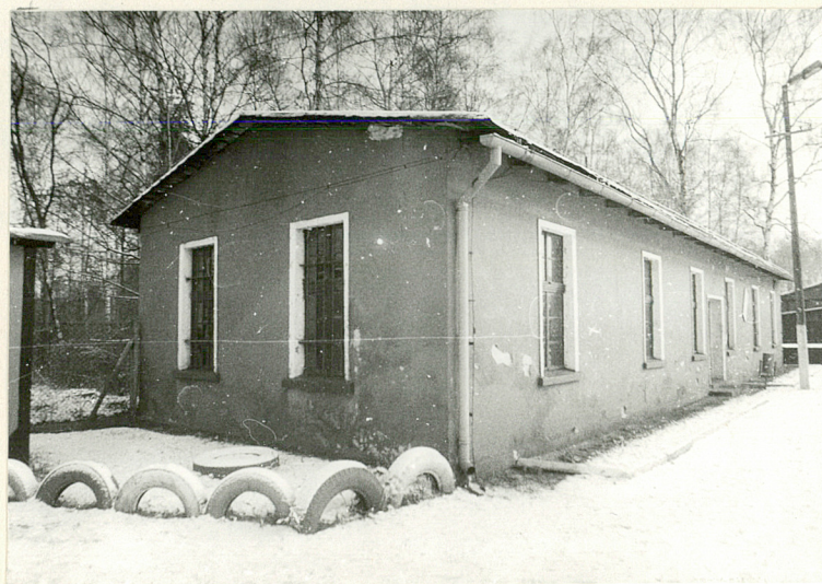
Widok z pn-zach.