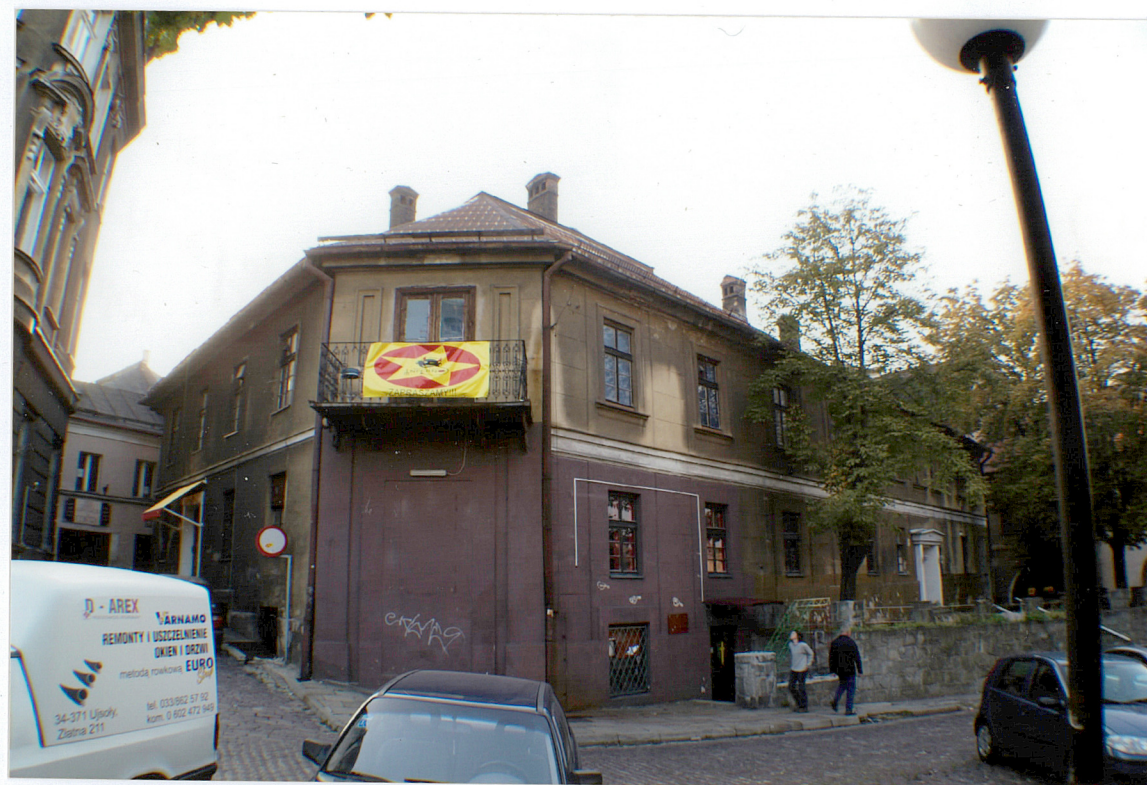
Fot. 5 Narożnik południowo-wschodni z balkonem.