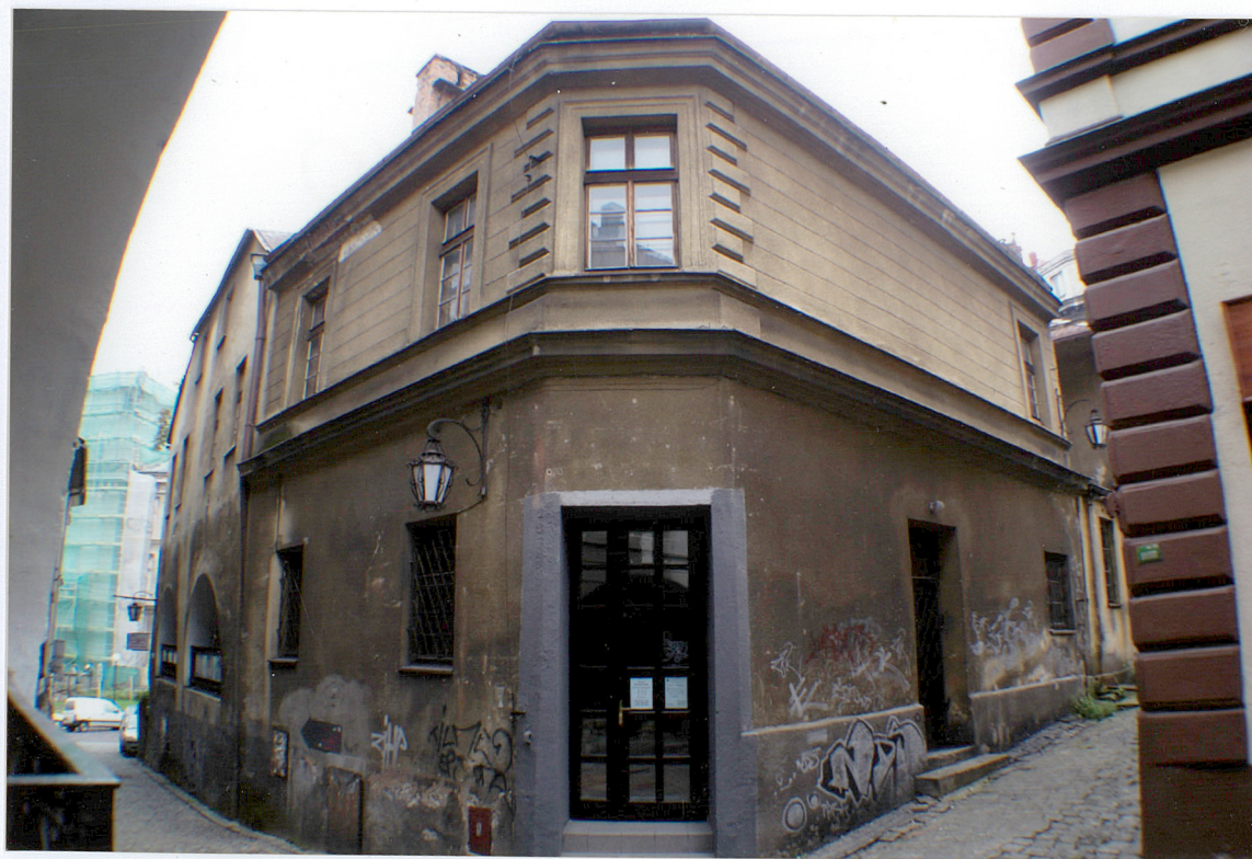
Fot. 9 Elewacja północna oraz fragment elewacji zachodniej.