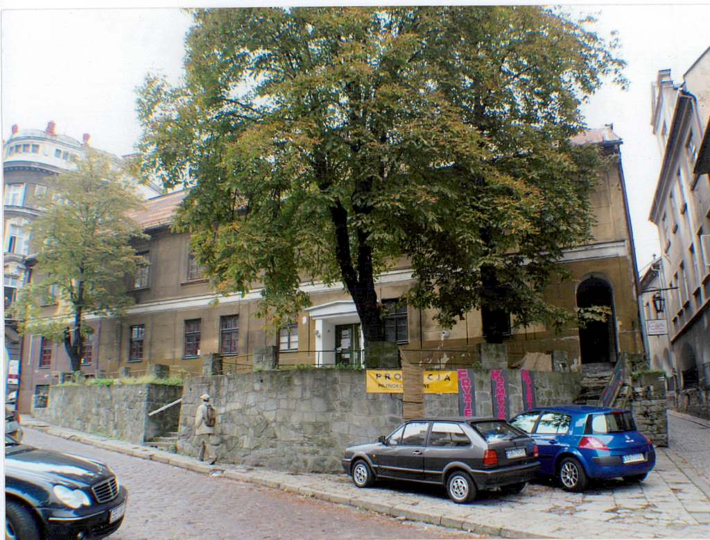
Fot.1 Widok od ul. Wzgórze.