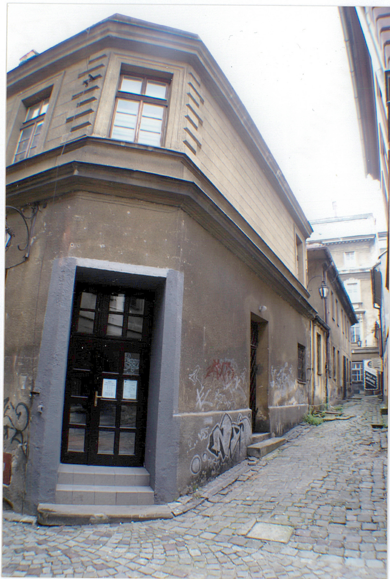
Fot. 8 Elewacja zachodnia – od strony ulicy Zaulek.