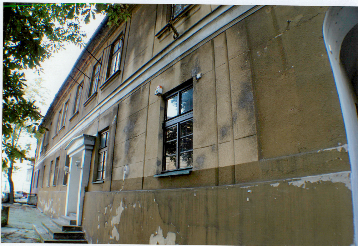
Fot. 2 Fragment elewacji wschodniej z portalem.