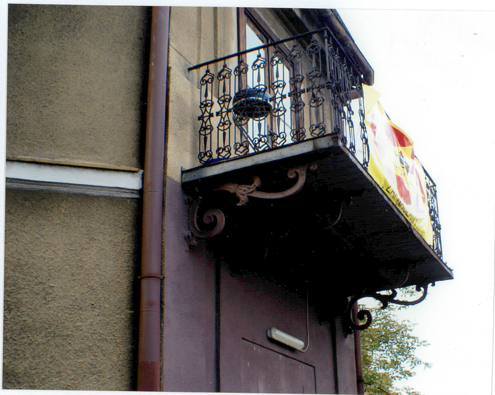
Fot. 6 Balkon na południowo-wschodnim narożniku budynku.