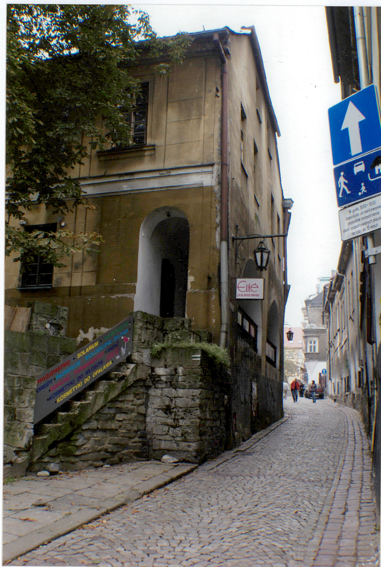
Fot. 4 Podcienia elewacji wschodniej oraz wschodnia część elewacji północnej.