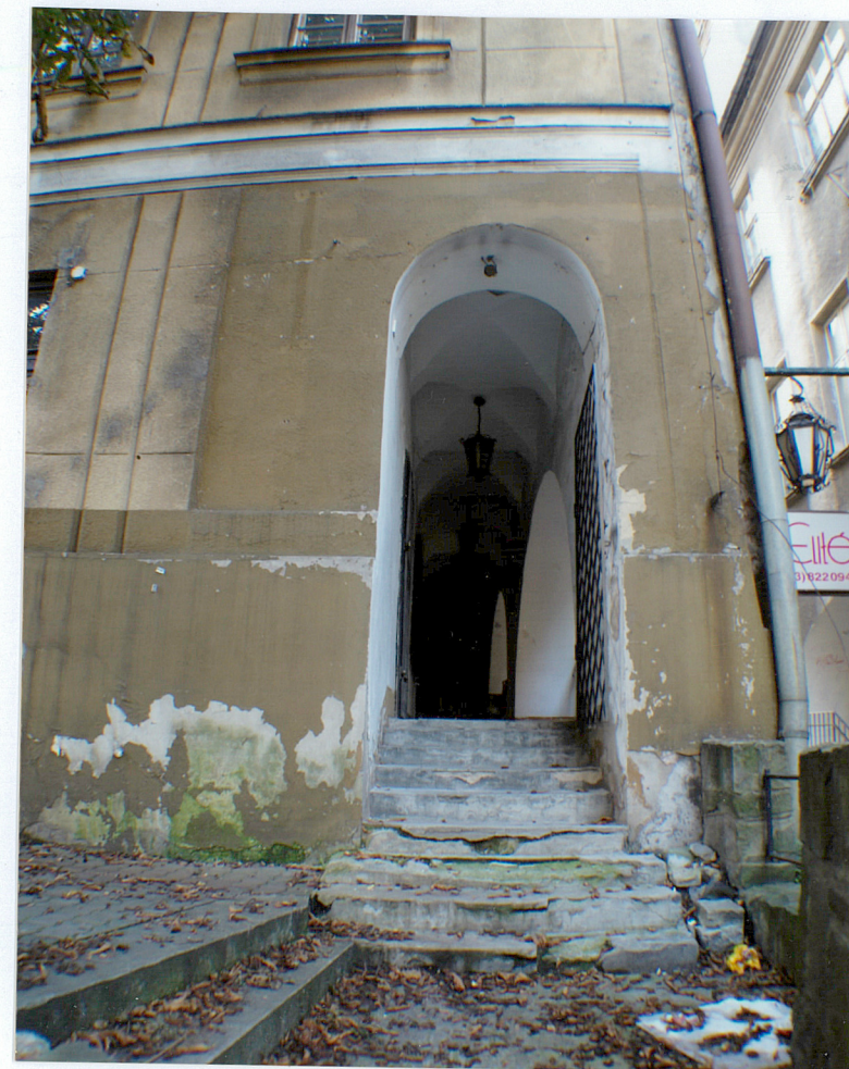
Fot. 3 Podcienia – widok od strony ulicy Wzgórze.