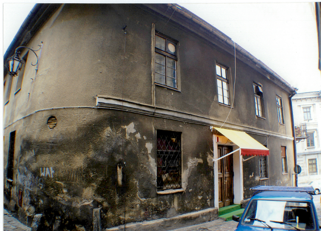
Fot. 7 Elewacja południowa z zaokrąglonym narożnikiem południowo-zachodnim.

Wkładkę założył: AB OVO s. c. ul. Hoyera 6, 30-898 Kraków: mgr Paulina Lis, mgr Krystyna Zgrzebnicka (imię, nazwisko, data)