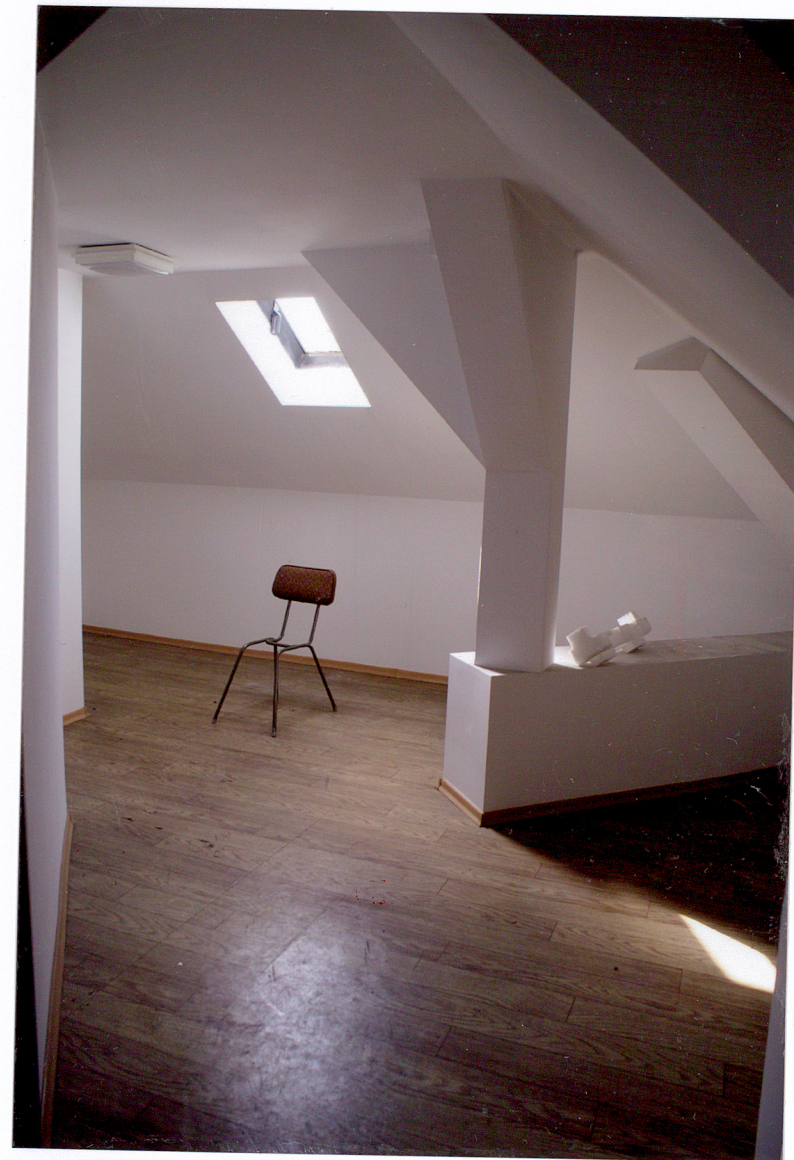
Fot. 17 Adaptowane pomieszczenia strychowe.