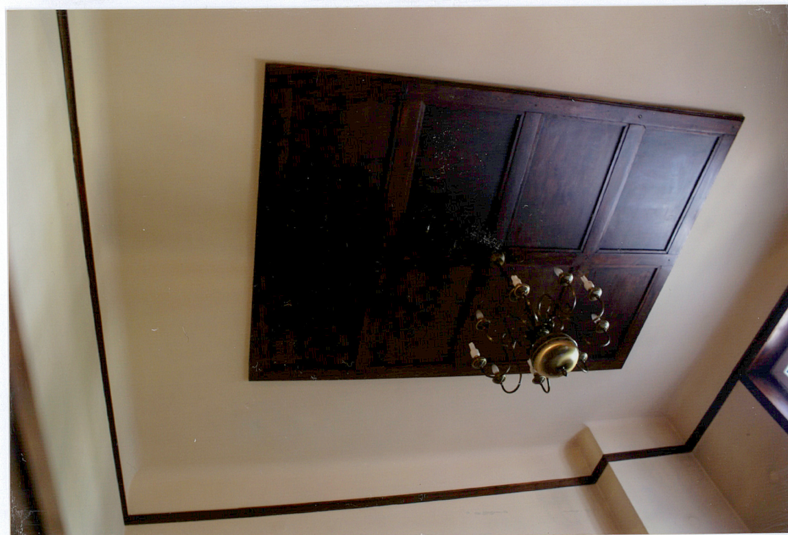
Fot. 11 Drewniana dekoracja płycinowa na stropie małego hallu.