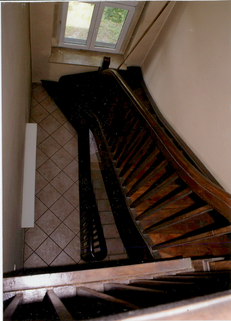
Fot. 18 Boczna klatka schodowa

Wkładkę założył: AB OVO s. c. ul. Hoyera 6, 30-898 Kraków: mgr Paulina Lis, mgr Krystyna Zgrzebnicka (imię, nazwisko, data)