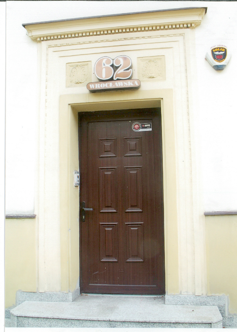
Fot. 7 Portal główny.