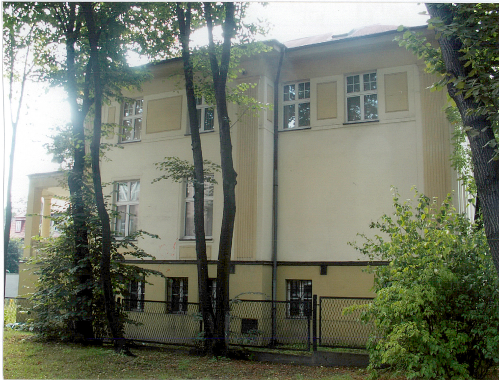
Fot. 4 Elewacja wschodnia.