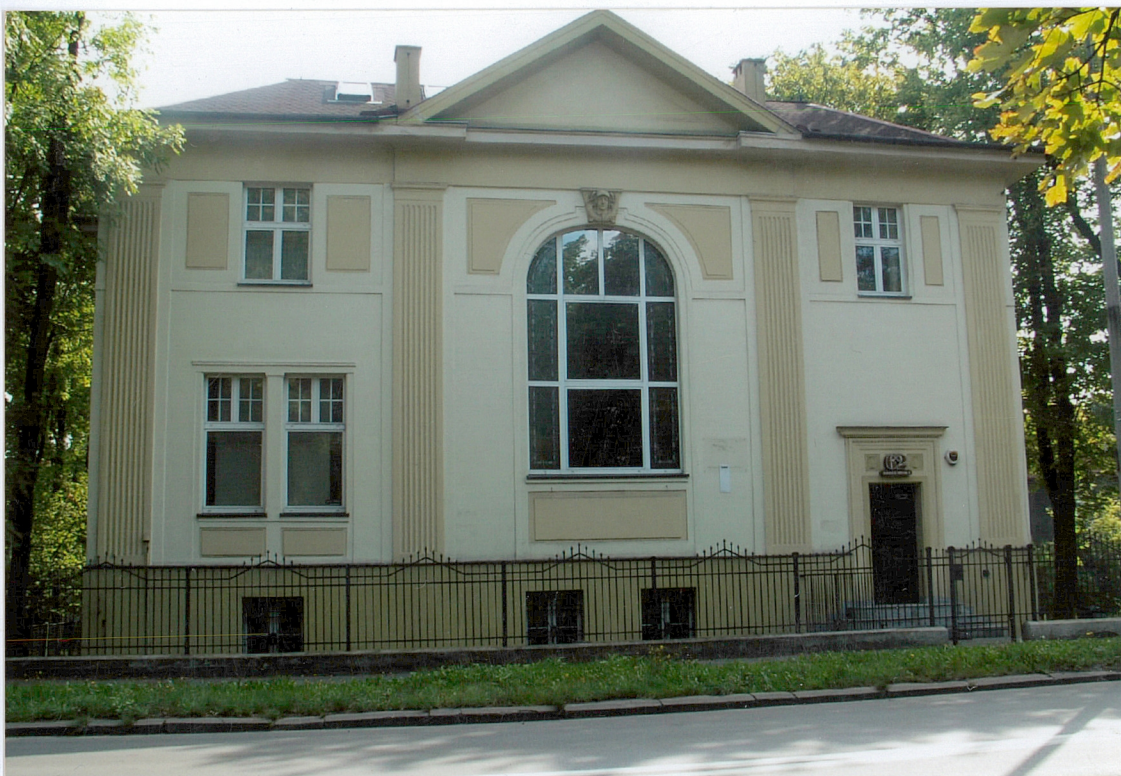
Fot.1 Fasada budynku.