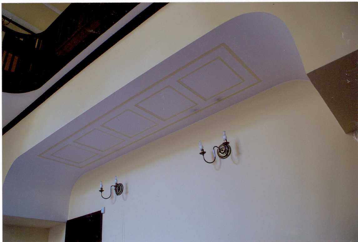
Fot. 16 Podniebienie galerii w hallu głównym.