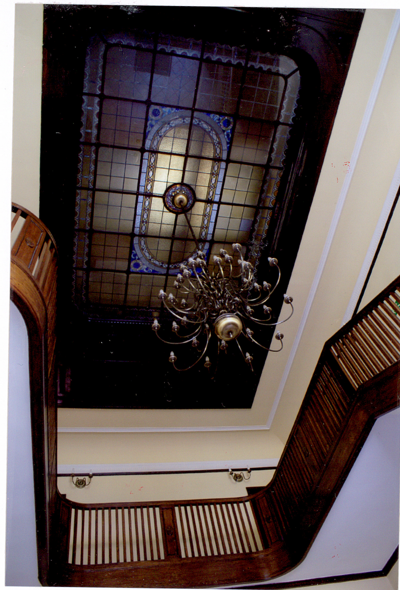
Fot. 13 Diele - witraż w stropie wraz z ramą i pajakiem.