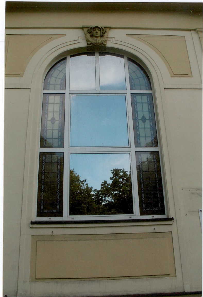
Fot. 5 Okno witrażowe fasady.