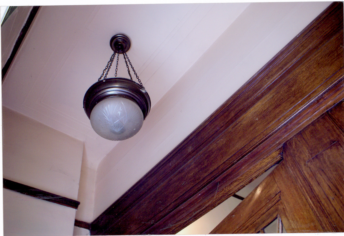
Fot. 12 Lampa w hallu wejściowym.