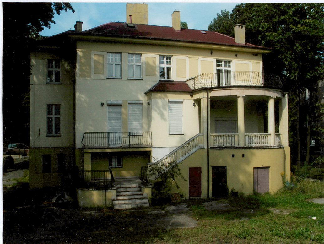
Fot. 2 Elewacja południowa.