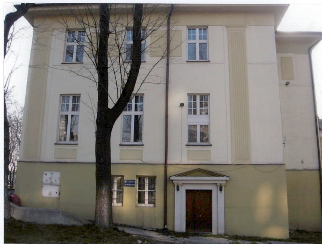
Fot. 3 Elewacja zachodnia.