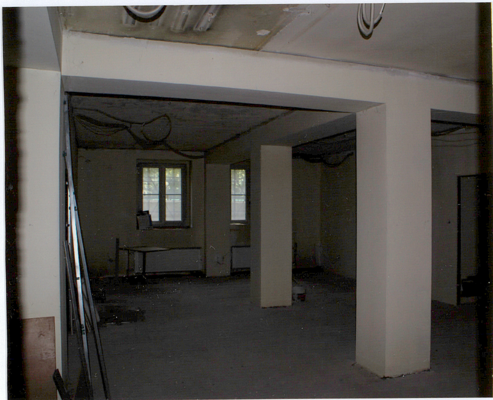
Fot. 8 Pomieszczenia suteryny.