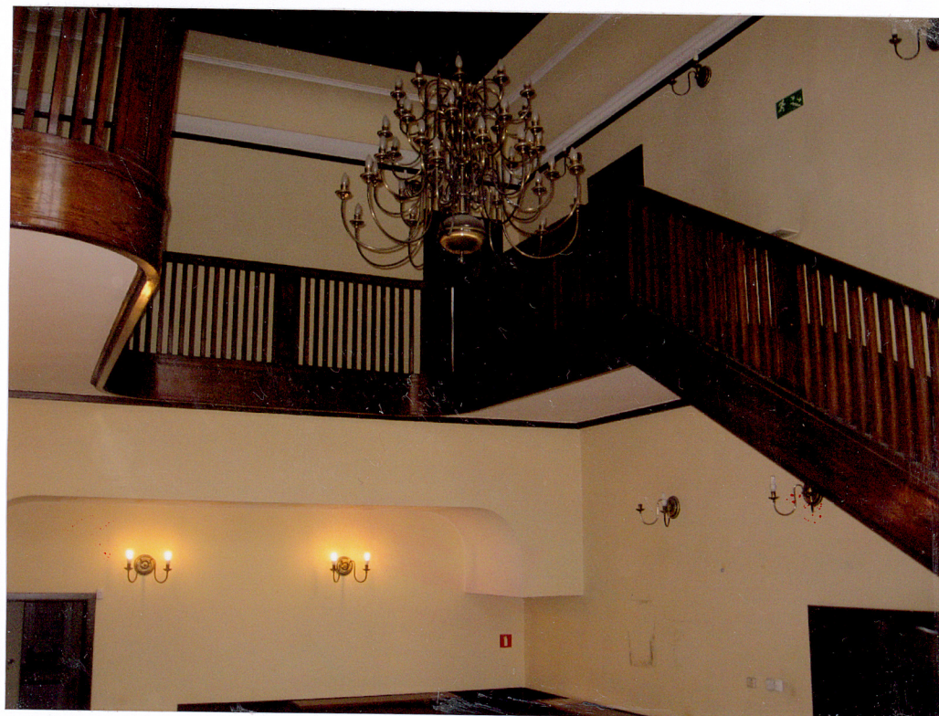
Fot. 15 Schody w hallu głównym budynku.

Wkładkę założył: AB OVO s. c. ul. Hoyera 6, 30-898 Kraków: mgr Paulina Lis, mgr Krystyna Zgrzebnicka (imię, nazwisko, data)