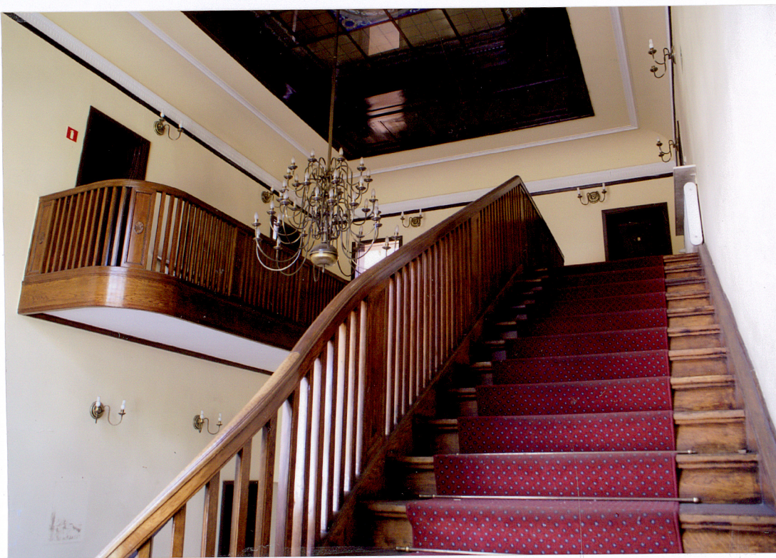
Fot. 14 Schody, galerie i żyrandol w hallu głównym budynku.