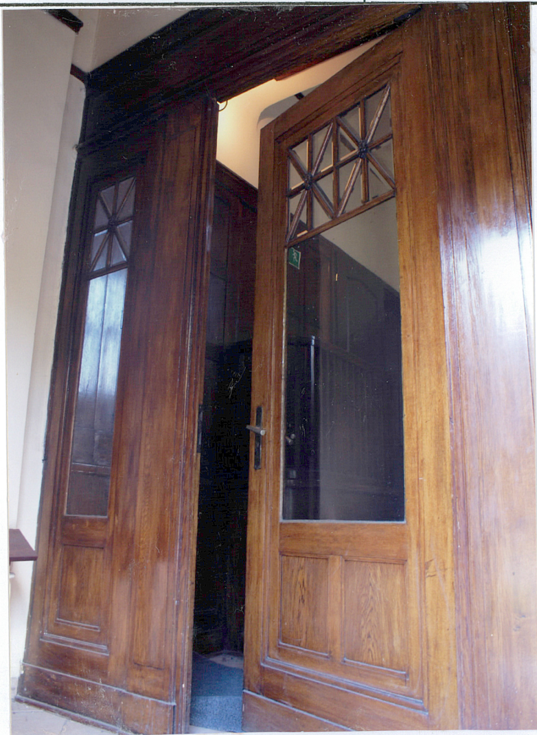
Fot. 10 Drzwi wiatrołapu małego hallu.