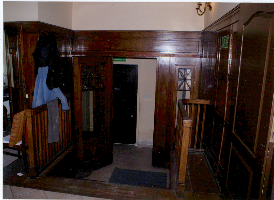
Fot. 9 Mały hall – wiatrołap i boazeria.