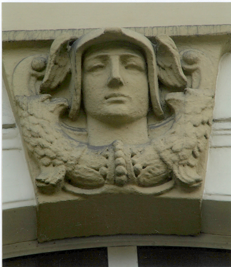
Fot. 6 Zwornik okna witrażowego fasady.