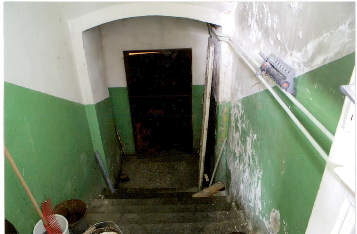
Fot. 9 Schody do piwnicy.