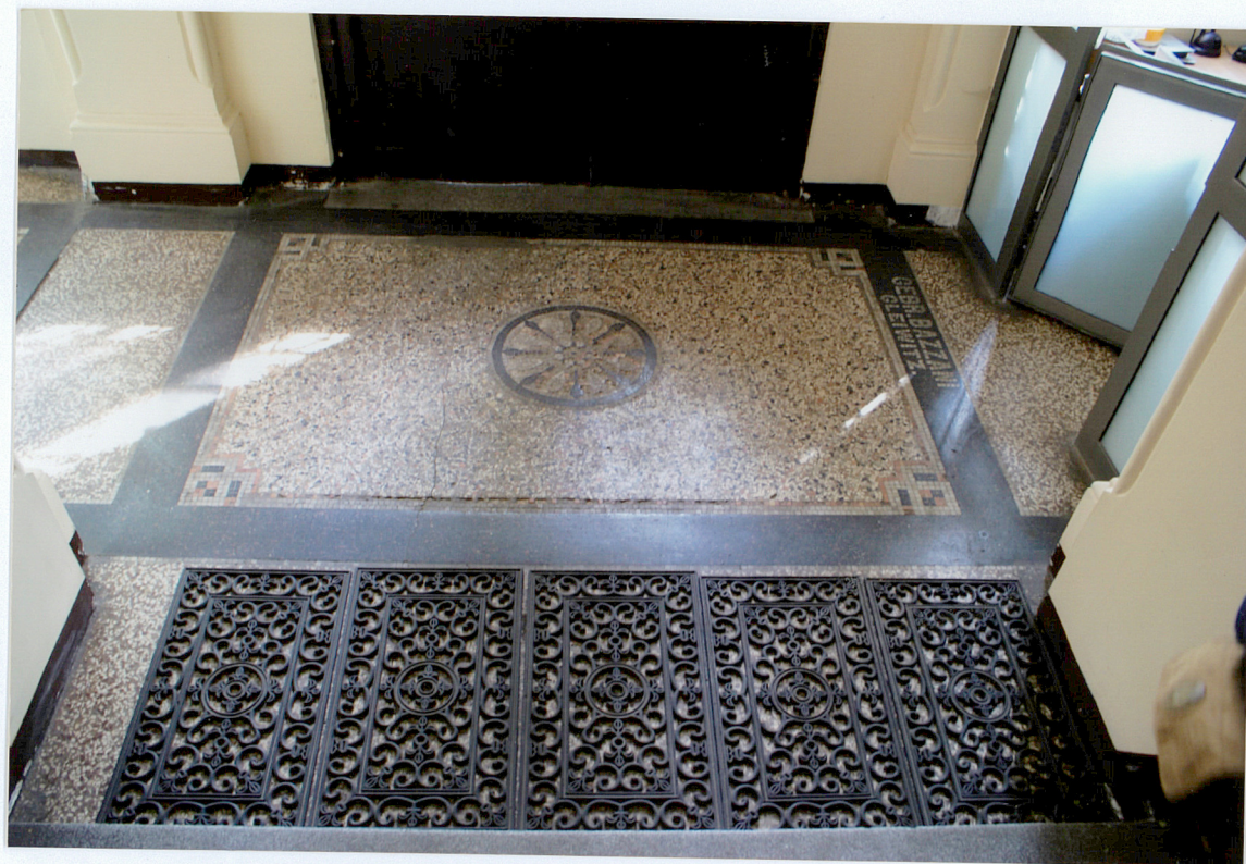
Fot. 7 Posadzka w sieni przy wejściu.