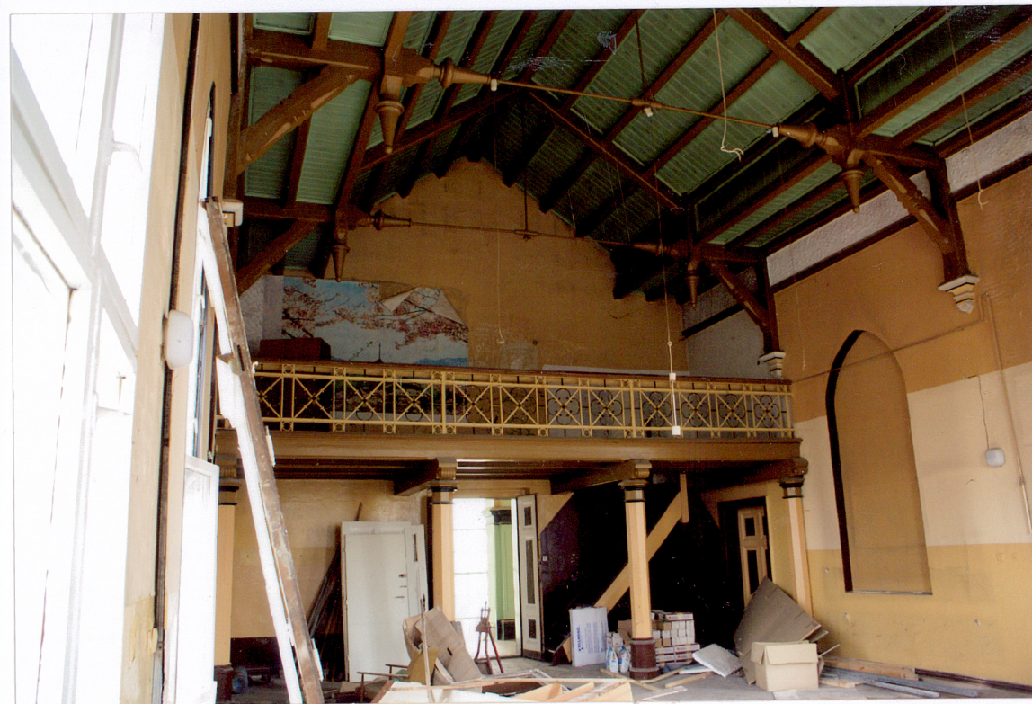
Fot. 21 Kaplica na drugim piętrze – widok na chór.

Wkładkę założył: AB OVO s. c. ul. Hoyera 6, 30-898 Kraków: mgr Paulina Lis, mgr Krystyna Zgrzebnicka (imię, nazwisko, data)