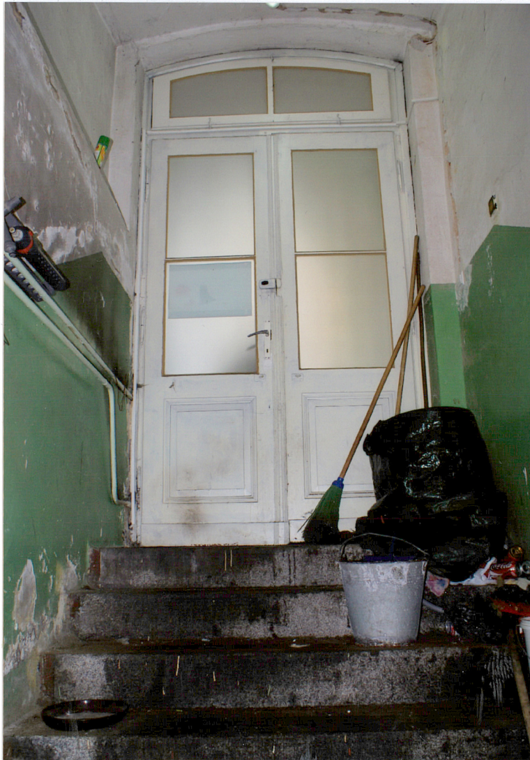
Fot. 8 Drzwi do piwnicy.