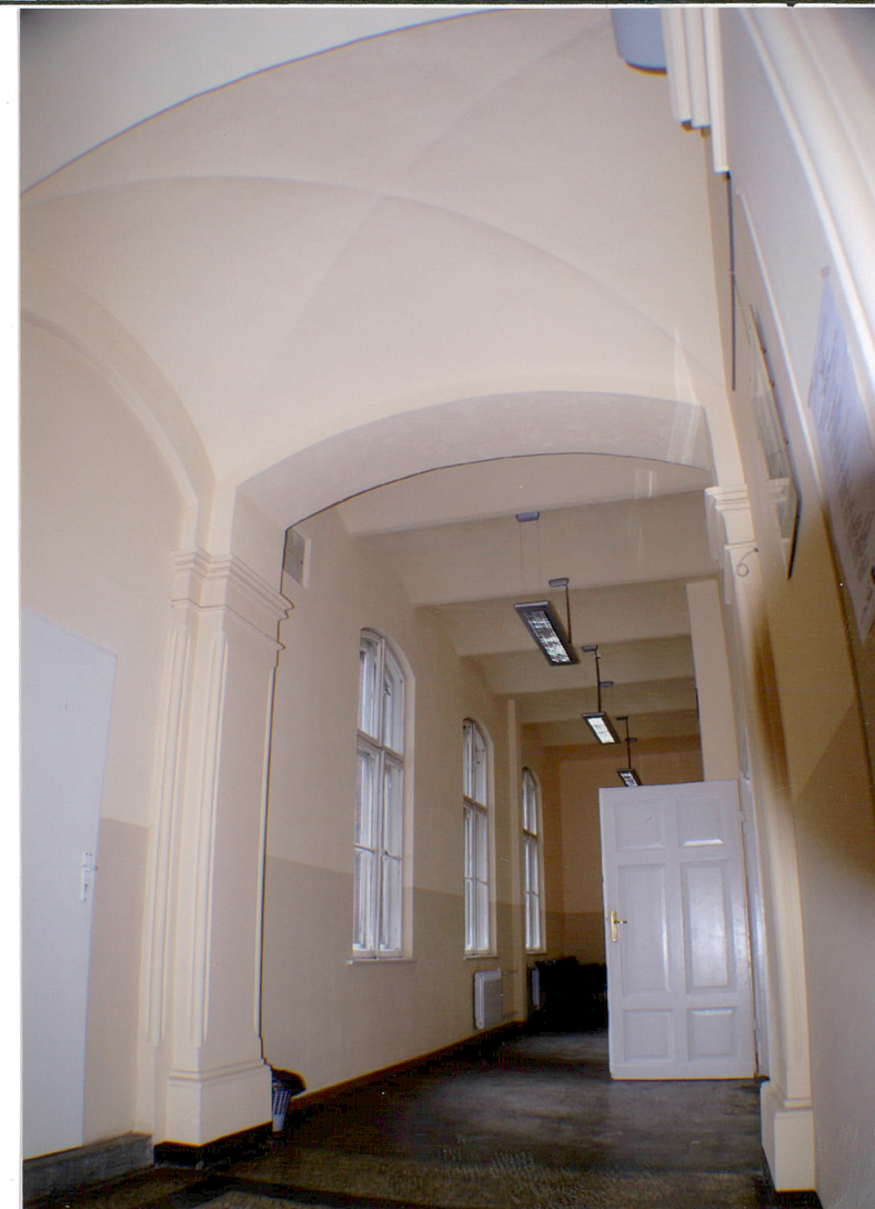
Fot. 17 Korytarz pierwszego piętra.

Wkładkę założył: AB OVO s. c. ul. Hoyera 6, 30-898 Kraków: mgr Paulina Lis, mgr Krystyna Zgrzebnicka (imię, nazwisko, data)