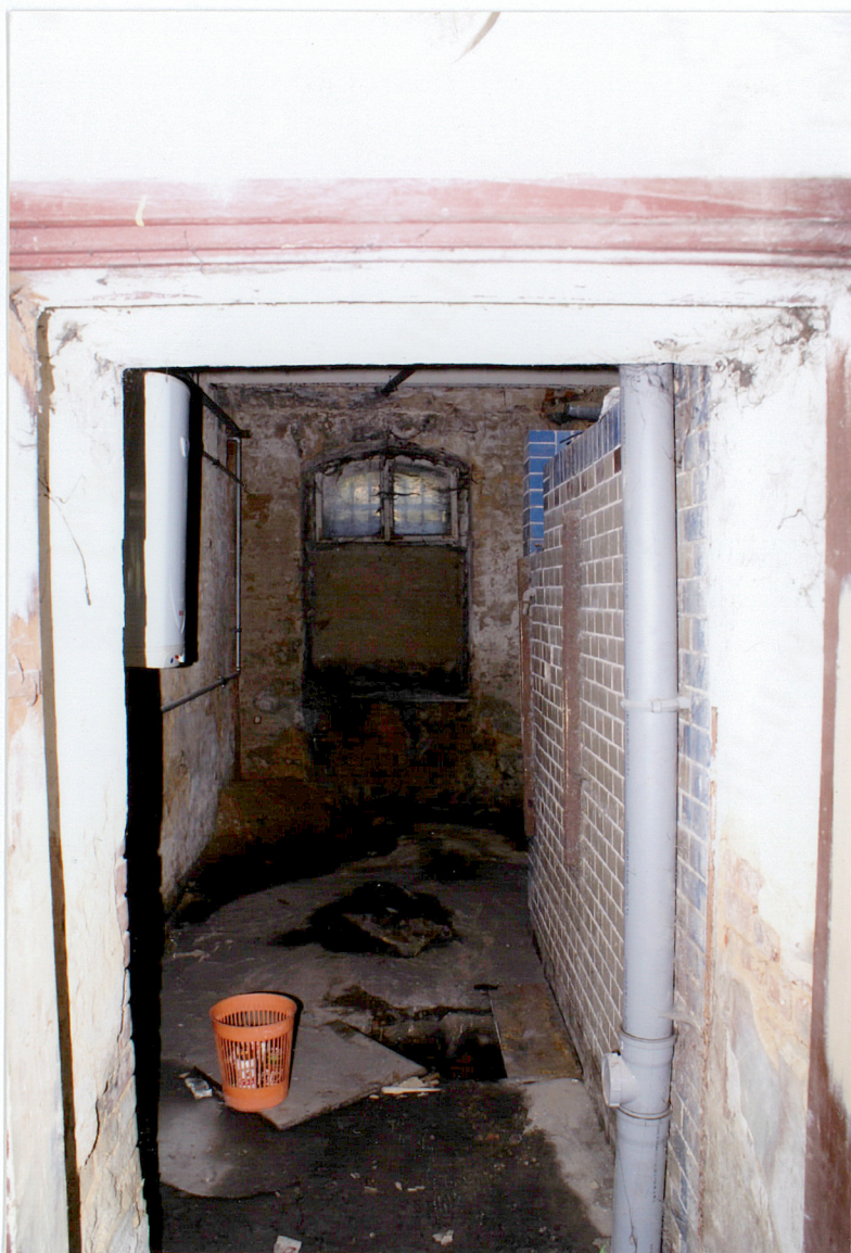
Fot. 10 Komora piwnicy w części korpusu budynku..