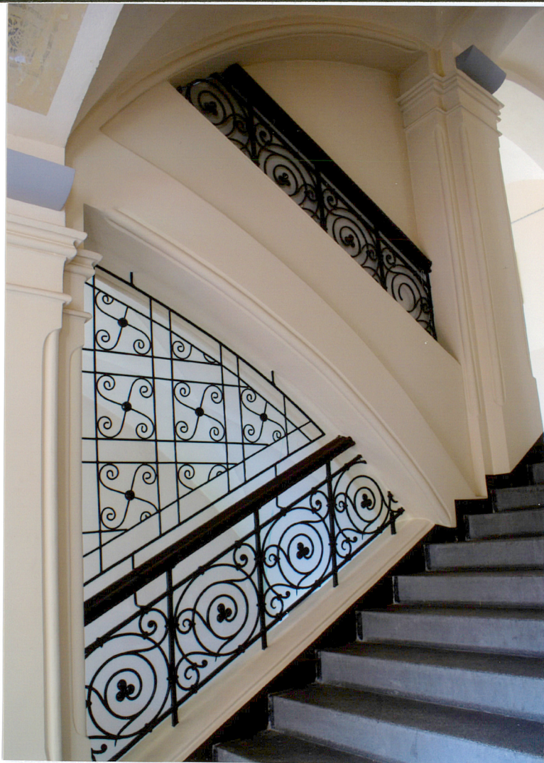
Fot. 12 Klatka schodowa.