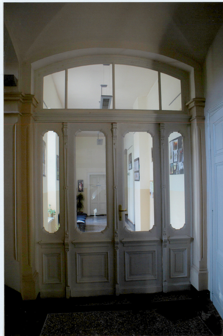
Fot. 15 Drzwi – przegroda w korytarzu parteru.