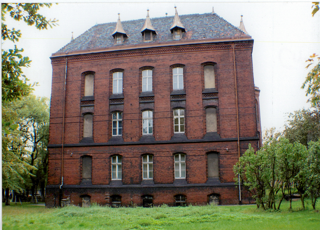
Fot. 2 Elewacja boczna, zachodnia.