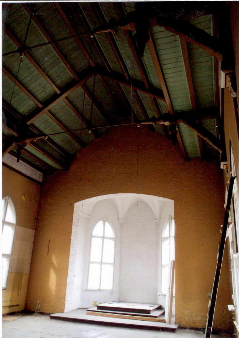
Fot. 20 Kaplica na drugim piętrze – widok na prezbiterium.