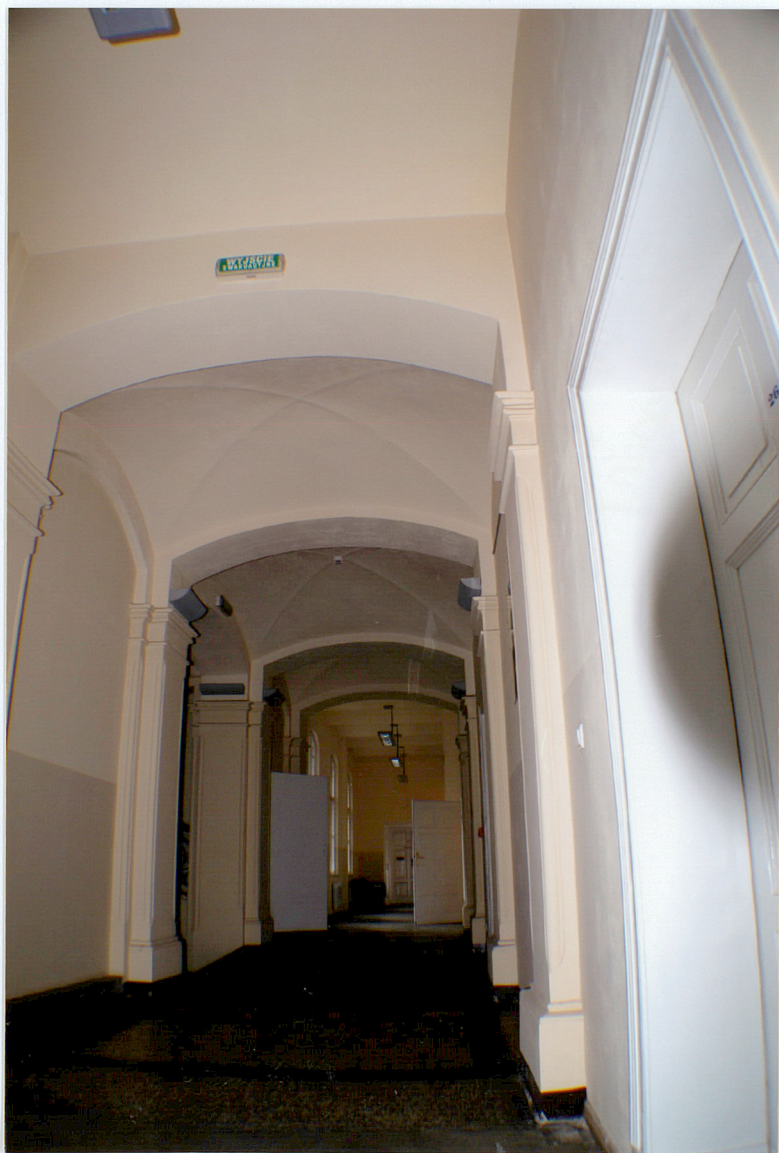
Fot. 14 Korytarz parteru.