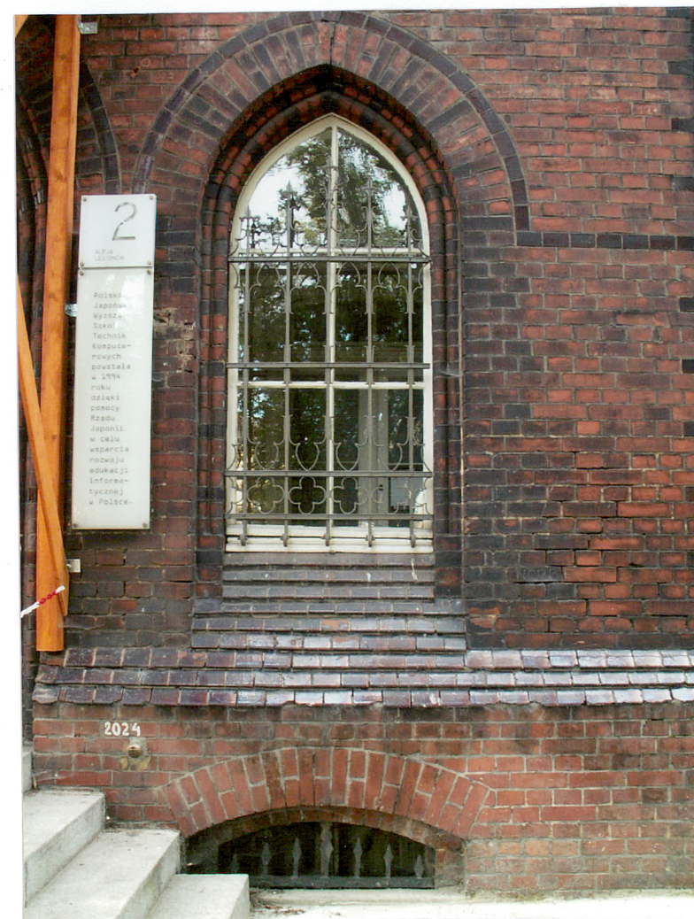
Fot. 5 Fasada – okno na parterze ryzalitu środkowego.

Miejsce przechowywania negatywów: AB OVO s. c. ul. Hoyera 6, 30-898 Kraków 12 GRU. 2007