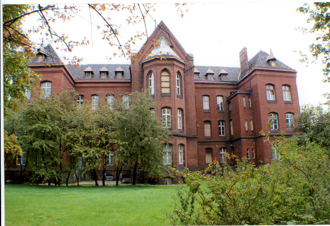
Fot. 4 Elewacja tylna - północna.

Wkładkę założył: AB OVO s. c. ul. Hoyera 6, 30-898 Kraków: mgr Paulina Lis, mgr Krystyna Zgrzebnicka (imię, nazwisko, data)