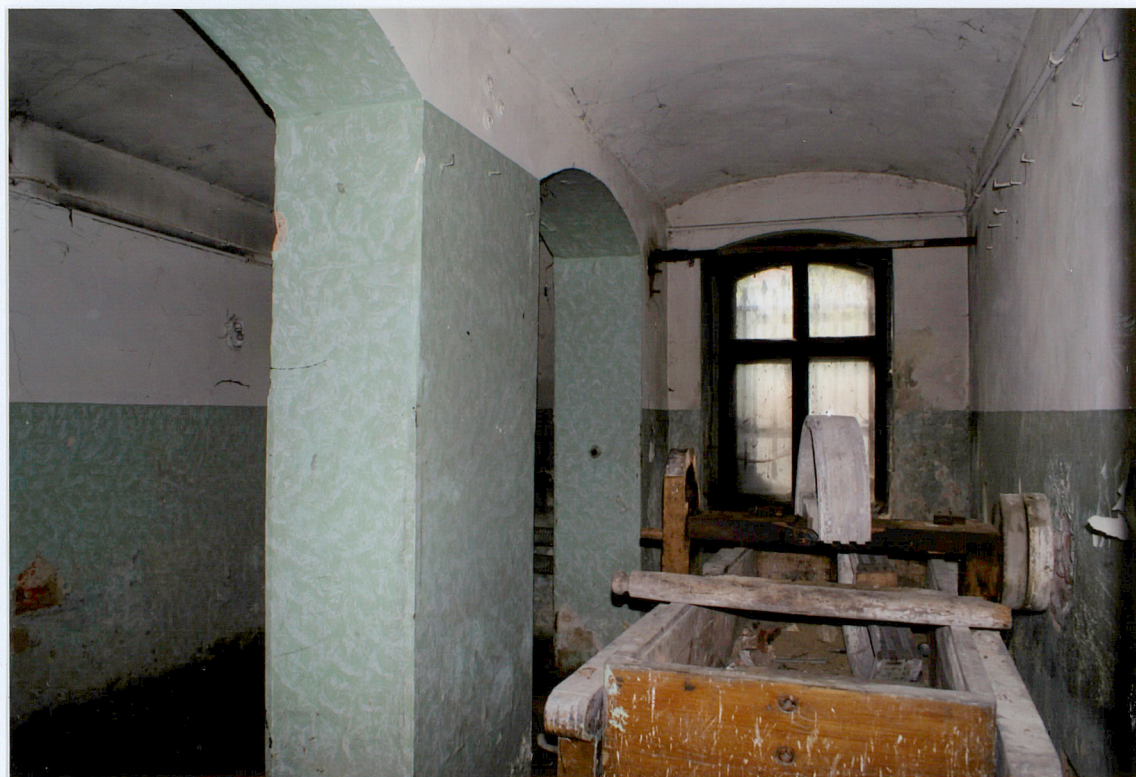
Fot. 11 Komora w zachodniej części piwnic – pozostałość magła.