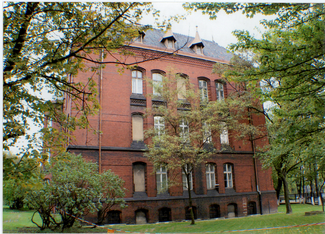
Fot 3 Elewacja boczna, wschodnia.