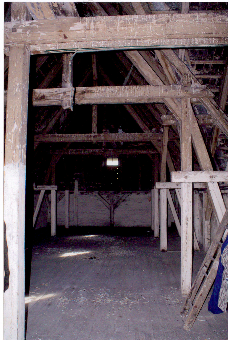
Fot. 23 Więźba dachowa.