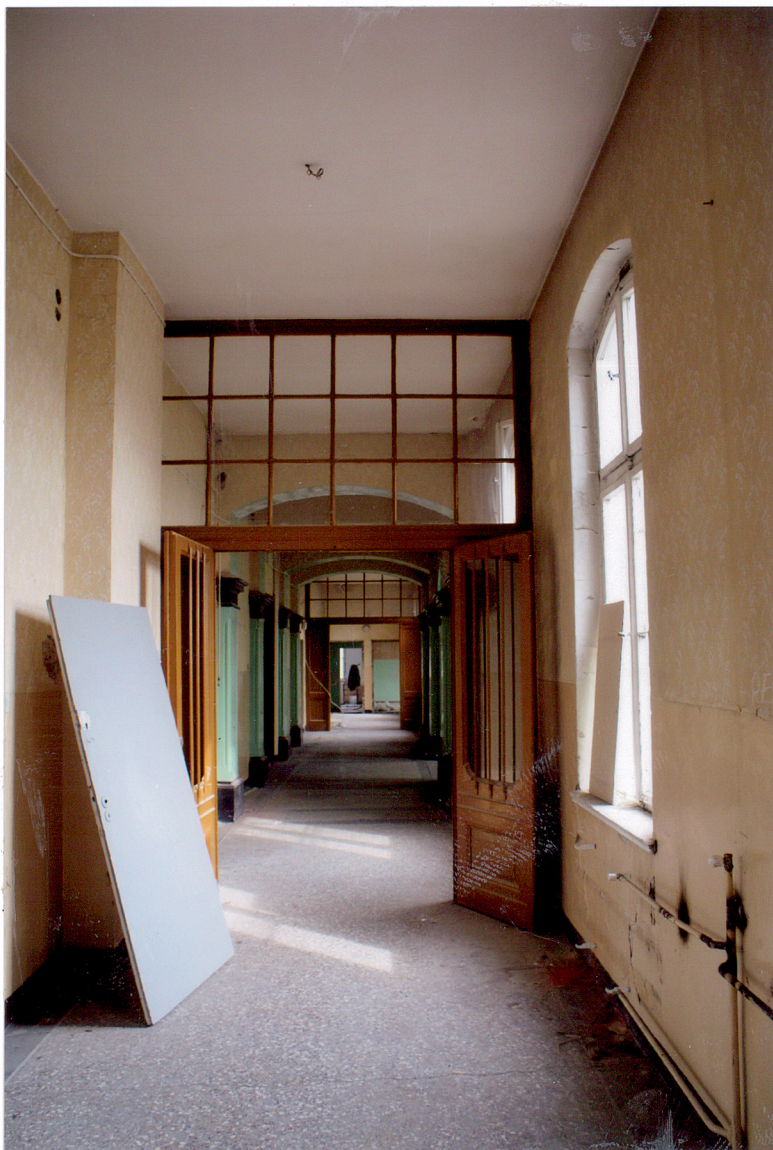
Fot. 22 Korytarz drugiego piętra.