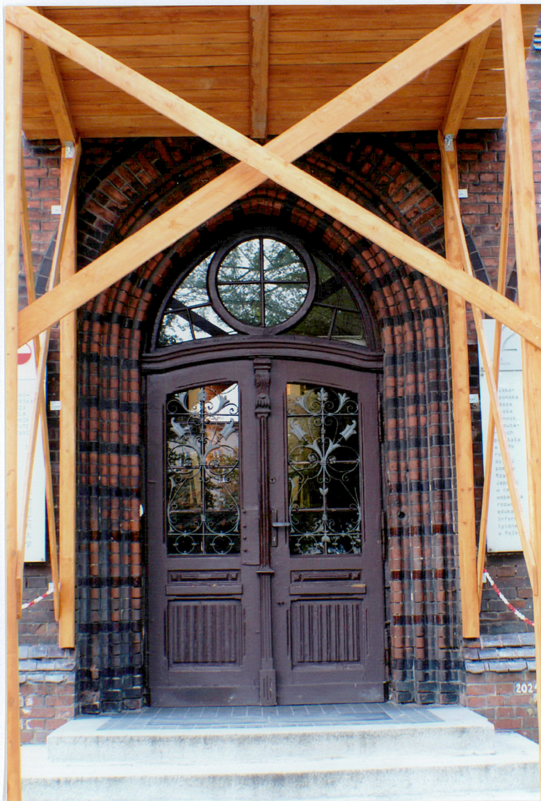
Fot. 6 Fasada – portal.