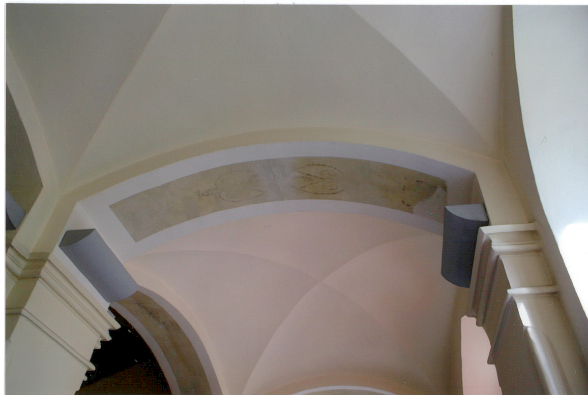
Fot 13 Sklepienie klatki schodowej. Na gurtach fragmenty polichrom

Wkładkę założył: AB OVO s. c. ul. Hoyera 6, 30-898 Kraków: mgr Paulina Lis, mgr Krystyna Zgrzebnicka