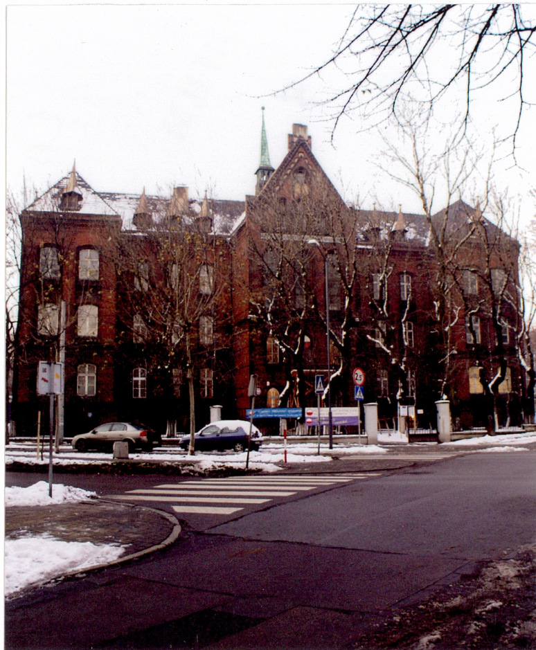
Fot. 1 Fasada

11. Zdjęcia, rzut, przekrój, sytuacja, orientacja