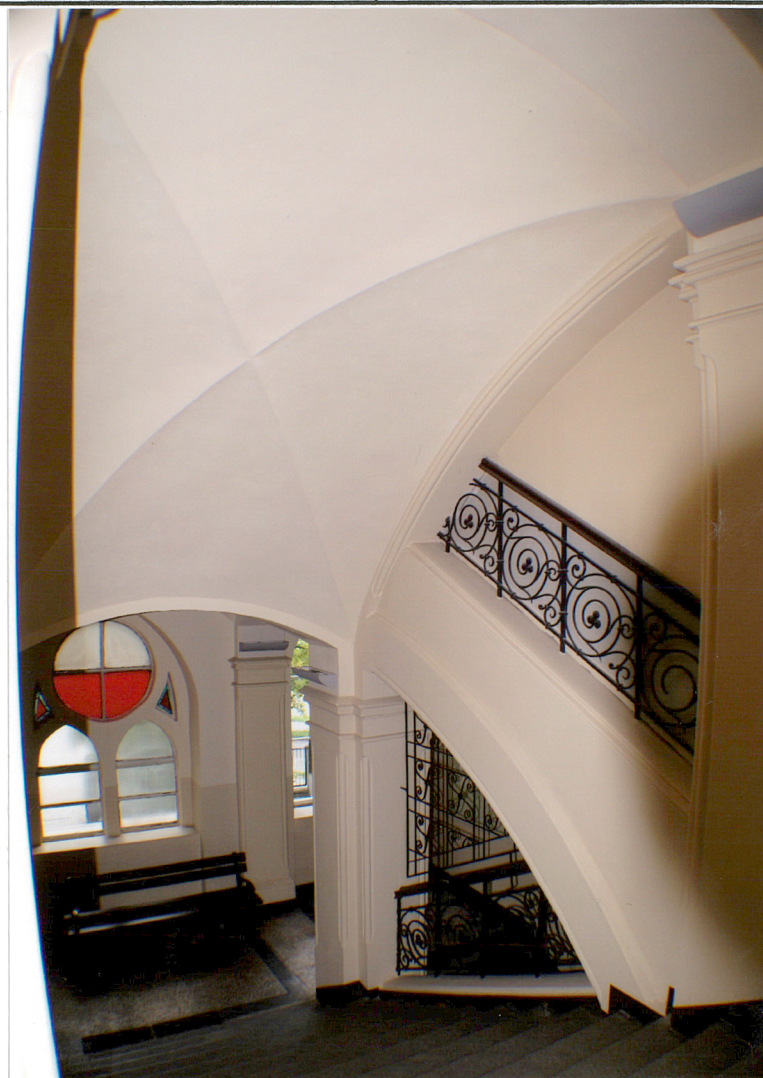
Fot. 16 Klatka schodowa – widok z korytarza pierwszego piętra.