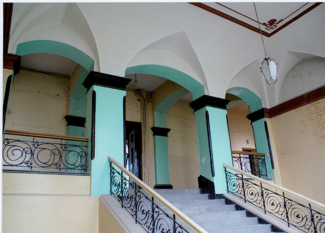
Fot. 18 Ostatnie piętro klatki schodowej.