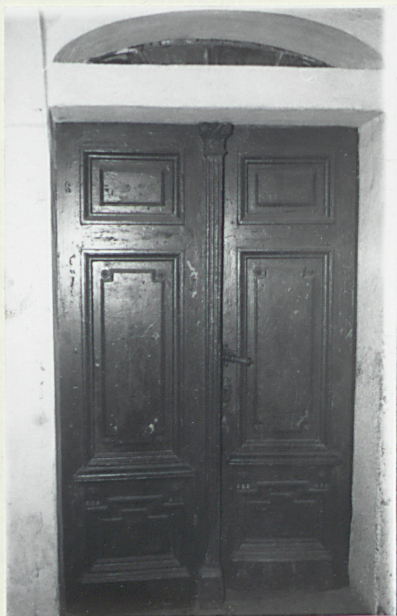
1. Widok na drzwi wejścia głównego.