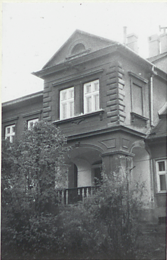
1. Widok na facjatę z arkadowym portykiem /elewacja frontowa/.