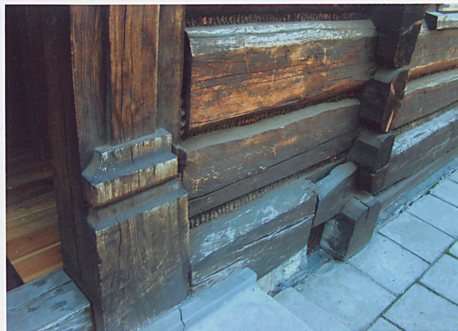
Detal drzwi wejściowych