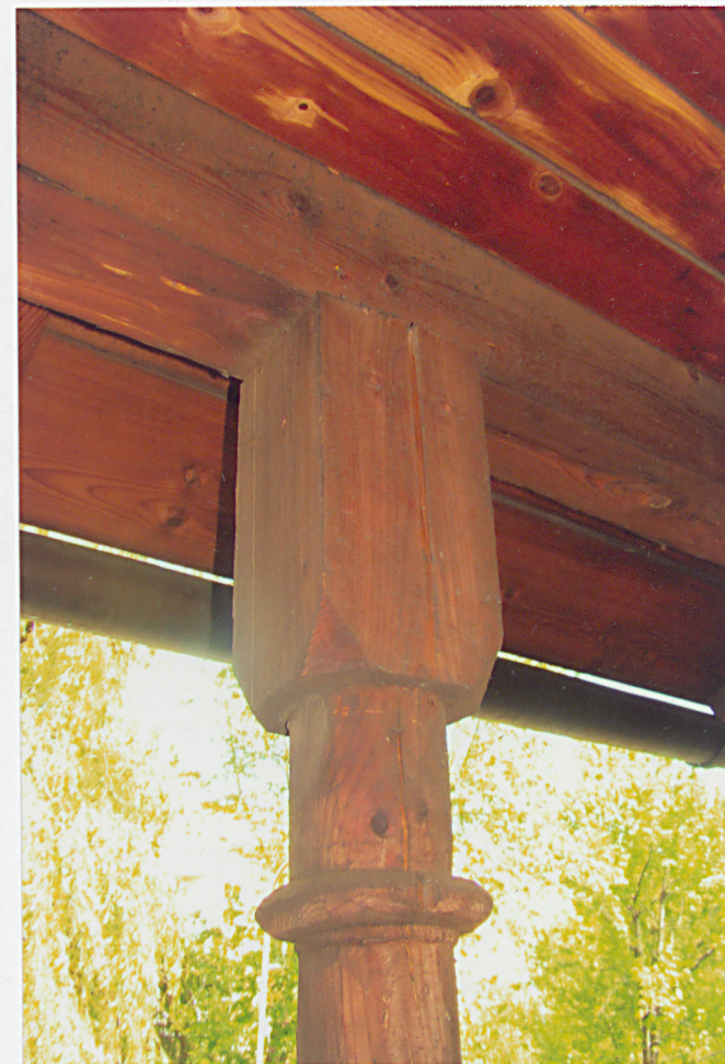
Słupek podtrzymujący dach