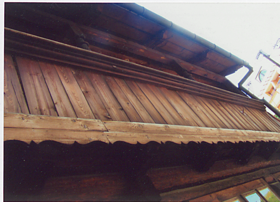
Ganek fasady północnej