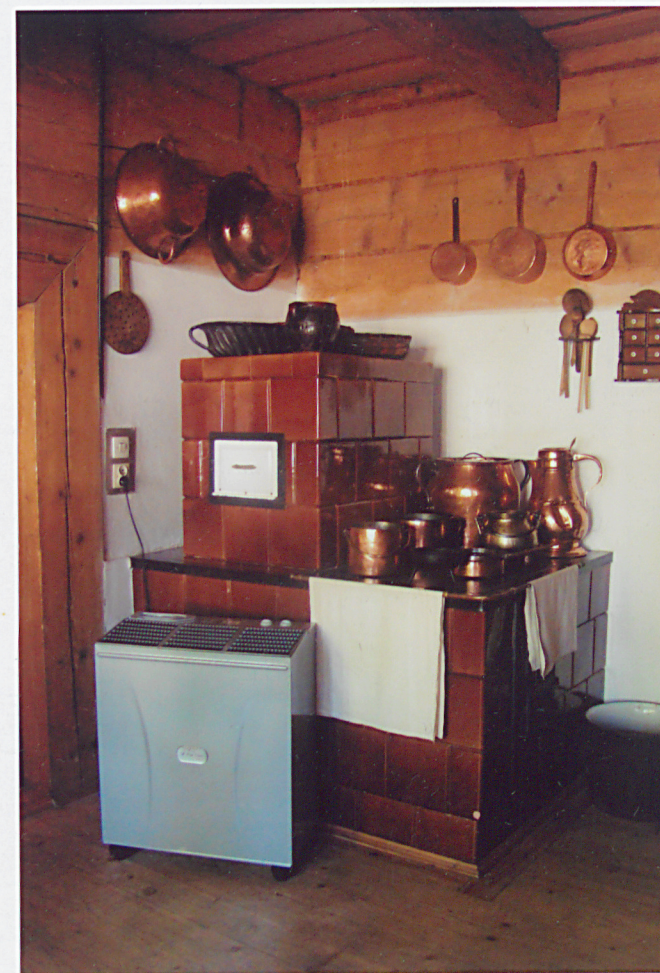
Piec kaflowy w kuchni