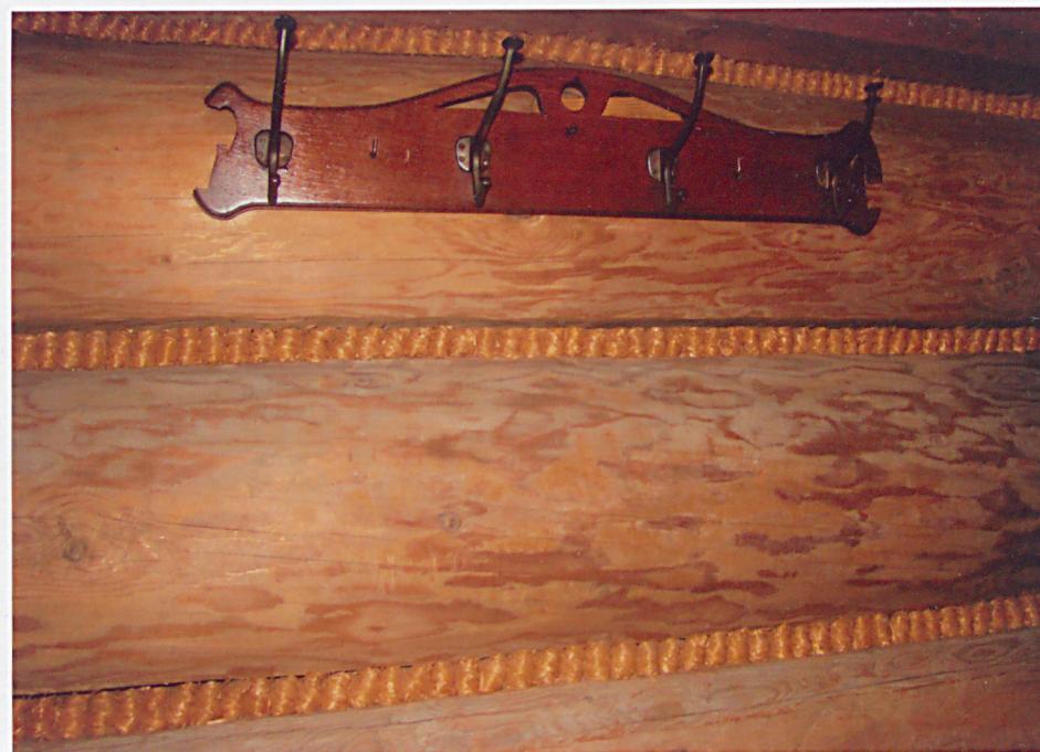
Widok ściany wewnętrznej