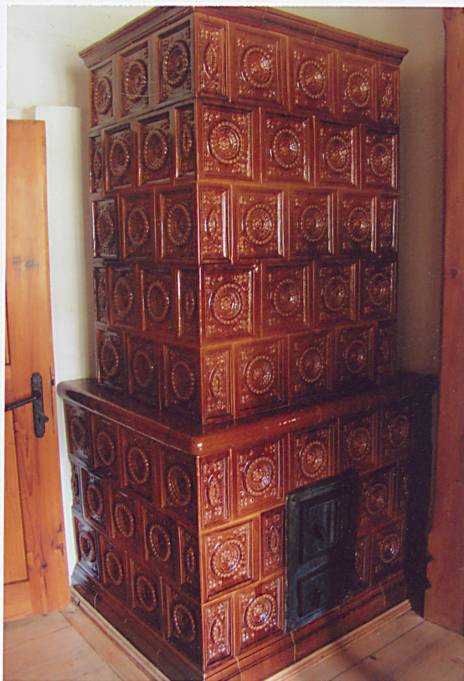
Piec kaflowy w sypialni