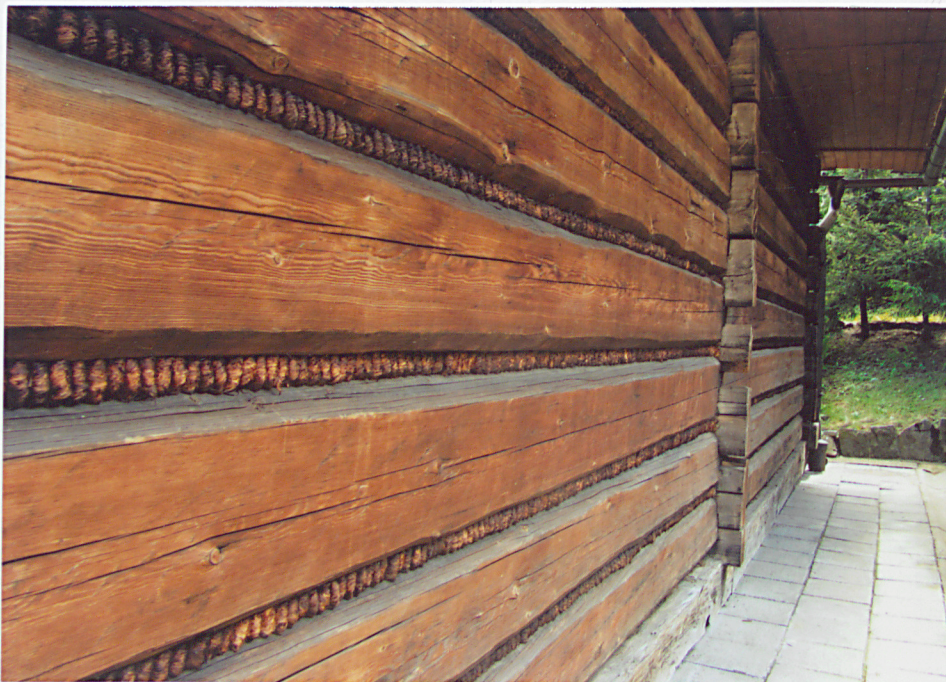
Widok ściany zewnętrznej