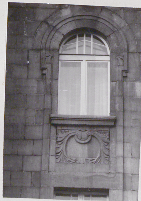
okno 4-ej kondygnacji