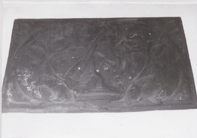
płaskorzeźba w sieni