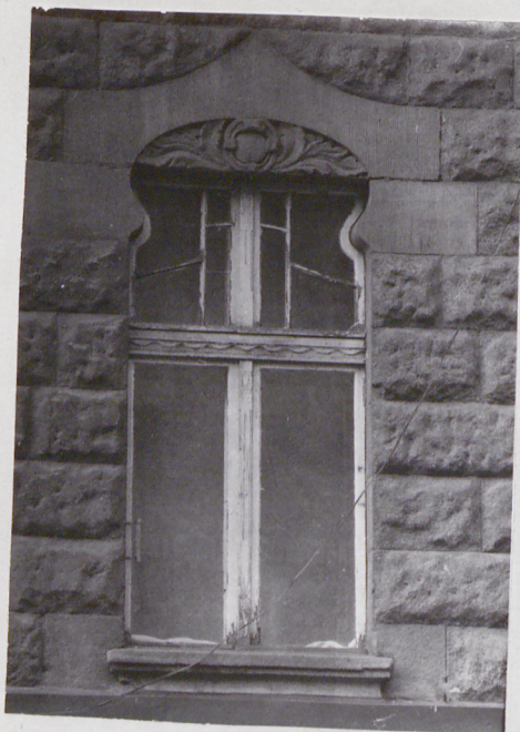
okno 2-ej kondygnacji