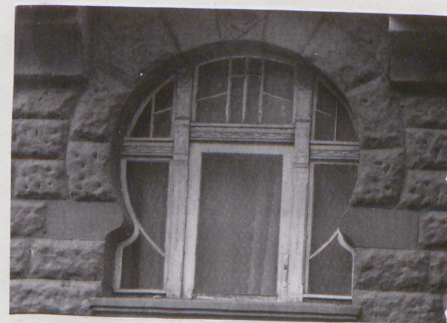
okno pod wykuszem