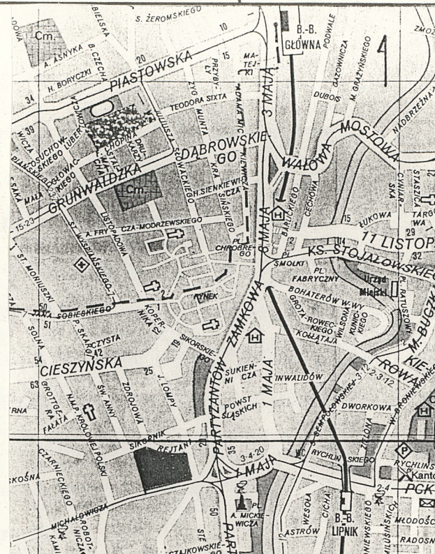
Plan orientacyjny 1 : 17 000

4. Adres Bielsko-Biała ul. Michałowicza 2/Sikornik nr hipoteczny