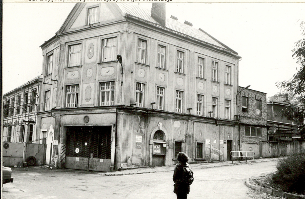
Widok od pn.-wsch.

11. Zdjęcia, rzut, przekrój, sytuacja, orientacja