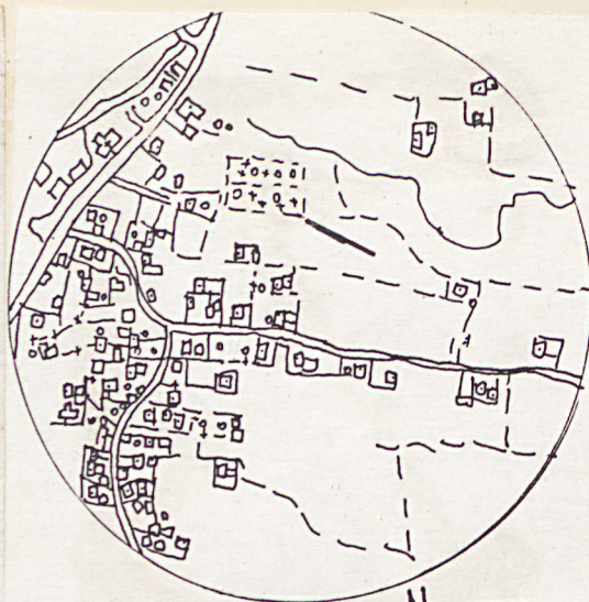
GILOWICE SKALA 1:10 000