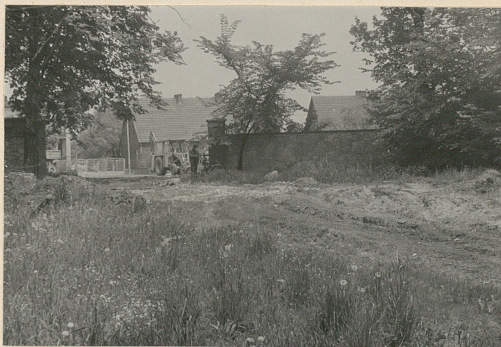
Wnętrze cmentarza, część pn. z bramą.