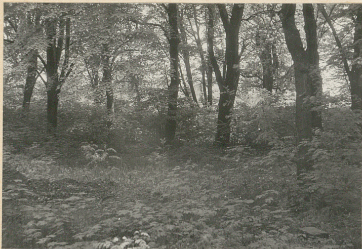
Wnętrze cmentarza, część pd-wsch.