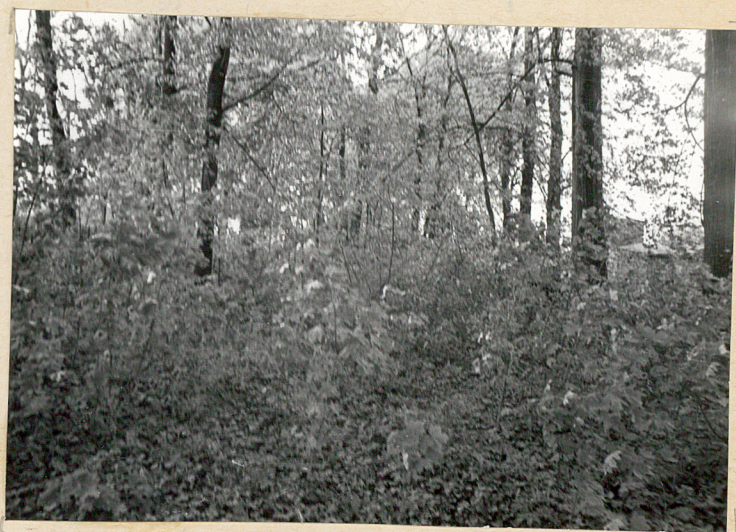
4. Wnętrze cment. część zachodnia