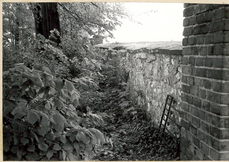
3. Fragment muru ogr. od wnętrza cment.