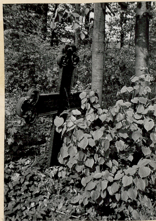
10. Krzyż na mogile - 1869 r