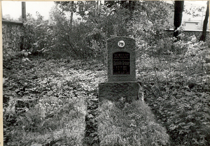
6. Grób Mathildy Graser + 1926 /wschodnia część cment.