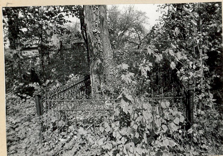
7. Fragment zach. części cment.