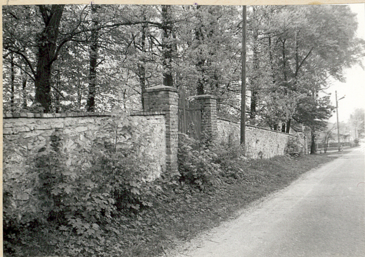
1. Widek cmentarza od strony pñ.