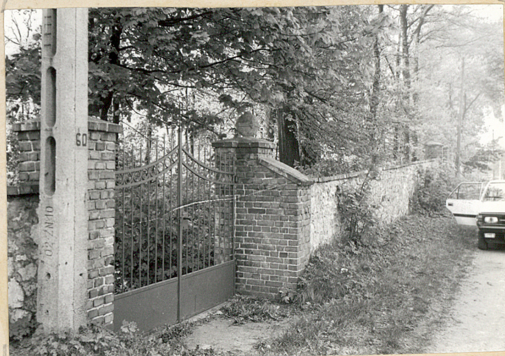
2. Brama we wschodniej części cmentarza