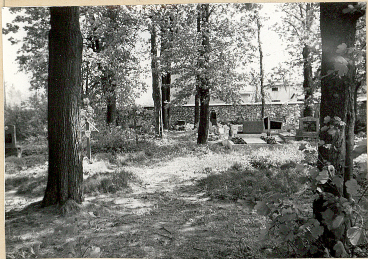
5. Wschodnia część cmentarza-alajka