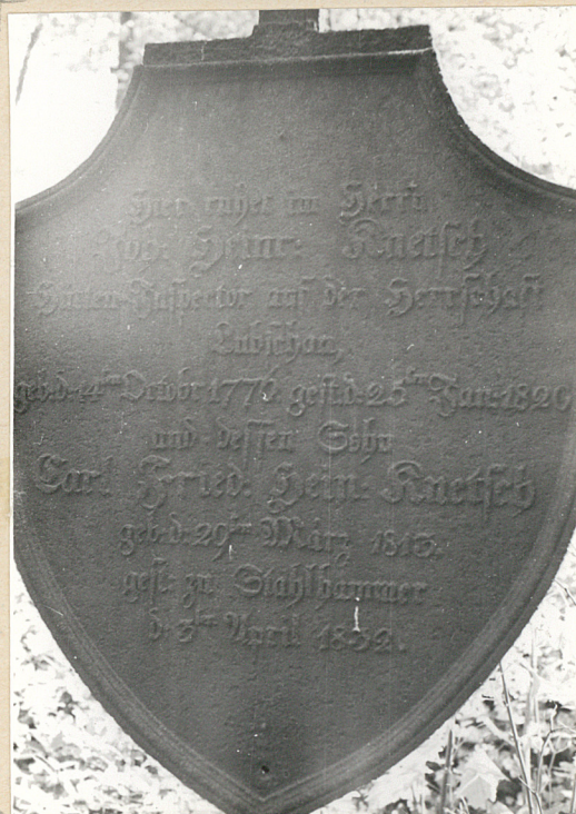
8. Najstarszy grób Ruetsch ów, ok. 1832 r.