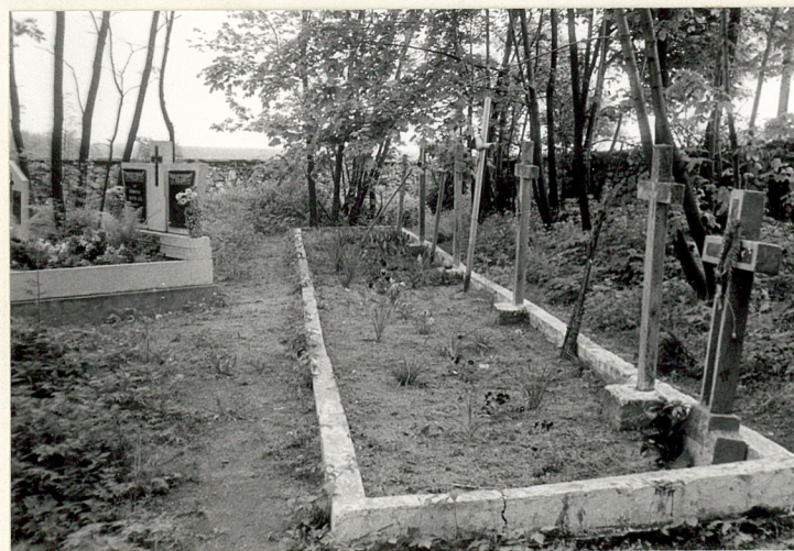
25. Mogiła żołnierzy polskich, poległych we Włoszech 1939.