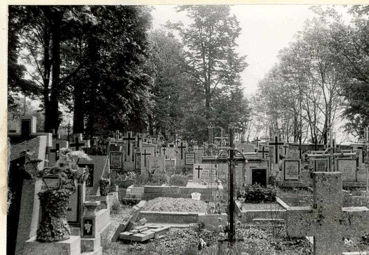
15. Groby na południe od alei głównej.