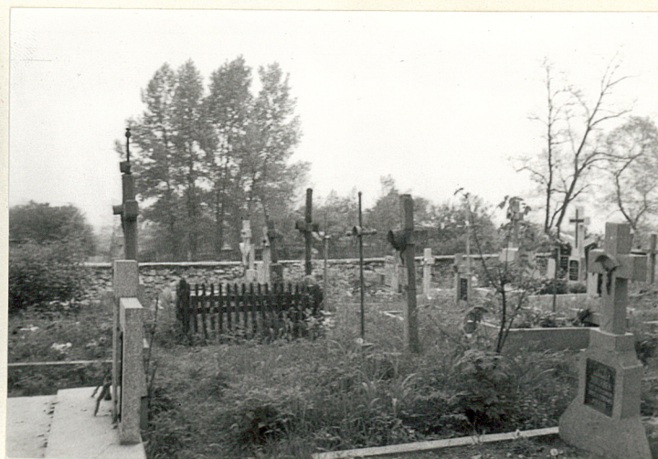
17. Groby na północ od alei głównej.