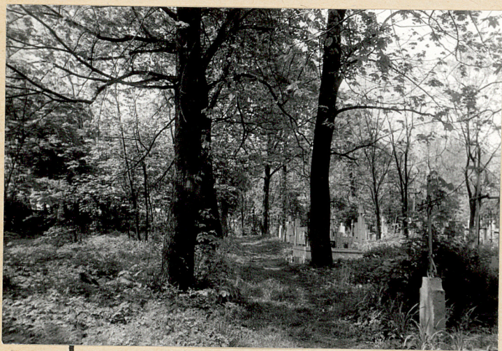
9. Aleja nadłuz wschodniego muru