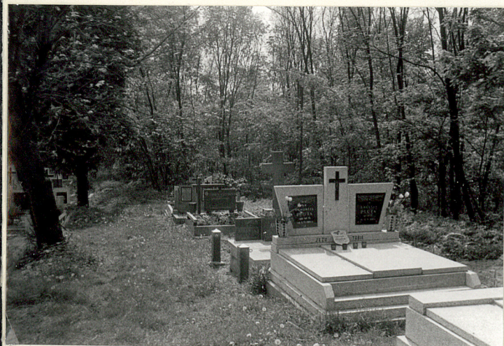
16. Groby z pñ. wsch. części cmentarza.