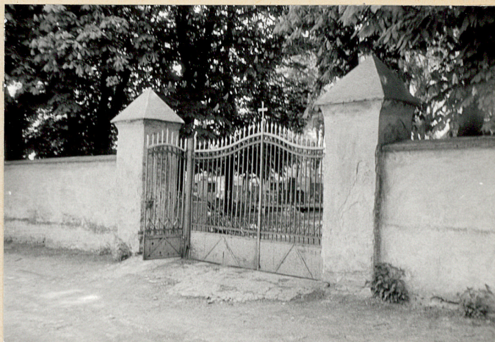
2. Brama cmentarna