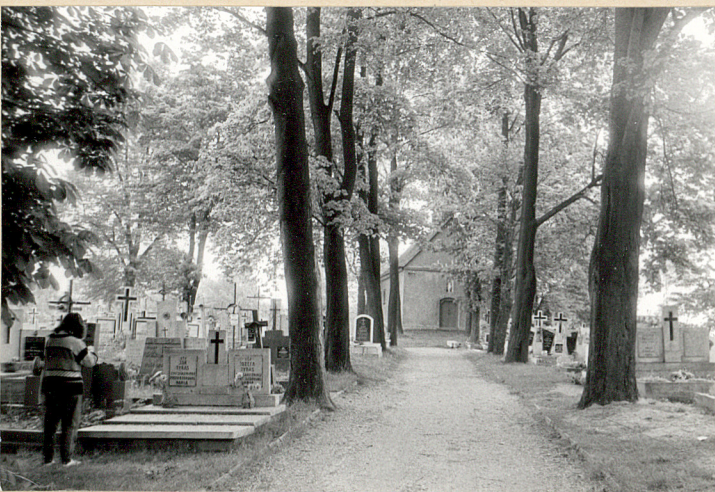
3. Główna aleja - widok w kierunku wsch.