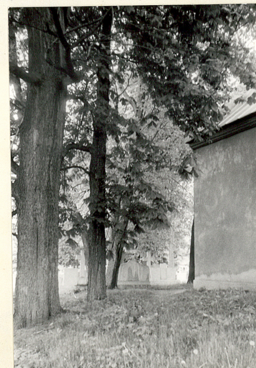
18. Grupa drzew na pñ. od kościoła emen.