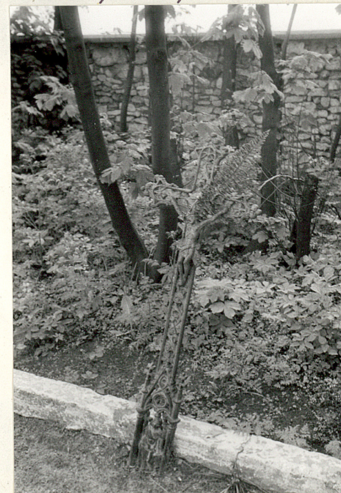
25. Żelazny krzyż na mogile z 1939.