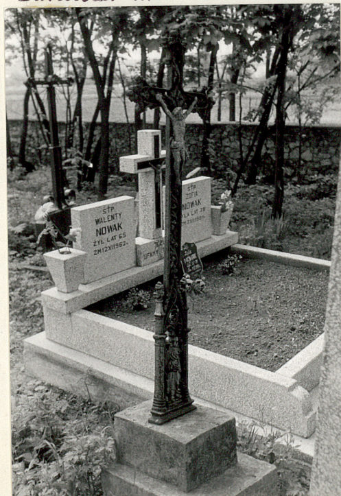
24. Żelazny krzyż na marmurowym grobie