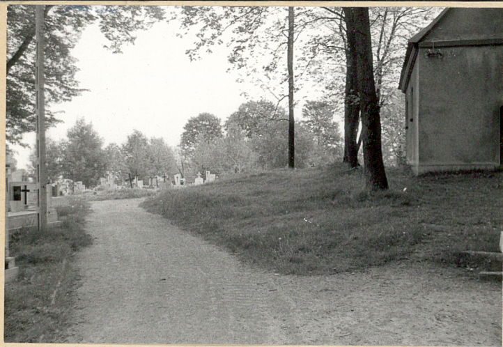
5. Końcowy fragment głównej alei (przy kościele ementarnym)