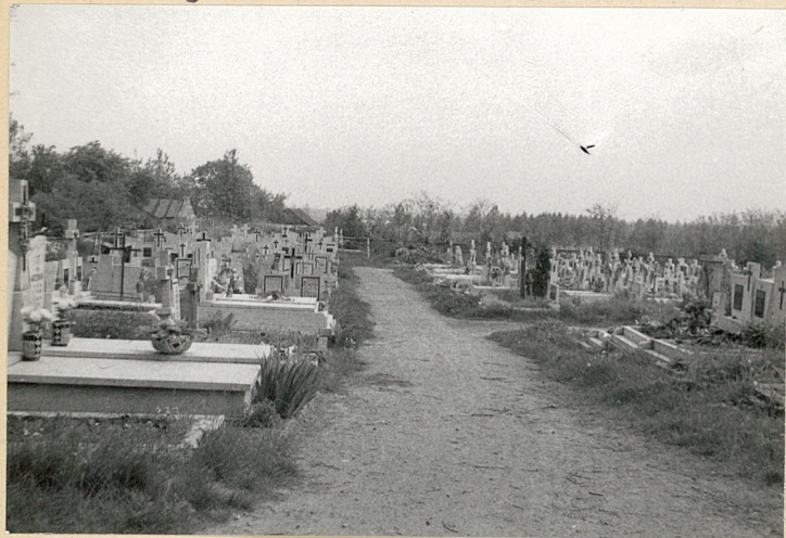
7. Aleja w północnej części ementarza