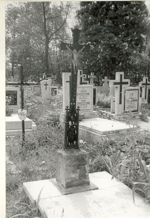
22. Grób Józefa Kocornika ze starym żelaznym krzyżem.