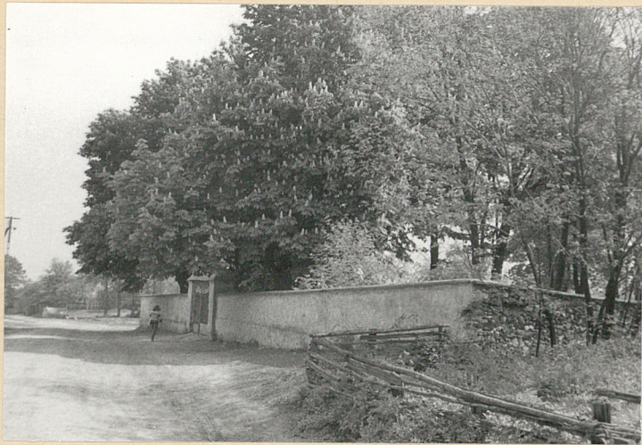
1. Widok cmentarza od pTd.-zach.