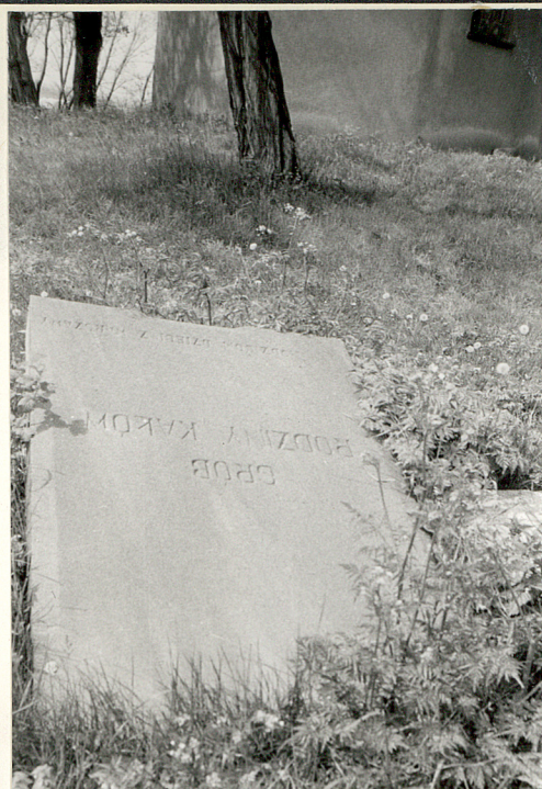
20. Płyta z grobu rodziny Karonów