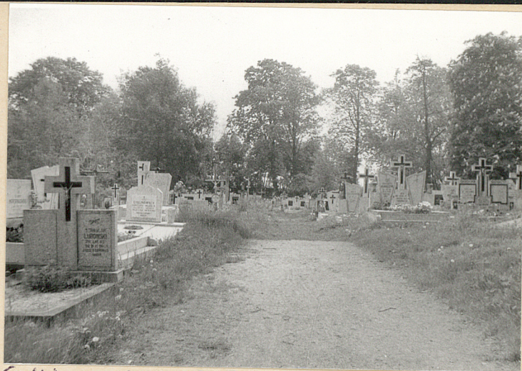
6. Aleja za kościołem ementarnym