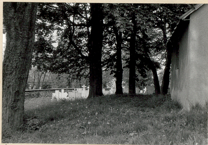
8. Grupa drzew na pld. od kościoła ementarnego