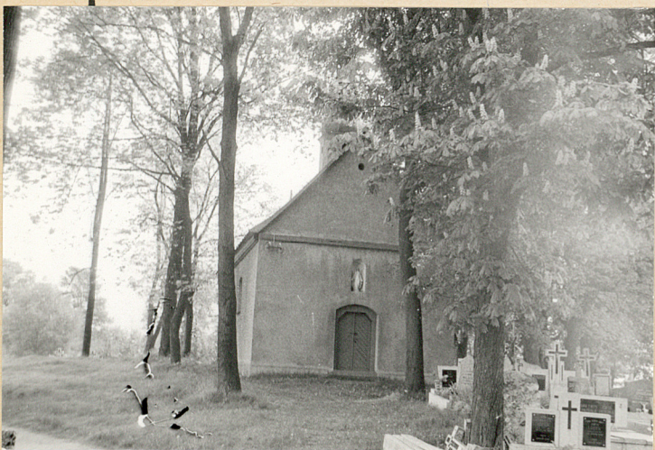
11. Kościół ementarny - widok od zachodu