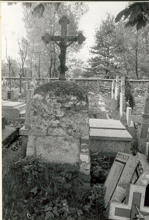
19. Najstarszy grób proboszczowski Zurawskich.