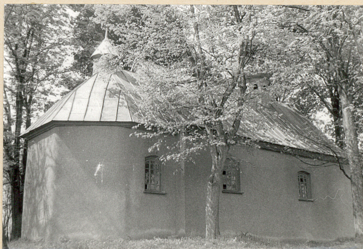
12. Kościół ementarny - widok od północy