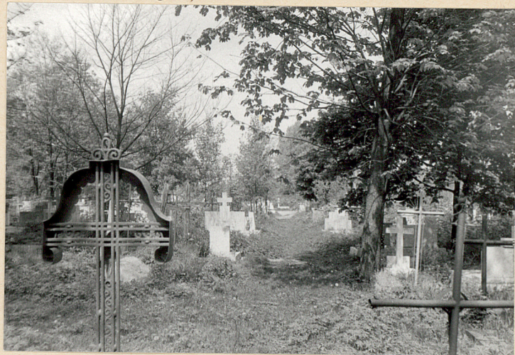
10. Aleja za kościołem ementarnym