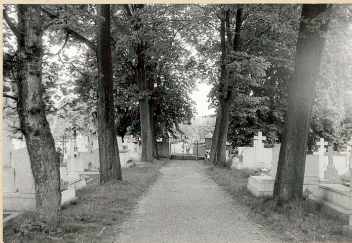
4. Główna aleja - widok od wschodu.