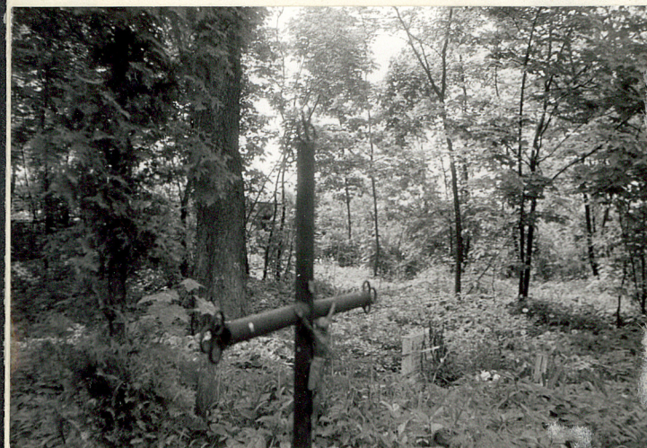
13. Południowo-wschodnia część cmentarza