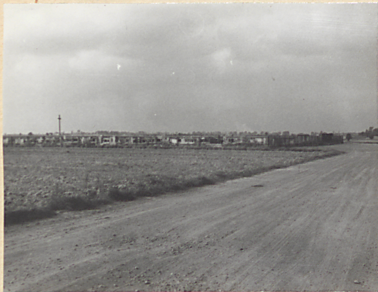
WIDOK CMENTARZA OD POŁUDNIA