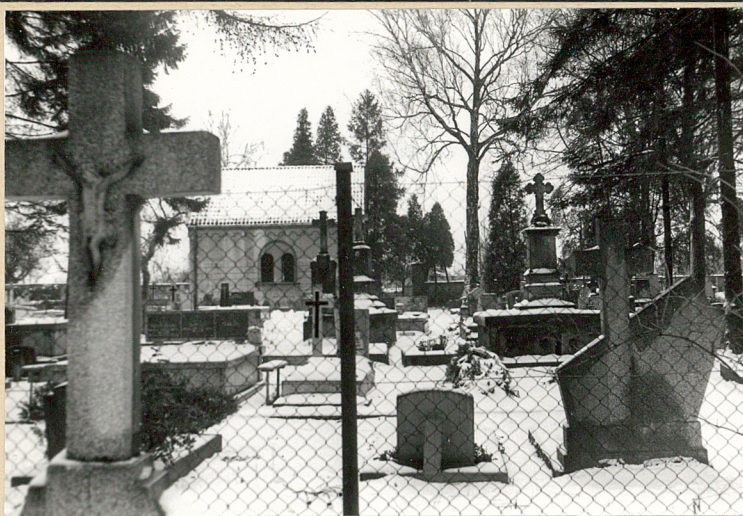
Widoki na cmentarz ewangelicki od strony cmentarza rymsko-katolickiego /z kwatery 22/