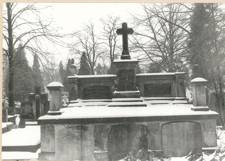
Grobowiec rodziny Franke