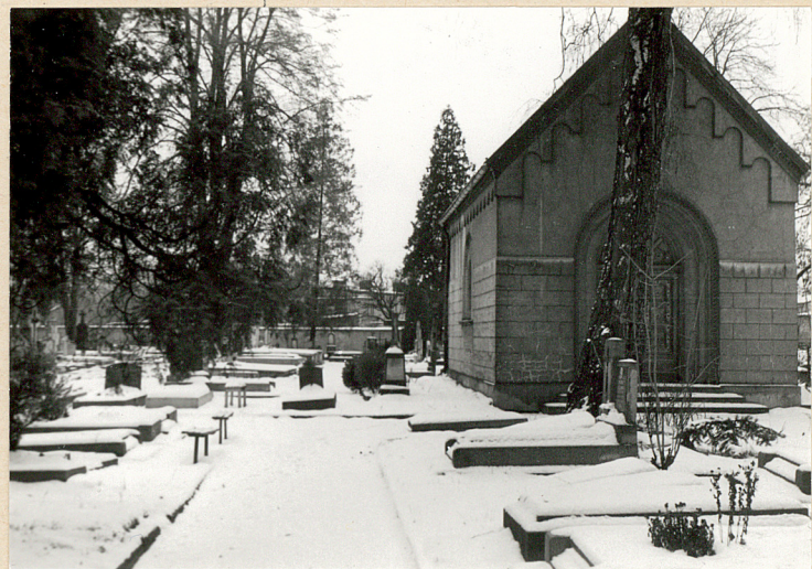
kaplica cmentarna - widok od wschodu