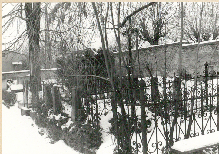
Groby w żeliwnych ogrodzeniach /półn.-zach. część cmentarza/