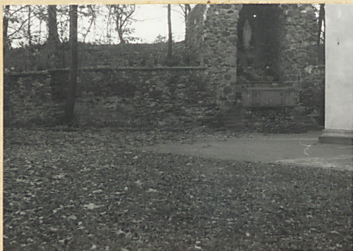
Widok na stronę pn