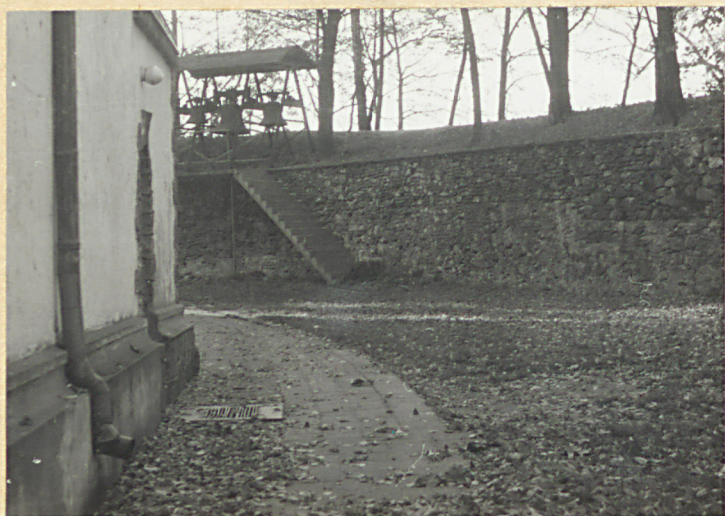
Widok na stronę pn-zach