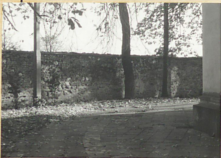
Widok na stronę pół-zach.