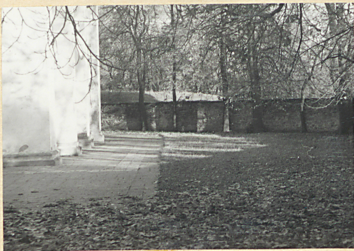
Widok na stronę pół-wsch.