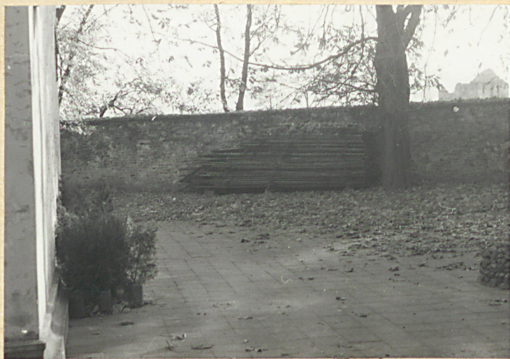
Widok na stronę pół.