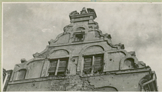
rysunek elew. frontowej