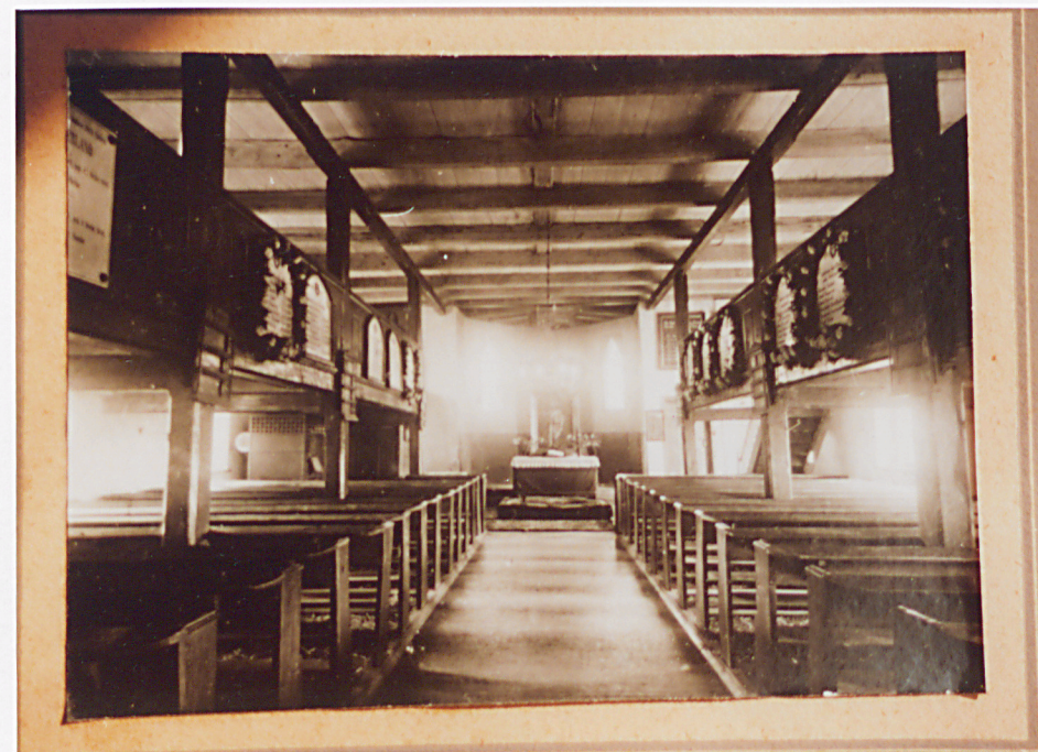
Kopie zdjęć kościoła z 1cw.XX w. w zbiorach parafii