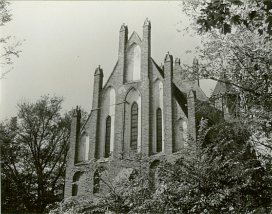
STAN W 1964.

G. SCHMID · DIE BAU- UND KUNSTDENKMÄLER Dachau - Gek, Ordensland Preussen, 1952, s. 124. DOMESANIEN, H. 3, OZG. 1909 s. 278-9.