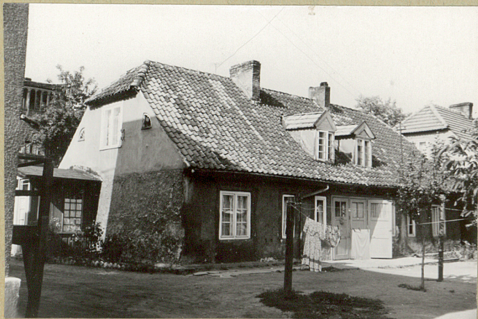
widok od tytu