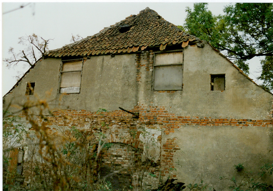
5. Elewacja północna dworu - widok z wnętrza oficyny