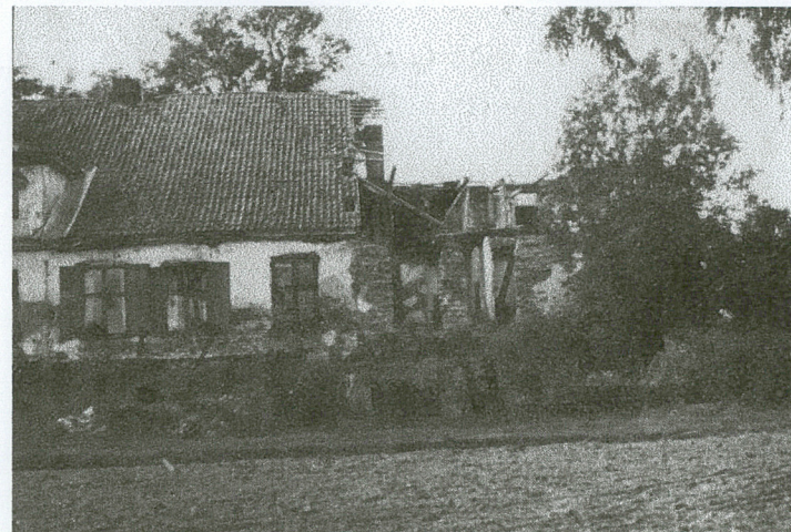
2. Dwór i oficyna - elewacje wschodnie, zdjęcie z 1959 r.