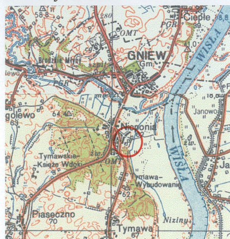
Mapa topogr., 1982 r., skala 1:100000