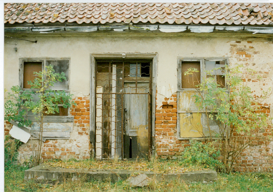
7. Główne wejście do dworu w elewacji zachodniej