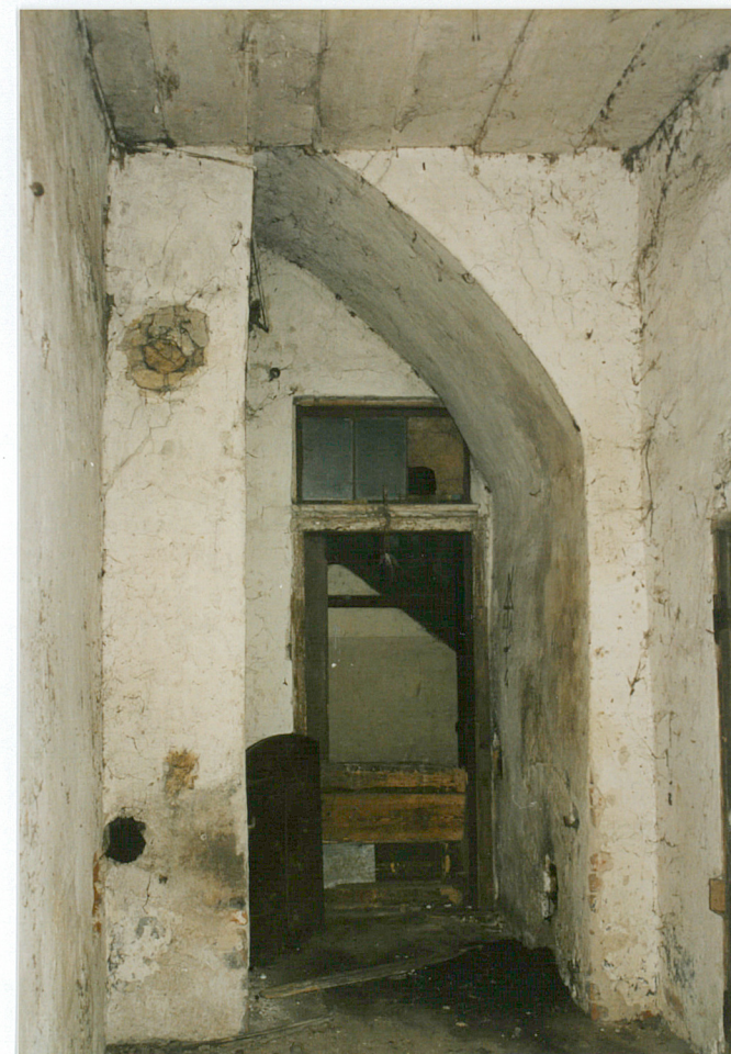
13. Korytarz, widok w kierunku sieni; po bokach widoczne dwa przewody kominowe, schodzące się na poddaszu w tzw. szeroki komin