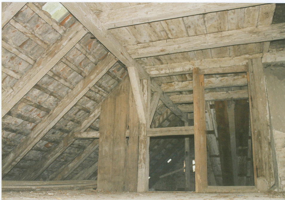
19. Więzba dachowa