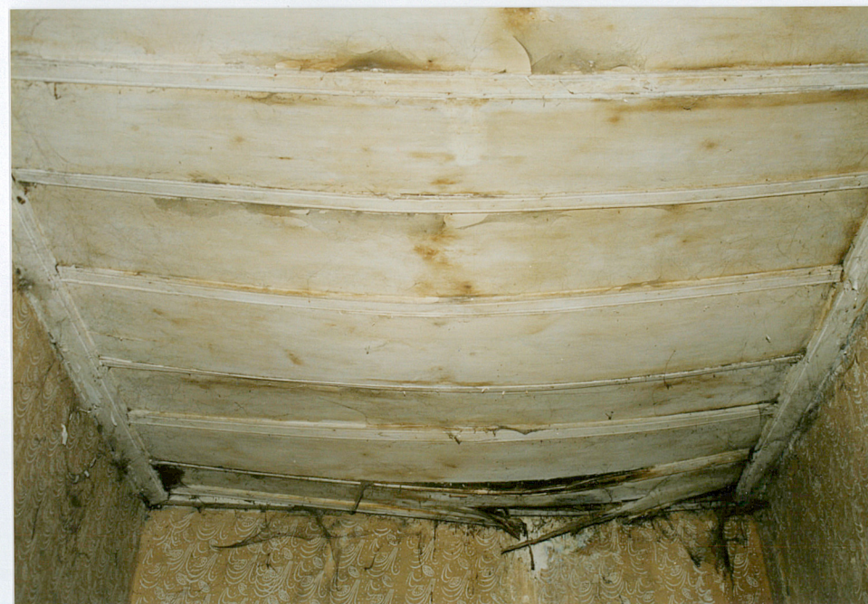
16. Strop w bocznym pomieszczeniu (alkierzu) przyziemia