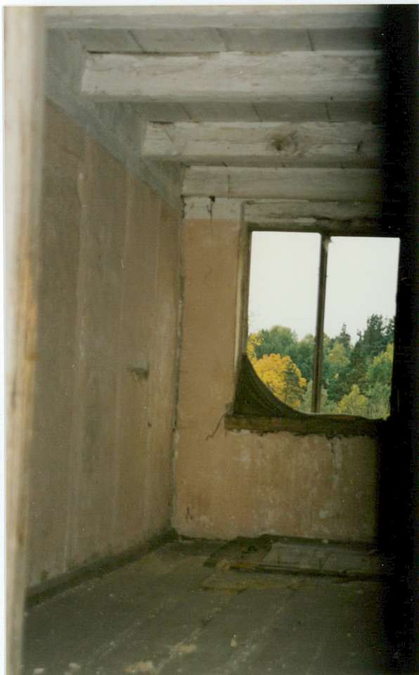
15. Strop w pomieszczeniu mieszkalnym na poddaszu