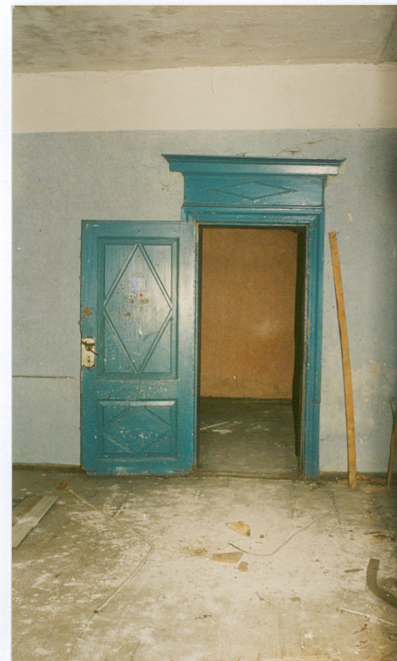
10. Drzwi w pomieszczeniu traktu wschodniego