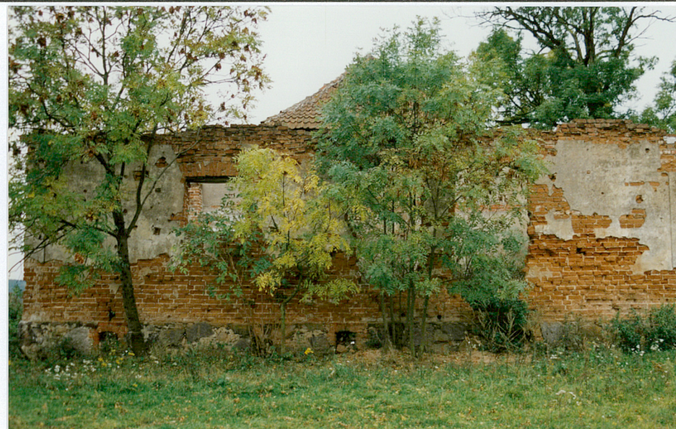
6. Elewacja północna oficyny