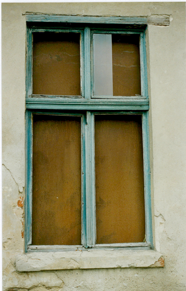
8. Okno w południowej części elewacji zachodniej