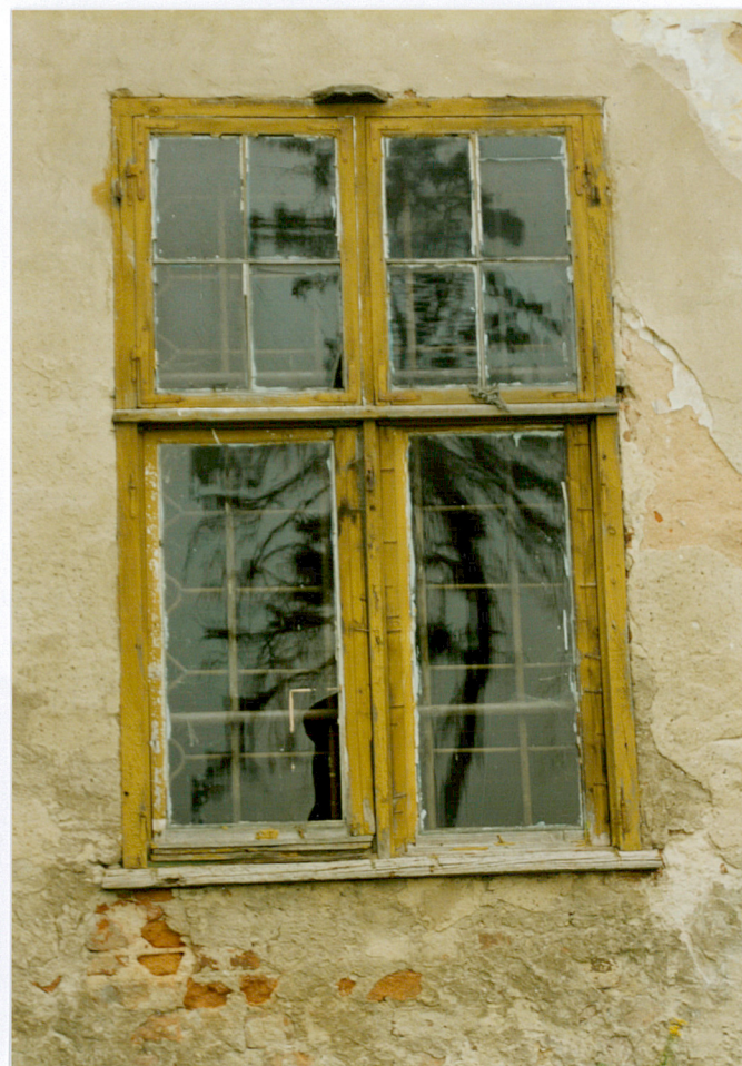
9. Okno w elewacji wschodniej