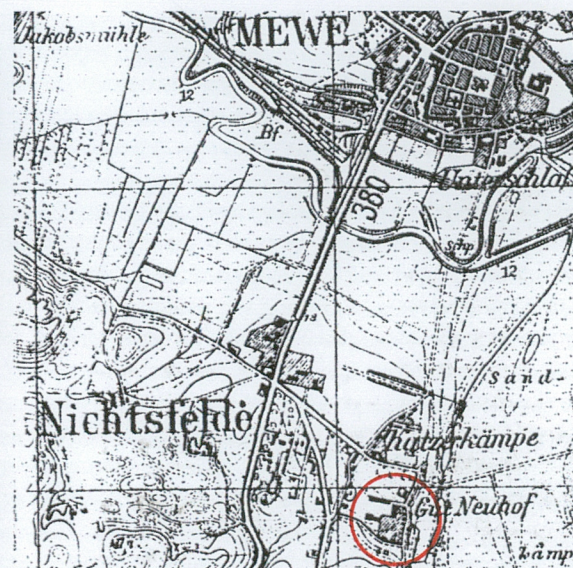
Mapa topograficzna, 1940 r., skala 1:25000