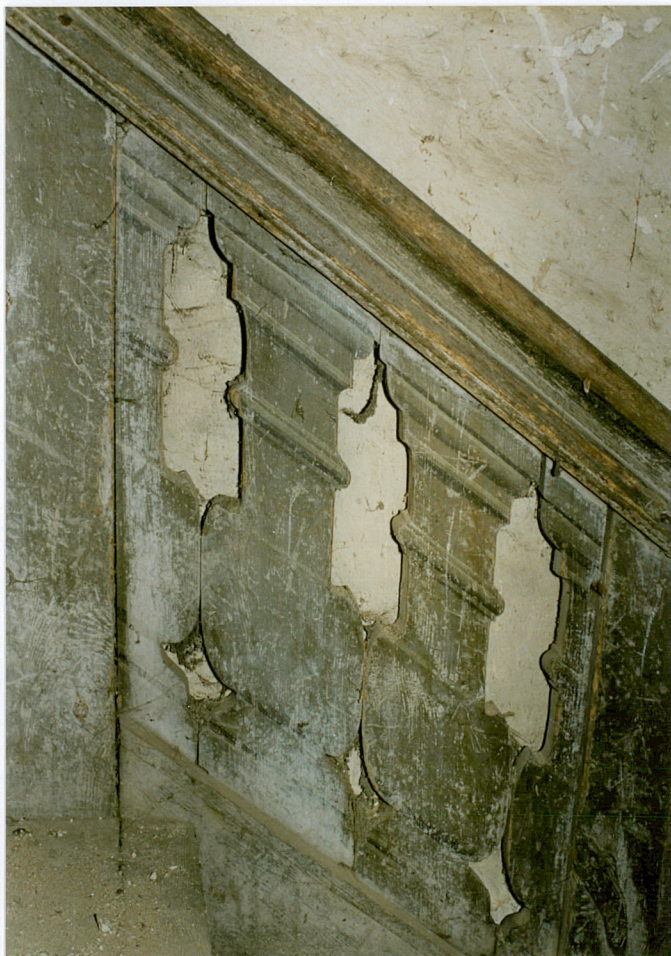
14. Fragment balustrady schodów - widoczne wymalowania