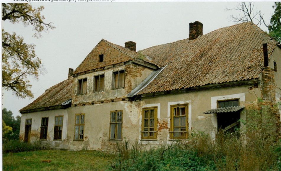
1. Elewacja wschodnia

11. Zdjęcia, rzut, przekrój, sytuacja, orientacja