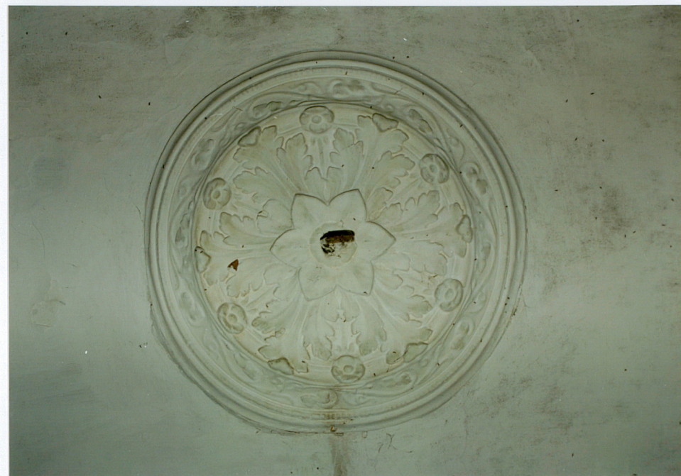
15. Rozeta na suficie w pomieszczeniu reprezentacyjnym przyziemia