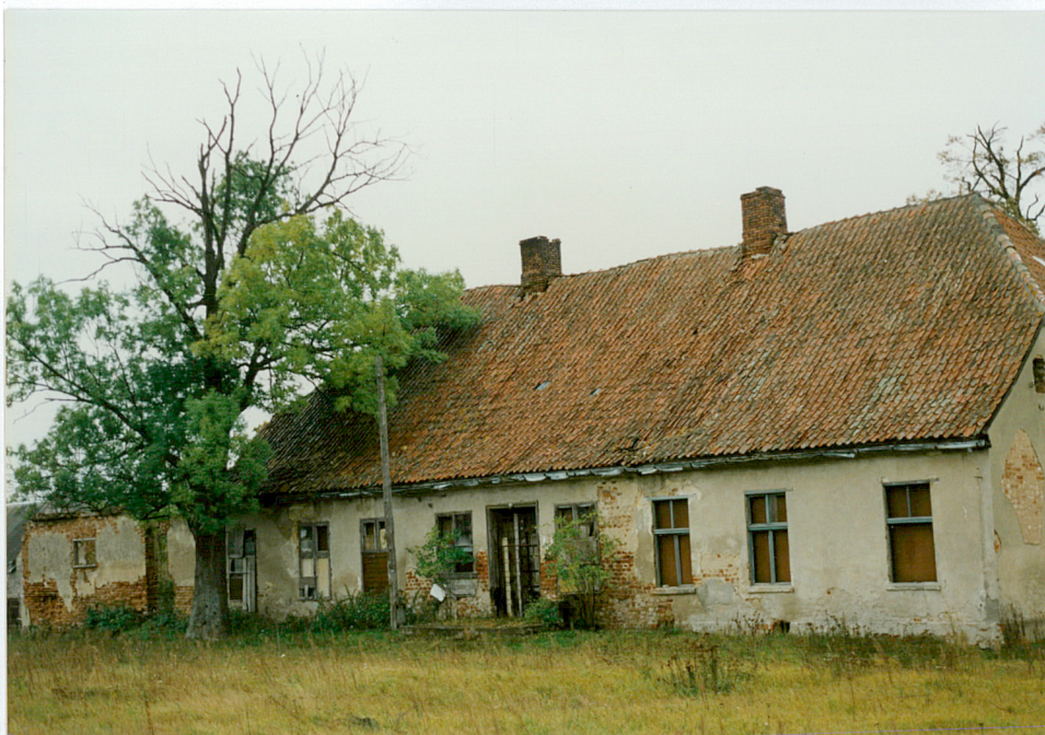
3. Elewacja zachodnia dworu (od strony folwarku)