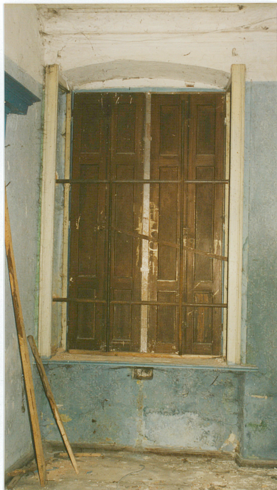
11. Okno od od strony wnętrza