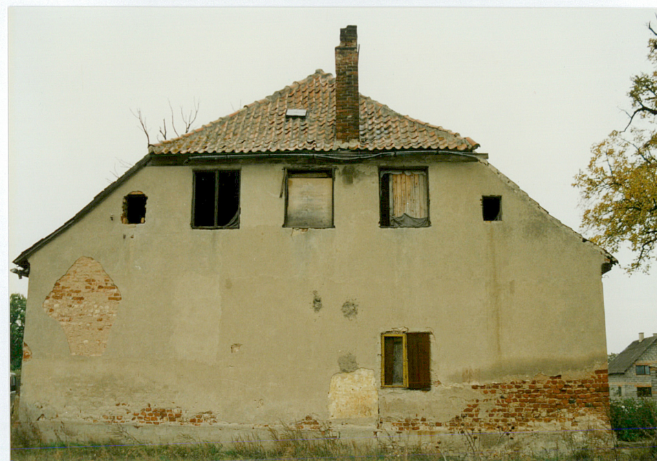
4. Elewacja południowa dworu