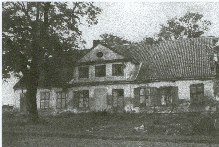
1. Dwór, elewacja wschodnia, zdjęcie z 1959 r.