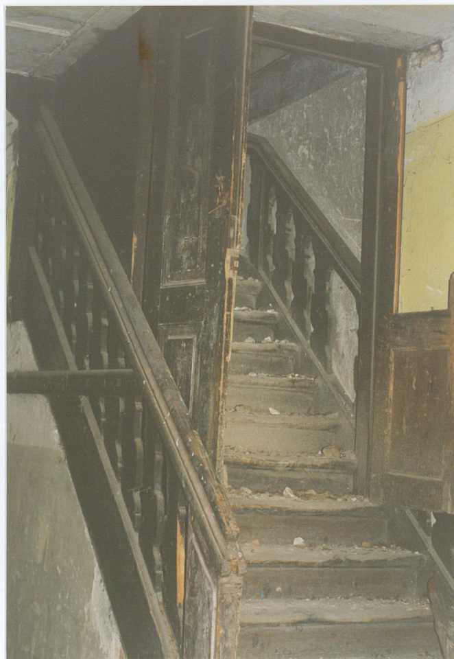
12. Schody w sieni