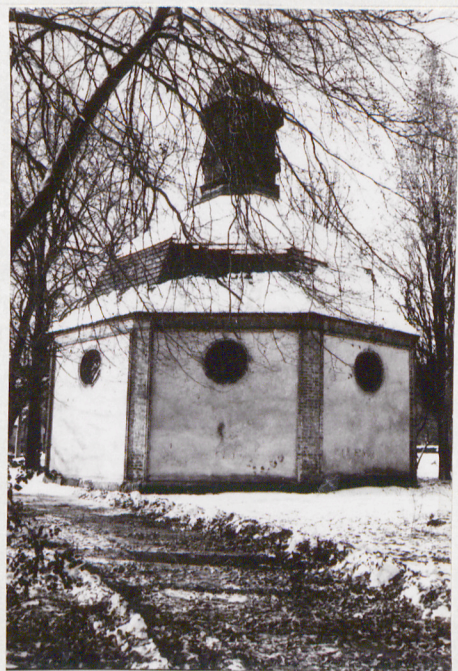
4. ELEWACJA Połudn.-WSCHODNIA