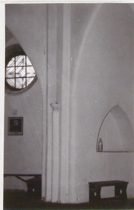
6. FILAR, ZE SKŁŹKĄ