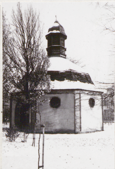
3. ELEWACJA ZACHODNIA