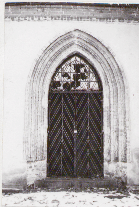
5. PORTAL WEJŚCIA