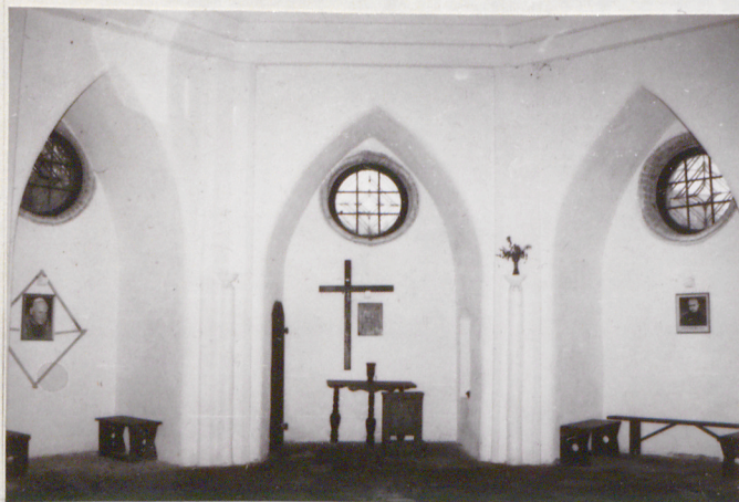
7. WNEŹRZE KAPLICY