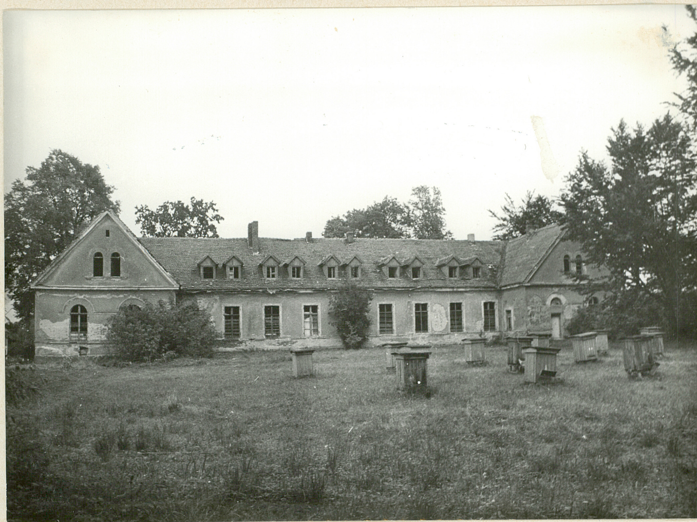
702 BR 4, CENYK - park Południowa elewacja pałacu