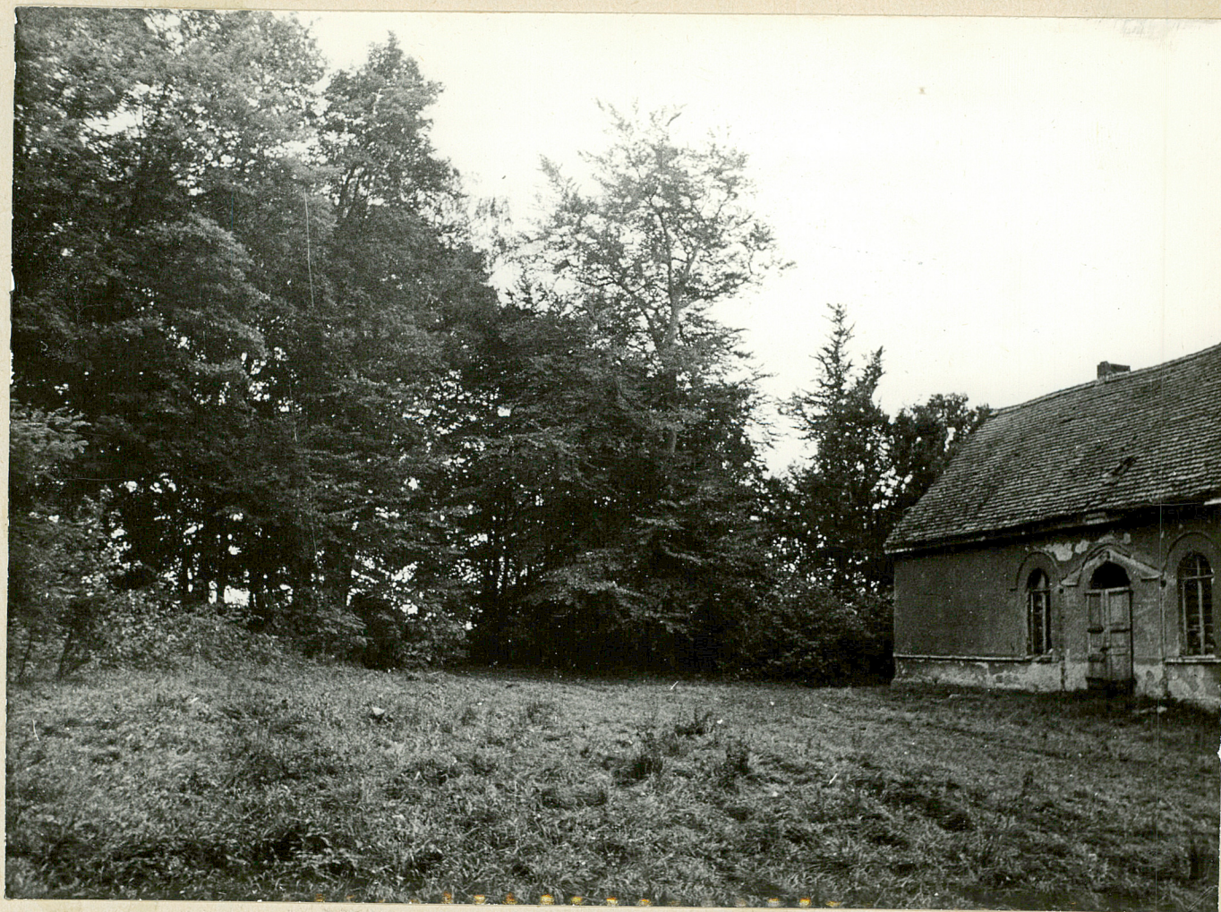
FOT NR 6. CEFYN - park