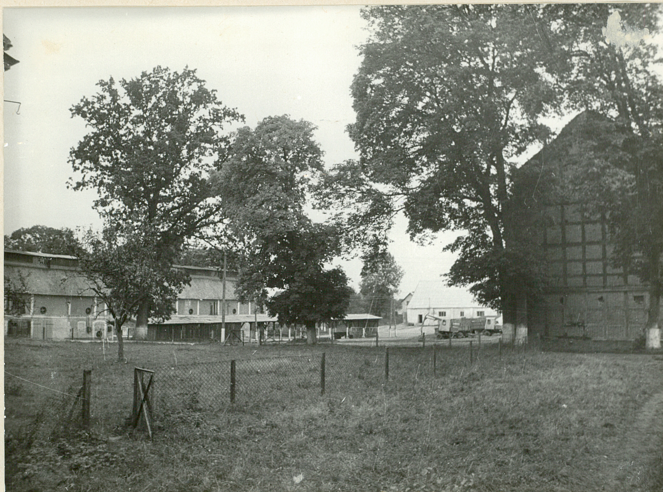
FOR MR. D. CHAIN - park view on podwórzo