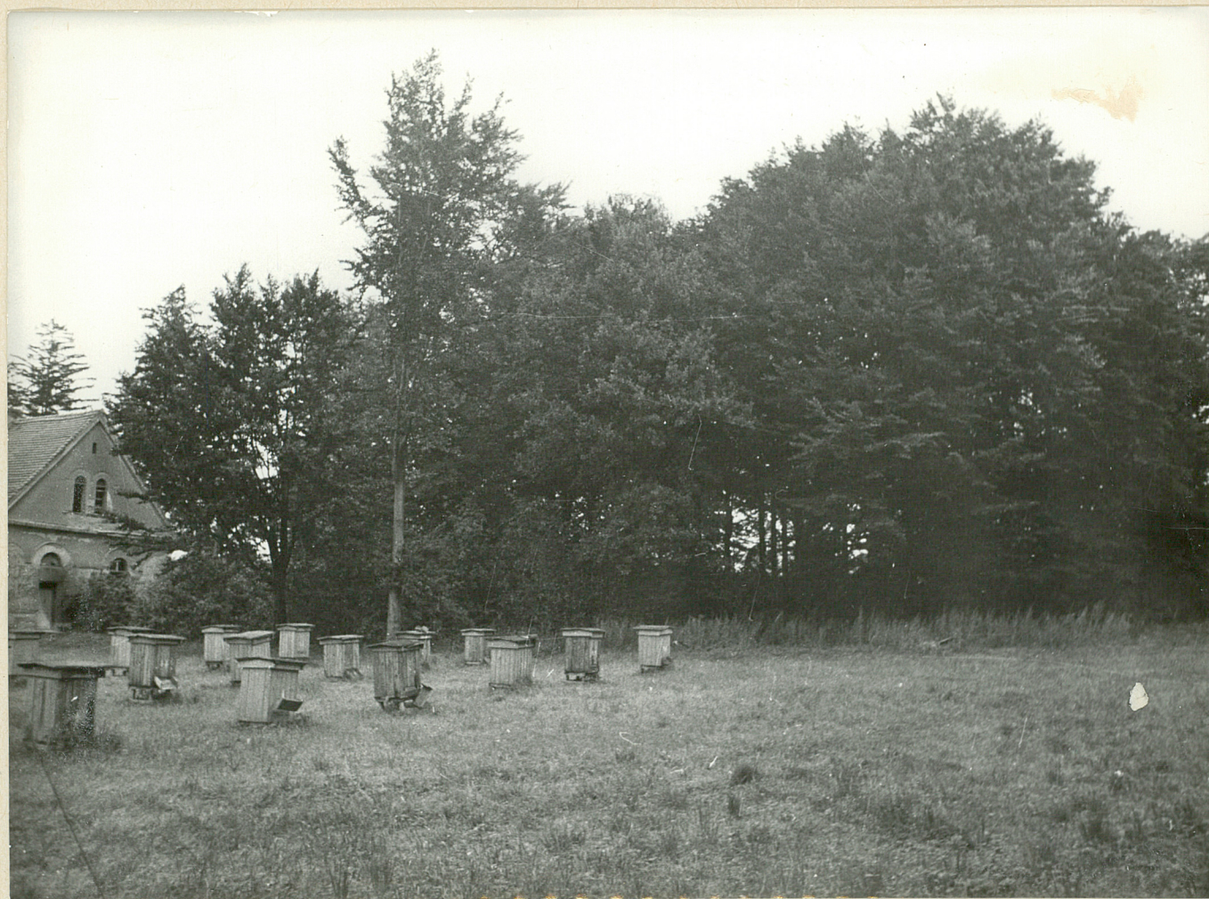
FOT NR 9. CERNY - park Naoyw starodrewniu okalajacy zapalacowa przeznaczony trawiaasta