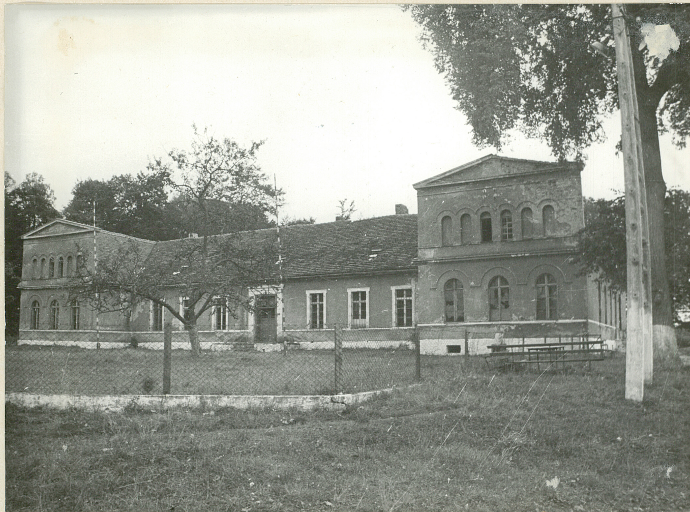
POT NR 1. CETYŃ - park Widok pałacu