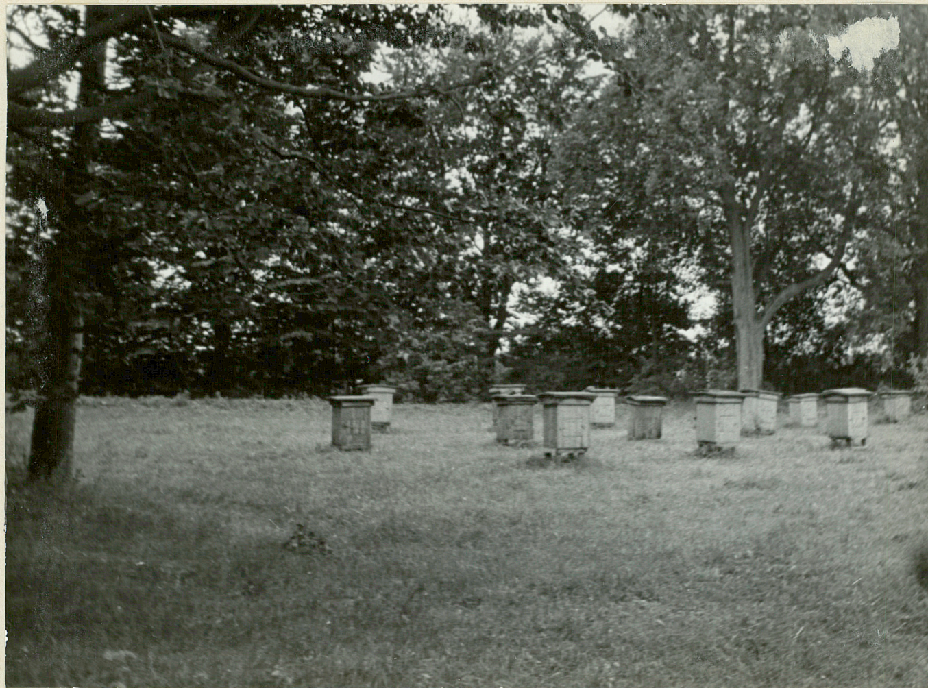
FOF NR 3, CETIN - park Pasieka na zaplecosu pakacu