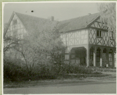
Od strony pñd.-wsch.