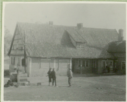
Od strony zach.