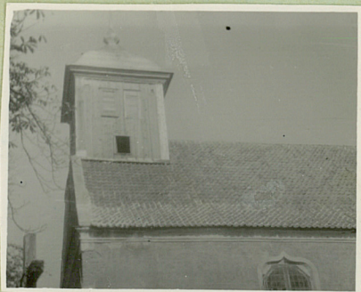
od strony połudn.