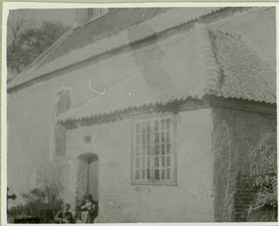
od strony płdn.-wsch.