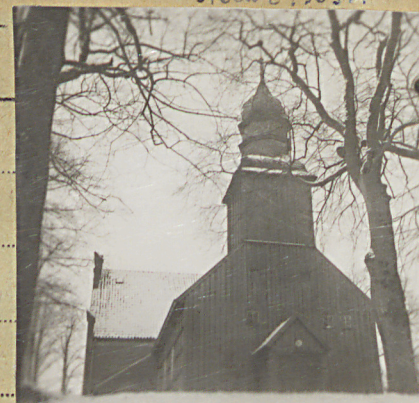
stawa z 1963r.