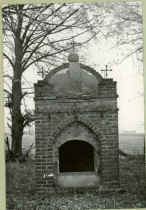
stan z 1964