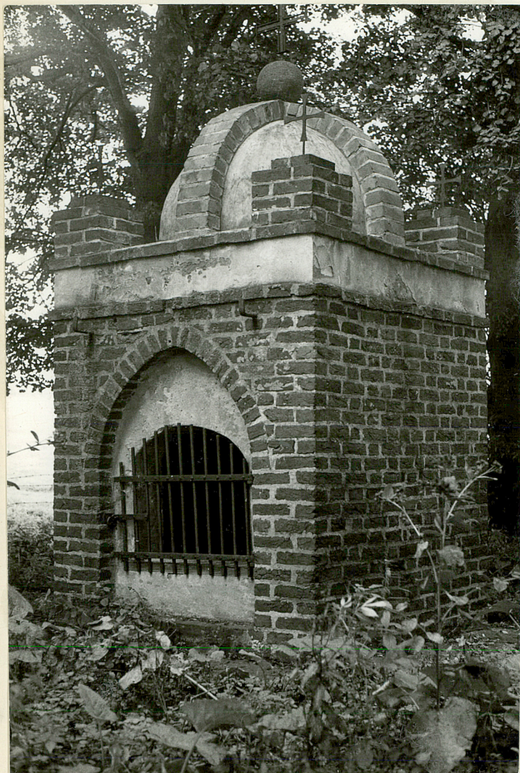
data wykonania sierpień 1978 r.