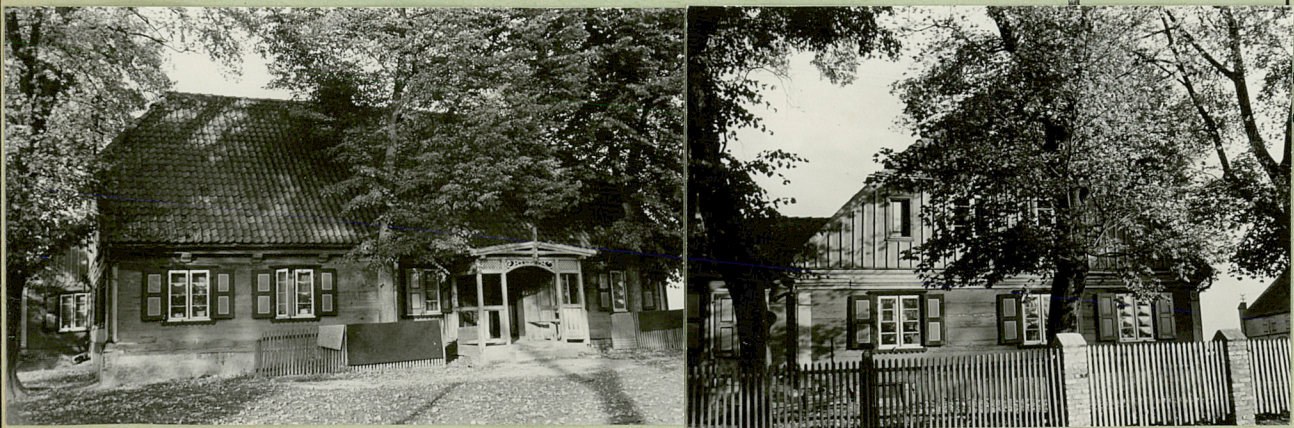
STAN W 1964.