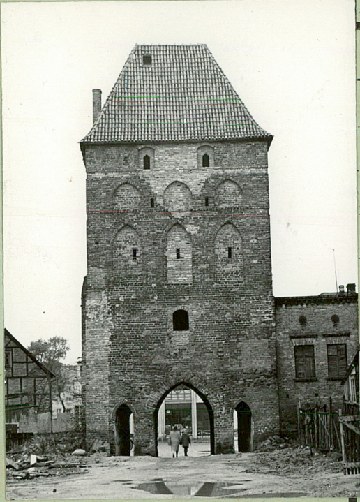
STAN z 1964