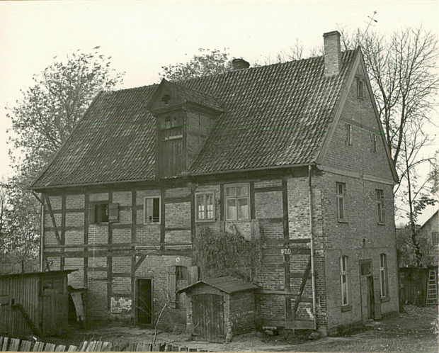
STAN z 1964