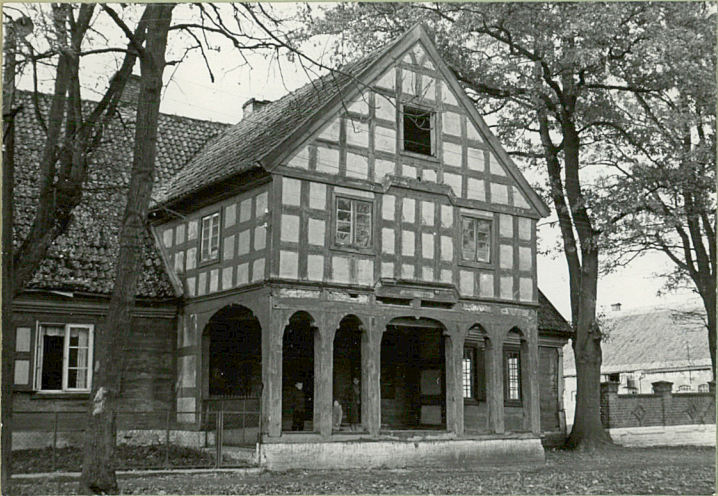
STAN z 1964