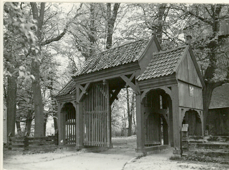
nr neg.: 078465 data wykonania ..... miejsce przechowywania negatywów maj 1982r