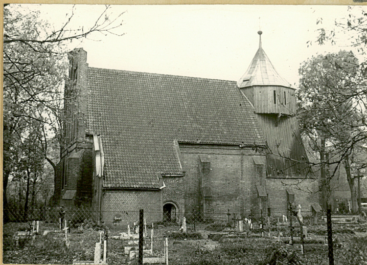
STAN z 1964