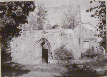
od strony zach.