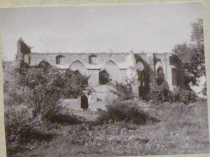
od strony połudn.

Orientowany. Trójnawowy - trzypiętowy z wydzielonym wielobocznie zamkniętym prezbiterium. Od zachodu murowana wieża, przed zniszczeniem zwieńczona drewnianą nadbudową z 8-boczną izbica i hełmem-iglicą. Oszkarpowany. Portal zach. ostrołuczny profilowany. Ściany boczne korpusu nawowego przed pożarem nadbudowane były w konstrukcji ryglowej wypiętą.