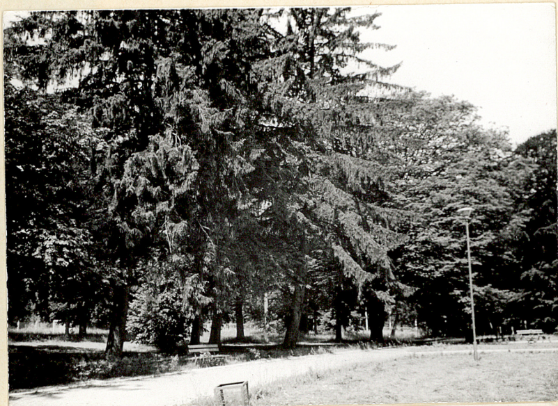
5. Szpaler świerkowy przy podjeździe. Widok od pld.-wsch.