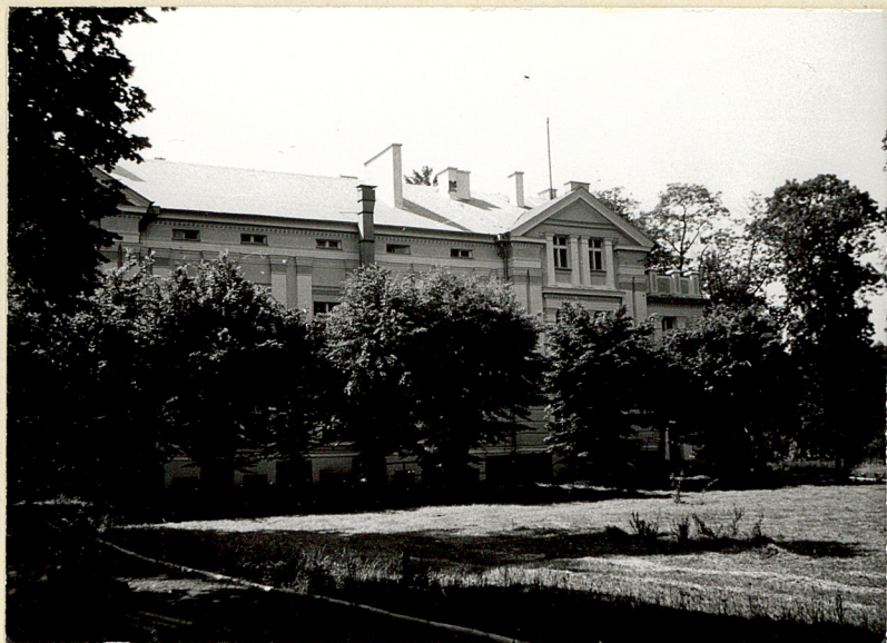
14. Pałac, elewacja pñ.