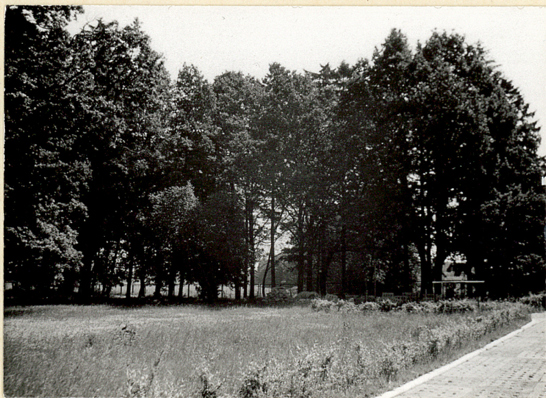
10. Wsch. szpaler graniczny oraz miejsce nieistniejących obecnie budynków gospodarczych. Widok od płu.-zach.