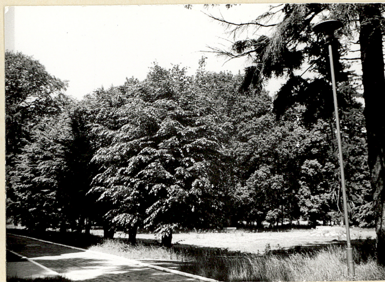
9. Szpaler grabowy na tyłach pałacu. Widok od wsch.