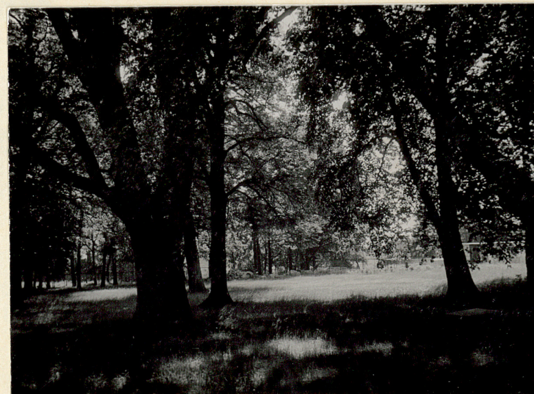
7. Dęby w parku. Widok od pln.-zach.

Wkładkę założył: Iwona Szuldrzyńska 1991r. (imię, nazwisko, data)