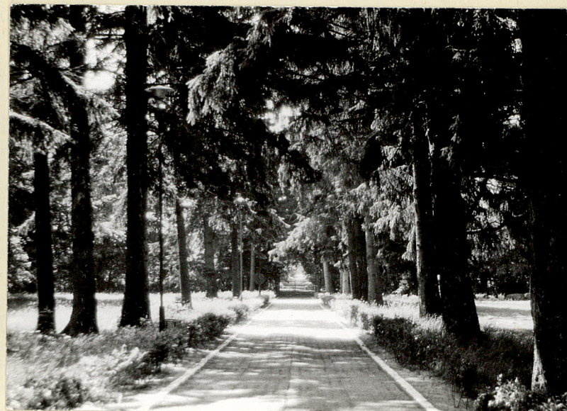
2. Aleja wjazdowa i brama. Widok od pin.