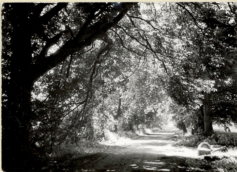
1. Aleja dojazdowa, widok od pin.