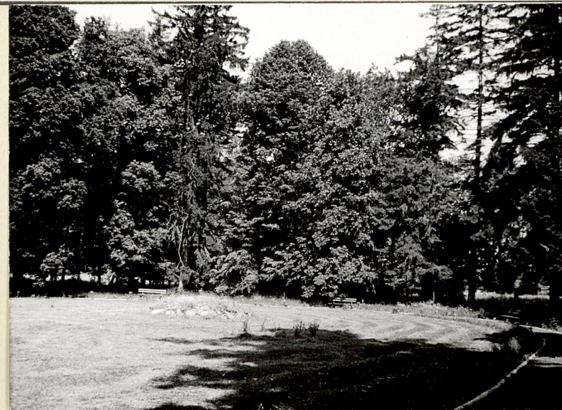
6. Wnętrze parku na tyłach pałacu. Widok od pld.-wsch.