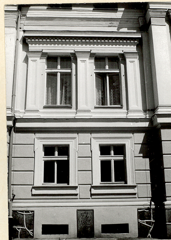
13. Fragment pld. elewacji pałacu z datą budowy.

Wkładkę założył: Iwona Szuldrzyńska 1991r. (imię, nazwisko, data)