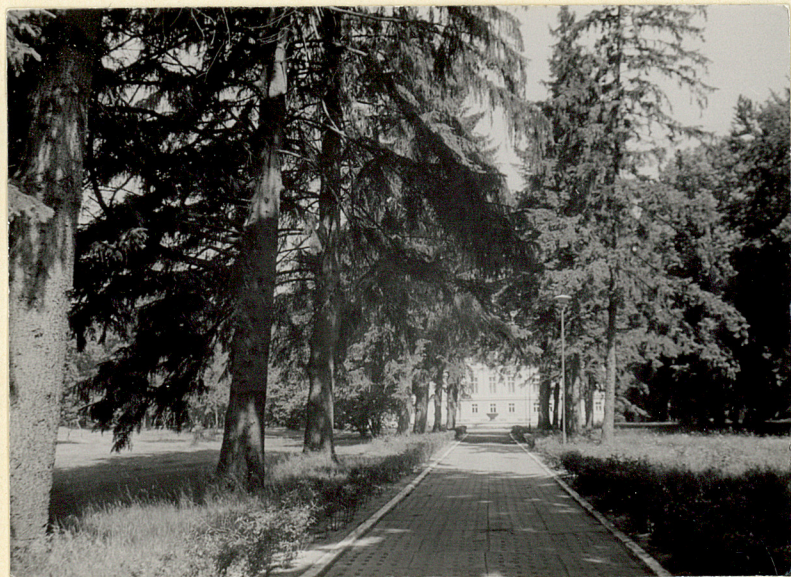
3. Aleja wjazdowa i palac. Widok od pld.