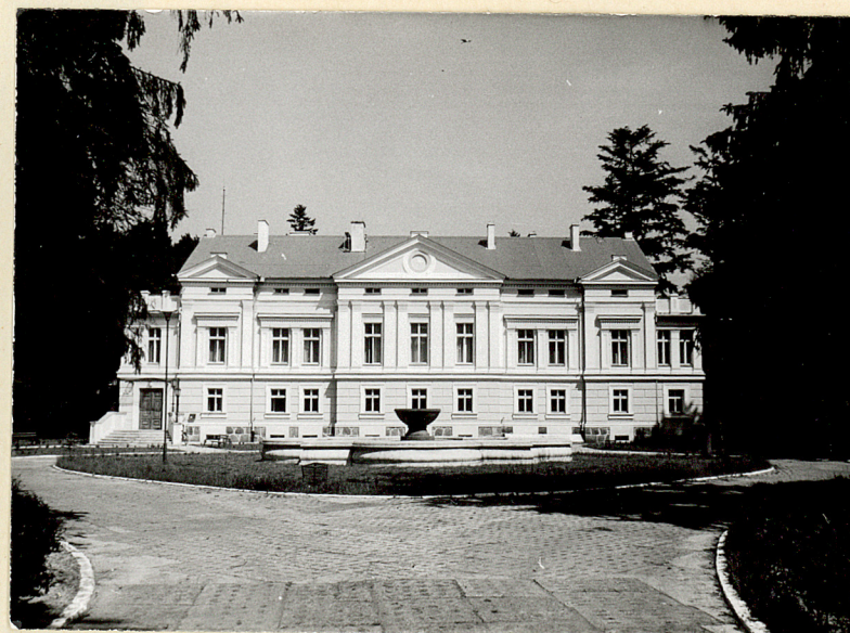
11. Pałac, elewacja pld.