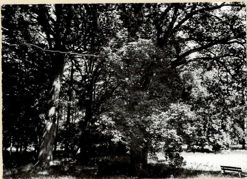
8. Dęby w płu. części parku. Widok od pld.-zach.