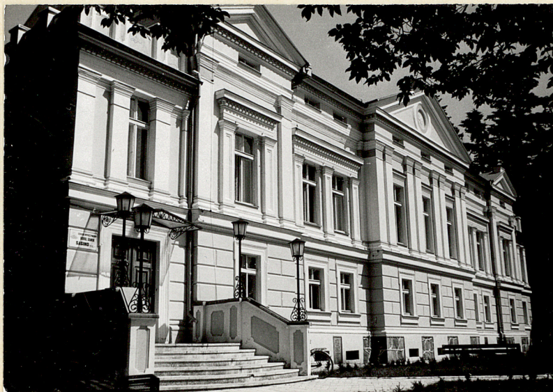
12. Wejście do pałacu w pld. elewacji.