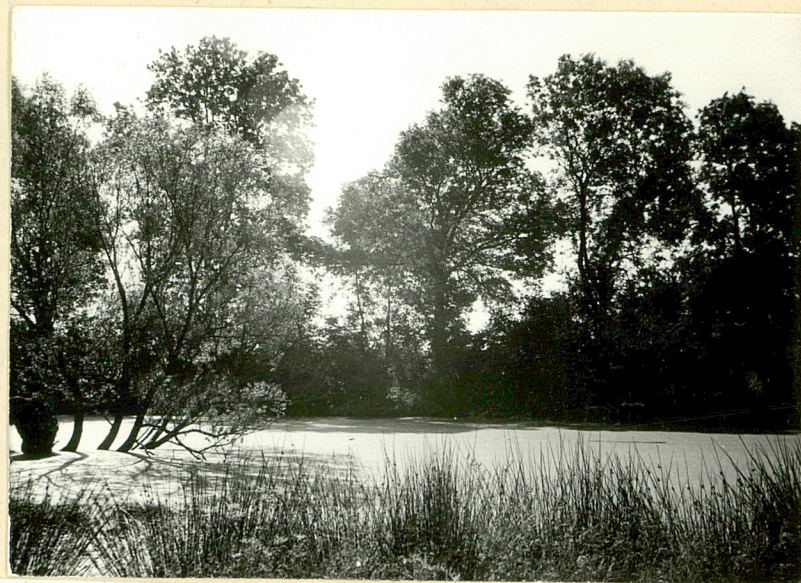
9. Staw i szpaler graniczny. Widok od zach.