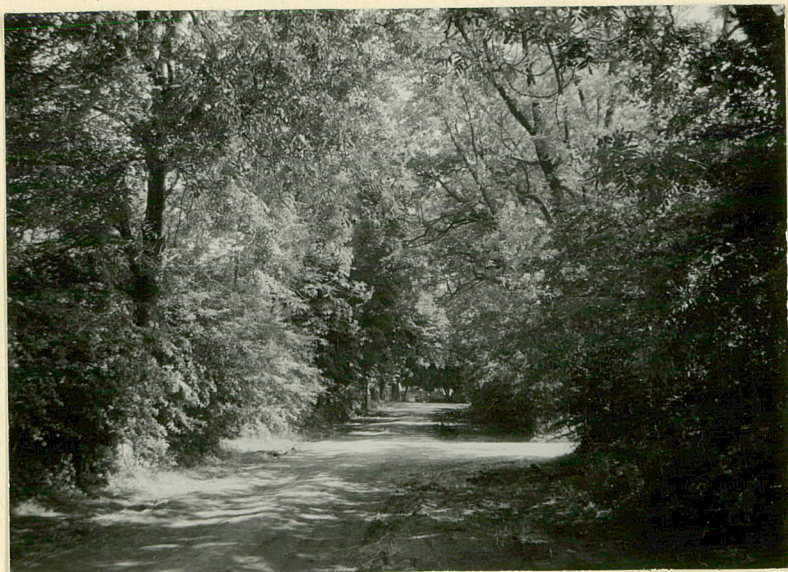
1. Brukowana aleja dojazdowa, jesionowo-klonowa, do części gospodarczej. Widok od płu.