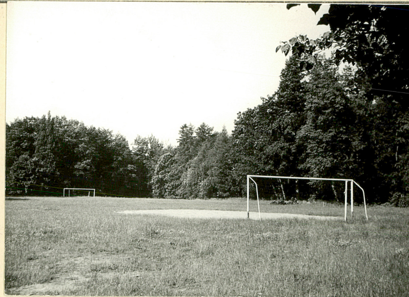
6. Wnętrze parku. Widok od płu.