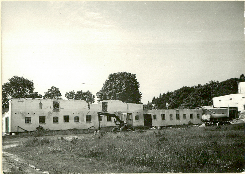
19. Obora, elewacja płu.