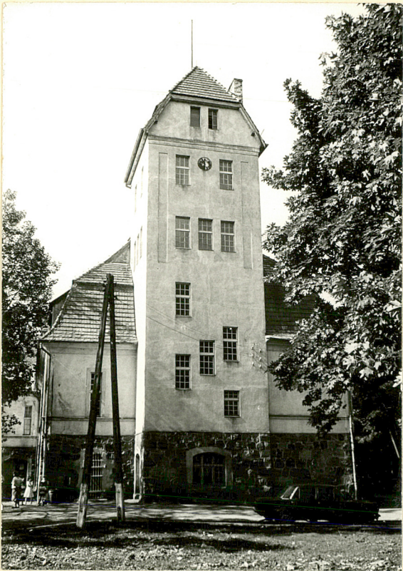
13. Palac, elewacja pln.