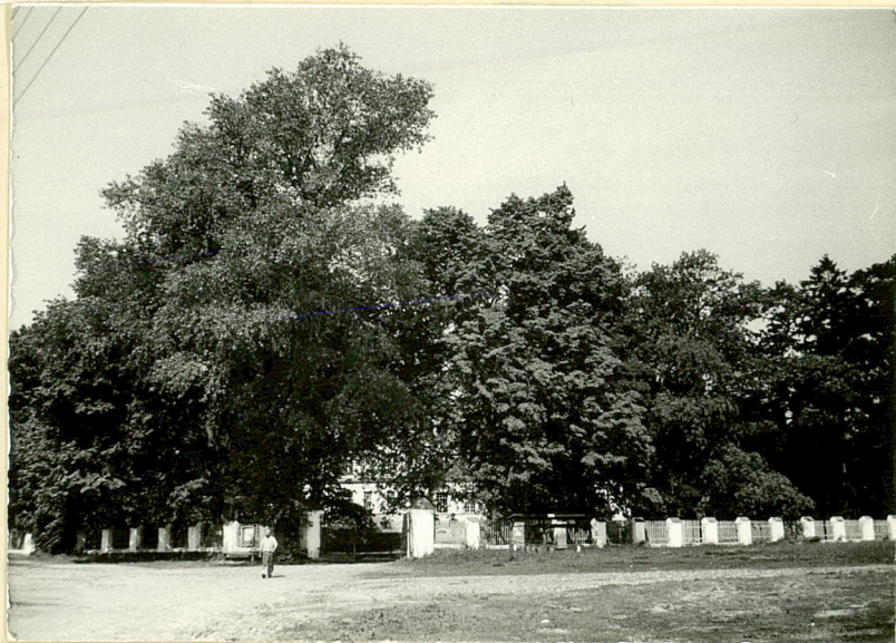
10. Skrzydło zach. folwarku z pałacem. Widok od wsch.