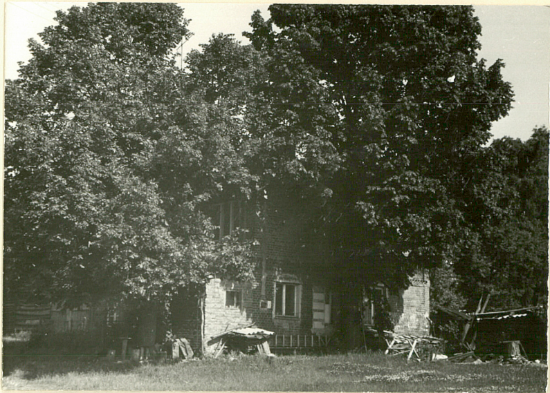
20. Dom mieszkalny w płu. skrzydle. Widok od pld.-wsch.

Wkładkę założył: I. Szuldrzyńska 1991 r. (imię, nazwisko, data)