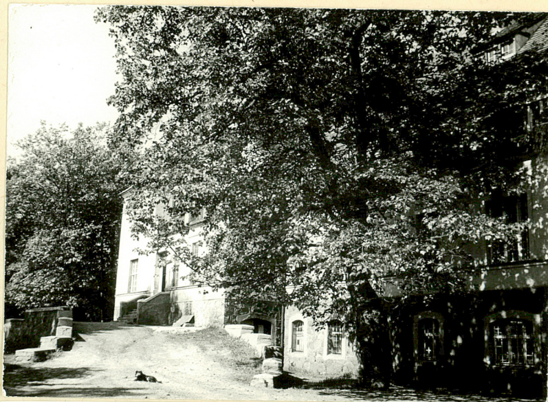
11. Podjazd z dwoma platanami. Widok od pln.-wsch.