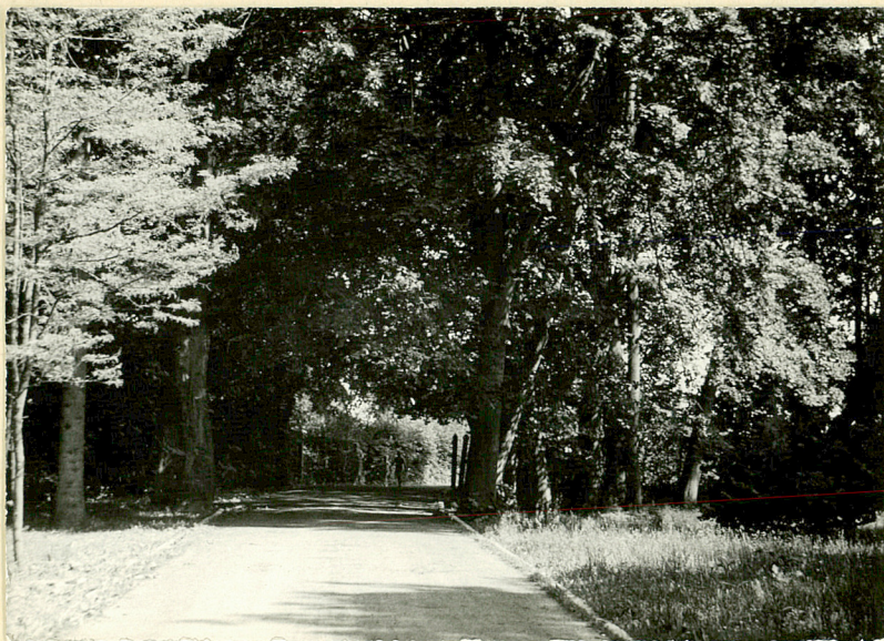
3. Pierwsza aleja wjazdowa do części dworskiej. Widok od płu.