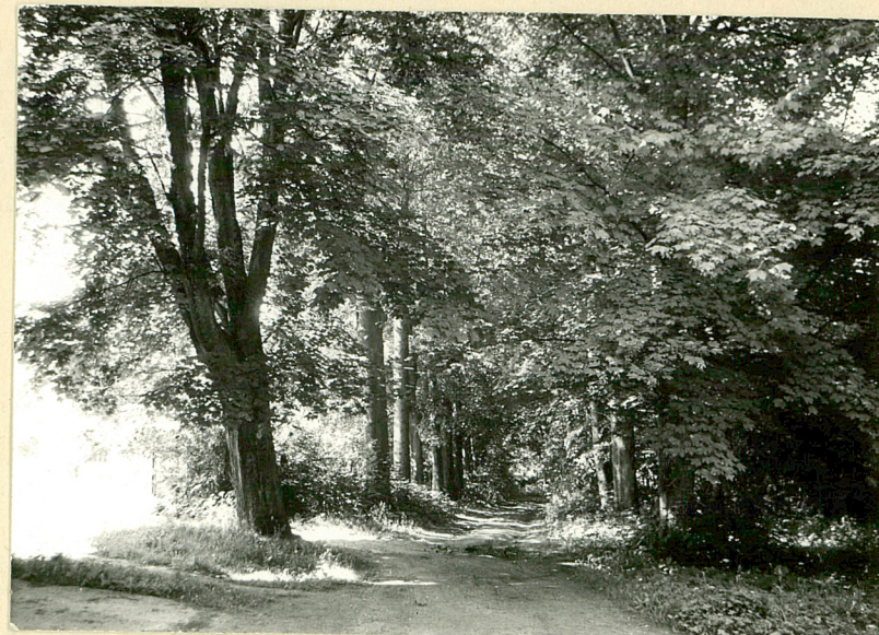
2. Polna aleja dojazdowa, klonowa, do części gospodarczej. Widok od płu.