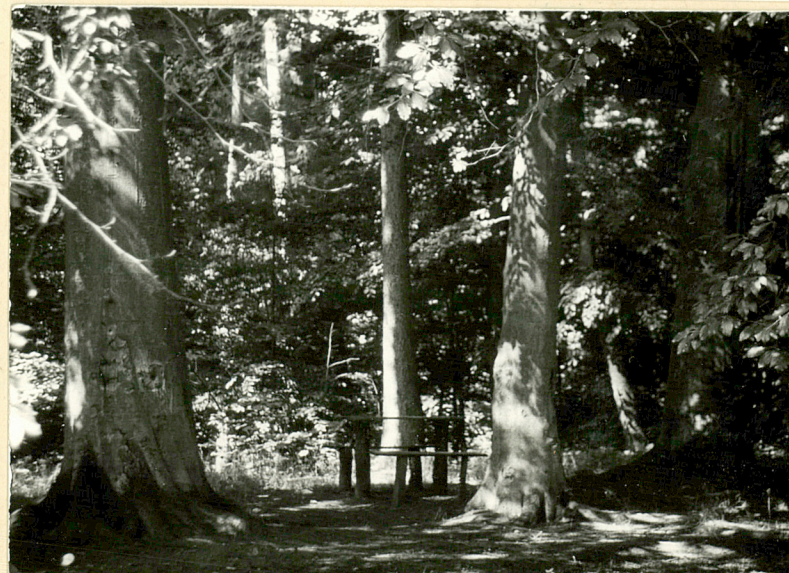
7. Altana bukowa w parku. Widok od płu.- wsch.

Wkładkę założył: I. Szuldrzyńska 1997 r. (imię, nazwisko, data)