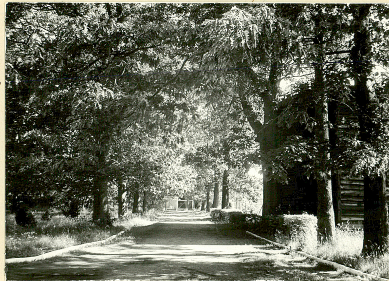
4. Druga aleja wjazdowa do części dworskiej. Widok od płu.