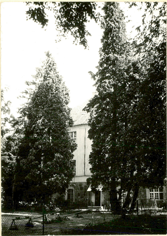
14. Tuje przed pld. elewacja palacu.

Wkladke zalozytl: .....I. Szuldrzyńska.....1994 r. (imie, nazwisko, data) Miejsce przechowywania negatywow: Muz. Nar. Rolnictwa OZGraf. Z.P. Ostroda zam. 699 nakl. 23.600