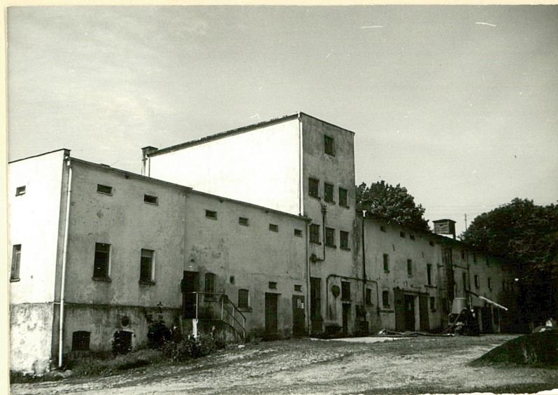
16. Gorzelnia i magazyn, elewacja płn.