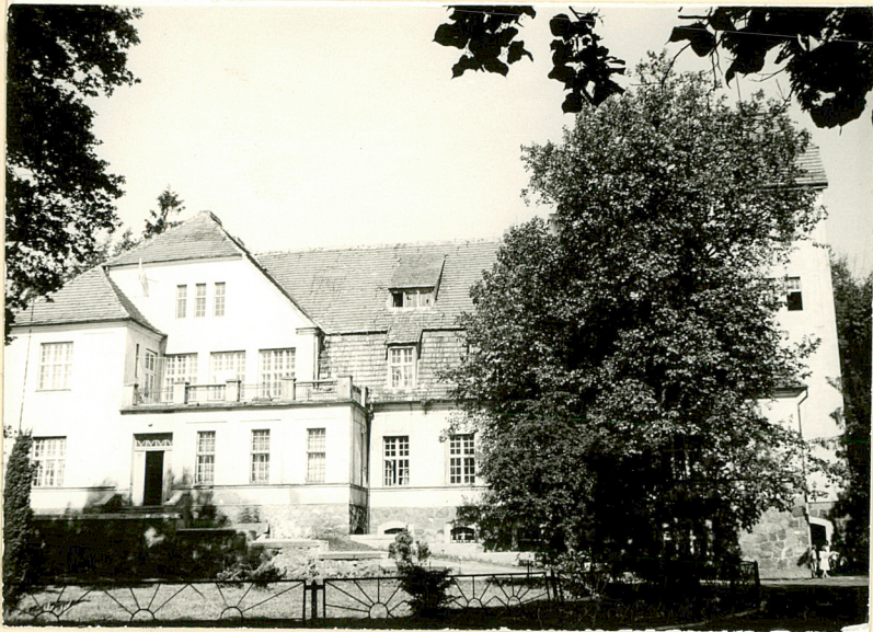
12. Palac, elewacja wsch.