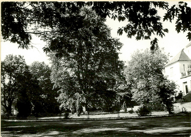
5. Podjazd z gazonem. Widok od płu.