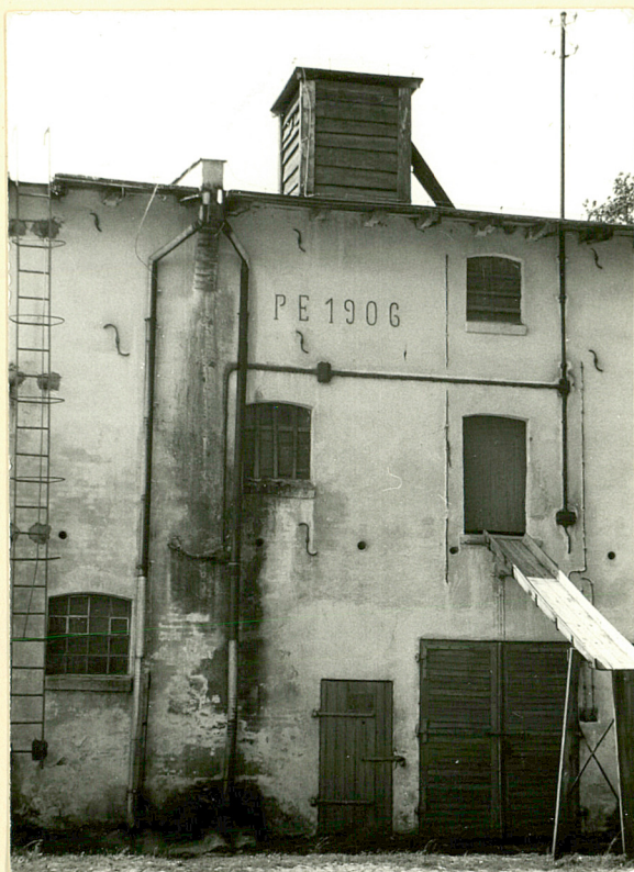
17. Data na płn. elewacji magazynu gorzel- ni.