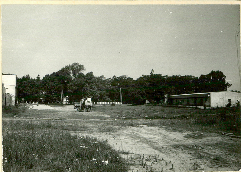
15. Widok ogólny dziedzińca folwarku od płd.-wsch.