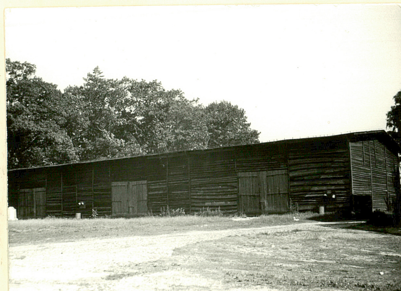
18. Stodoła, elewacja płd.