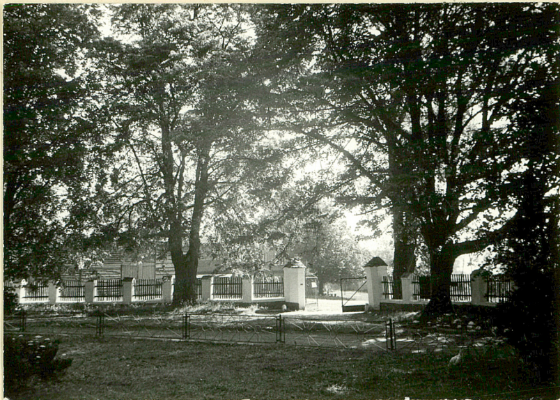
8. Wjazd, obsadzony szpalerem drzew liściastych mieszanych, na dziedziniec gospodarczy. Widok od pld.-zach.