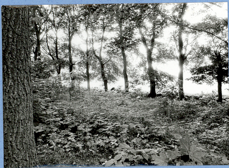
2. Widok cmentarza od str. pd-wsch.