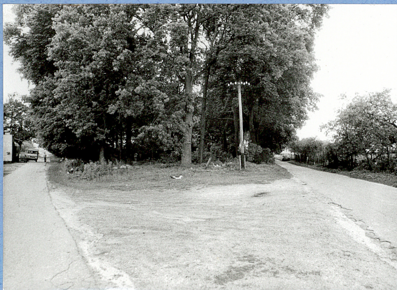
1. Widok ogólny założenia od skrzyżowania