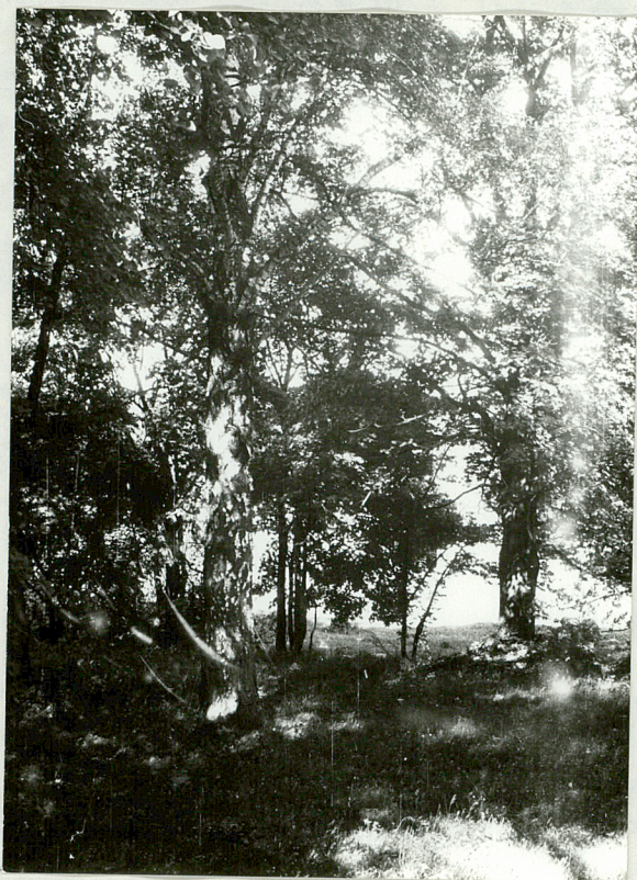
Drzewy i topole w parku.