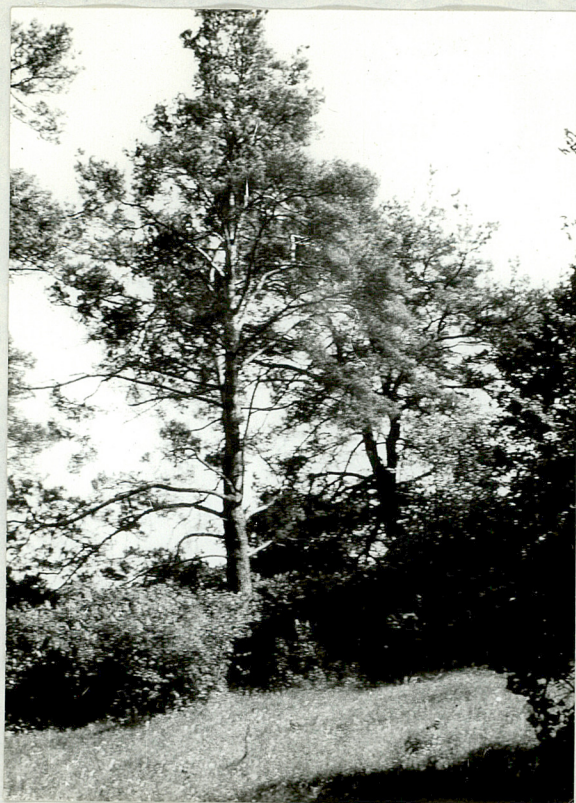
Ostatnie sceny z byłej łąki łąkowej.