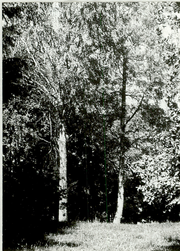
Resztki brzoź z alei brzoźowej.