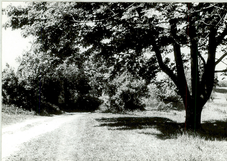
Ruiny bramy wjazdowej na teren zabudowań folwarczanych. Widać widok klon.