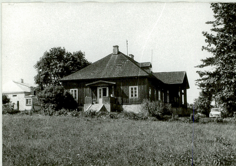
Widok dworku. Z lewej strony widać nowy budynek mieszkalny właściciela.