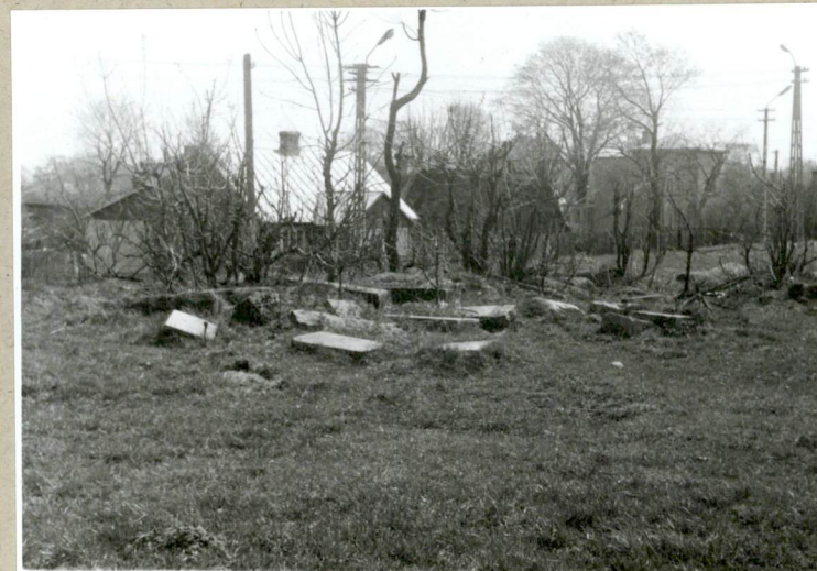
Płyty w zach. części cmentarza