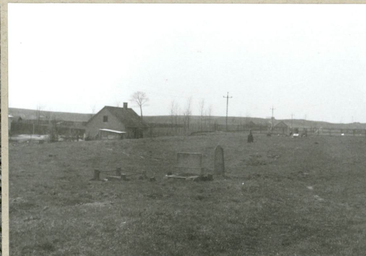
Widok na pld-zach część cment.