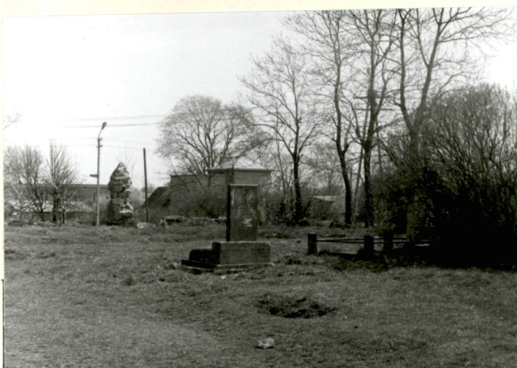
Nagrobki współczesne/po II wojnie św./