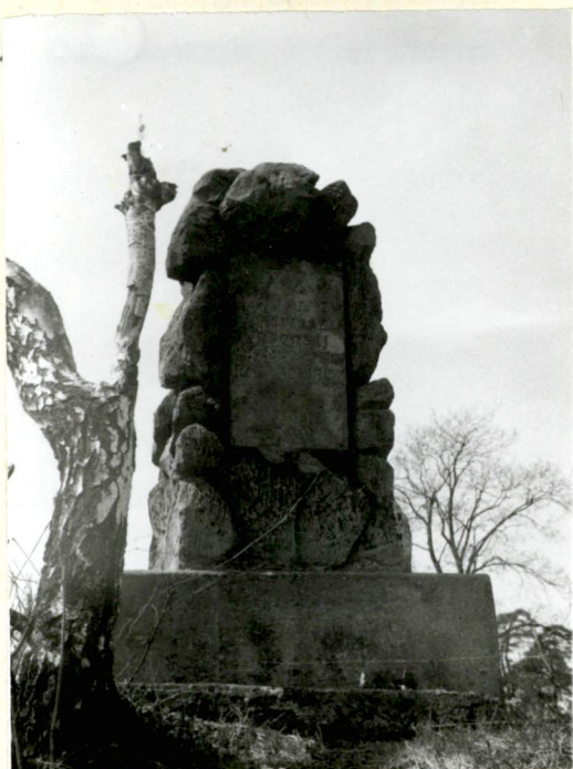
Pomnik upam. zniszczenie cment. przez okupanta hitlerowskiego