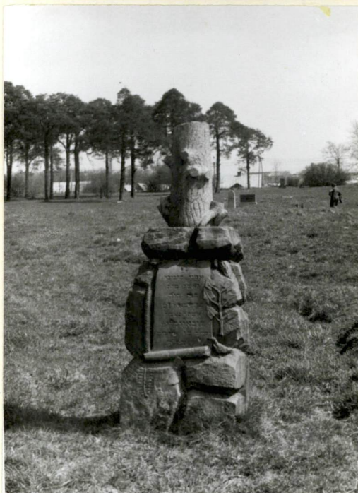
Jeden z ocalałych pomników nagr.