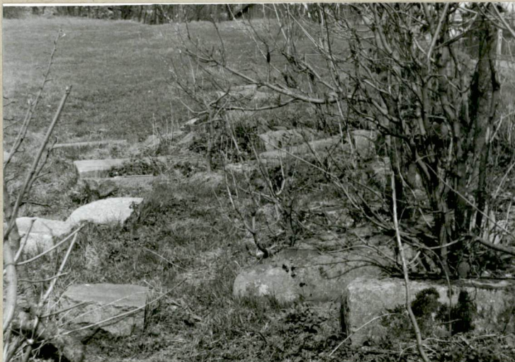
Pozostałości nagrobków w zach. części cment.