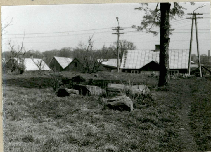
Pozostałości nagrobków w środkowej części cment.