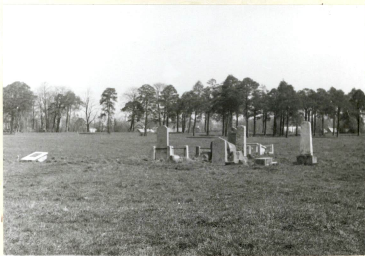
Nagrobki współczesne / po II woj- nie św./