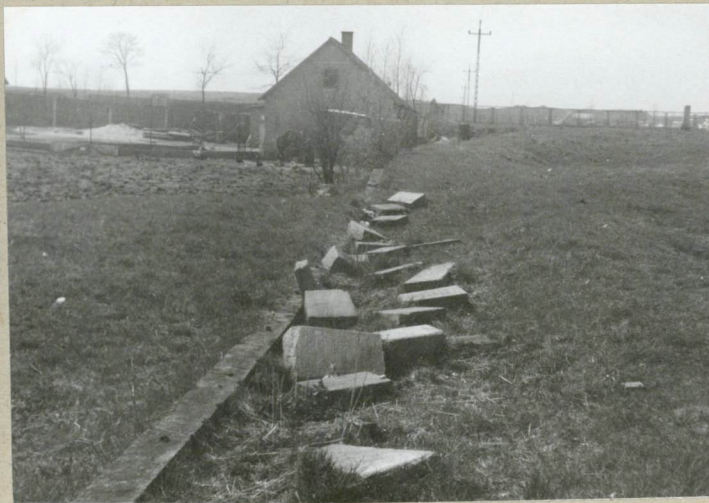
Płyty nagr. w pld. części cment.