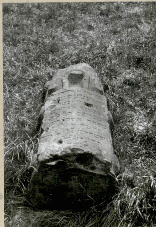
Fragm. zniszczonego nagrobka