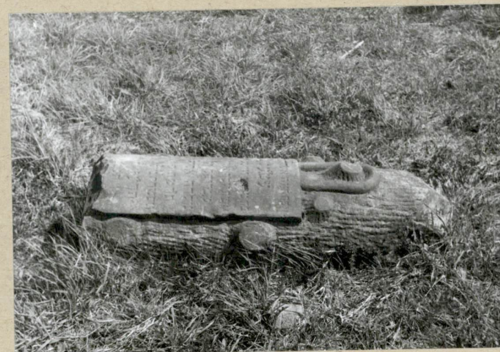
Fragm. zniszczonego nagrobka