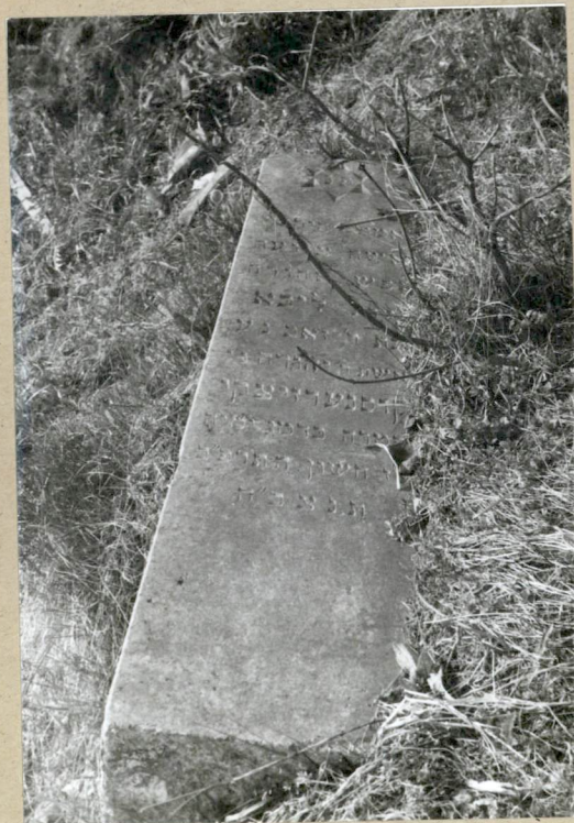
Fragm. Zniszczonego nagrobka