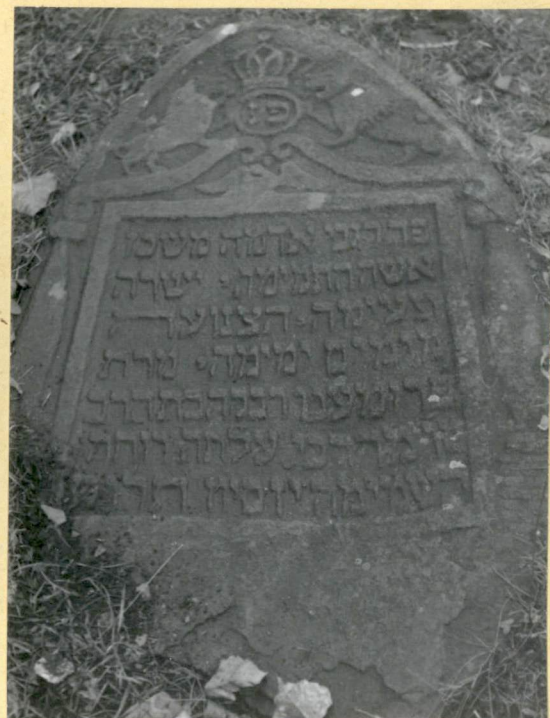
5. Wyjątkowo zachowany nagrobek z pocz. XIX w. Symbolika lwa charakterystyczna dla potomków Judy. Może również nawiązywać do imienia zmarłego.