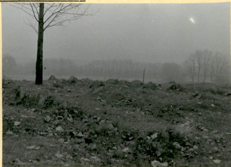
2. Teren cmentarza od strony południowo-wschodniej. Ślady nagrobków i mogił informujące o rzędowym układzie cmentarza.