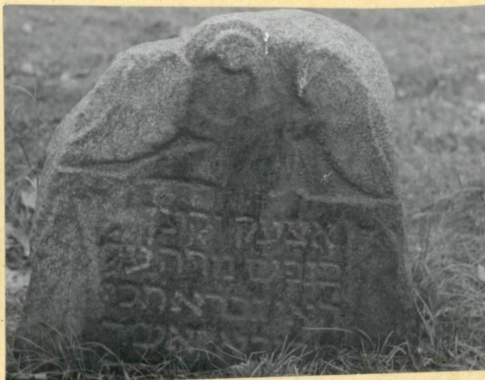
4. Nagrobek z symboliką, ok. / pocz. XIX w. / Jest to wyjątkowo dobrze nagrobek z tą symboliką