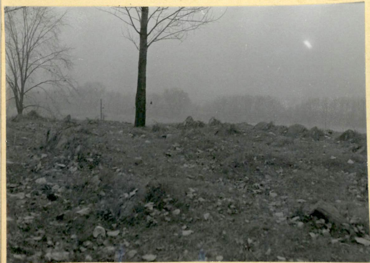
3. Teren cmentarza od strony wschodniej.