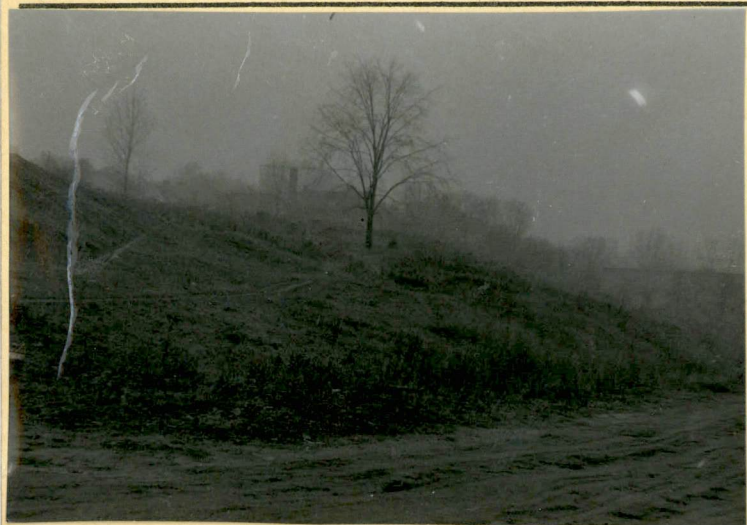
1. Teren cmentarza. Na pierwszym planie ulica Woźniowska.