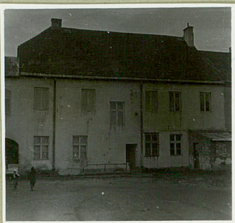
Zjednoczenie - ram. 1858, 18. 11. 57 - 12000 - kart.