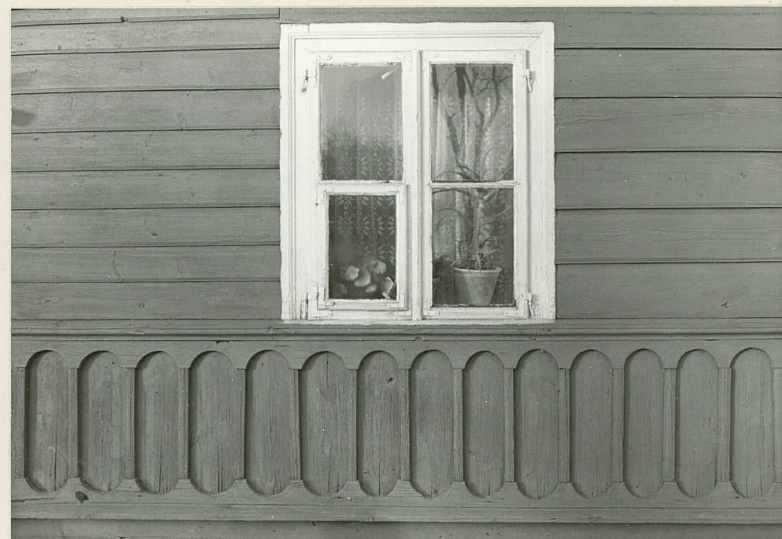
2. Fragment szalunku w elewacji pld.