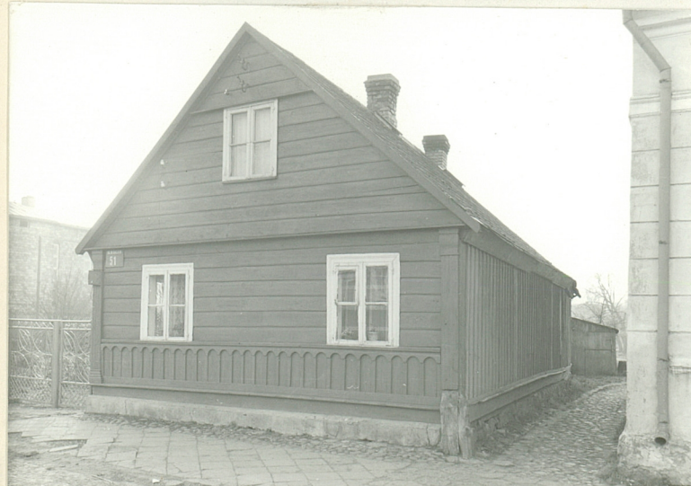
autor zdjęć W. Hulanicki data wykonania XI 1981 r. miejsce przechowywania negatywów