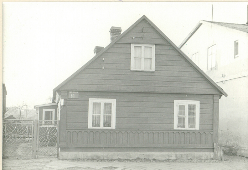
1. Szczyt wschodni

3. Zawartość wkładki (nazwa obiektu lub materiału uzupełniającego) Fotografie