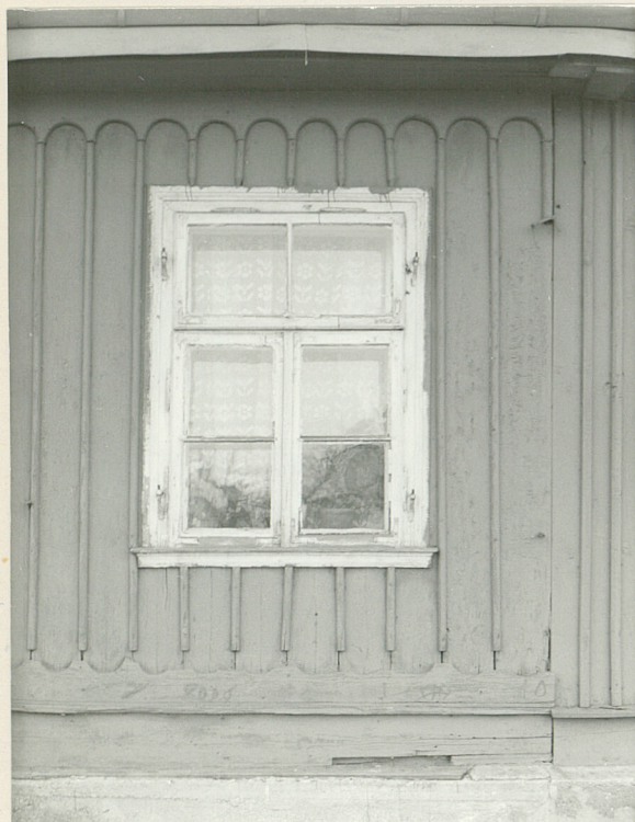
1. Fragment elewacji wsch.