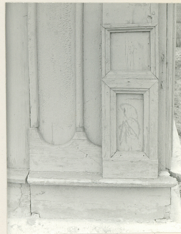
3. Fragment pilastra w elewacji wsch.