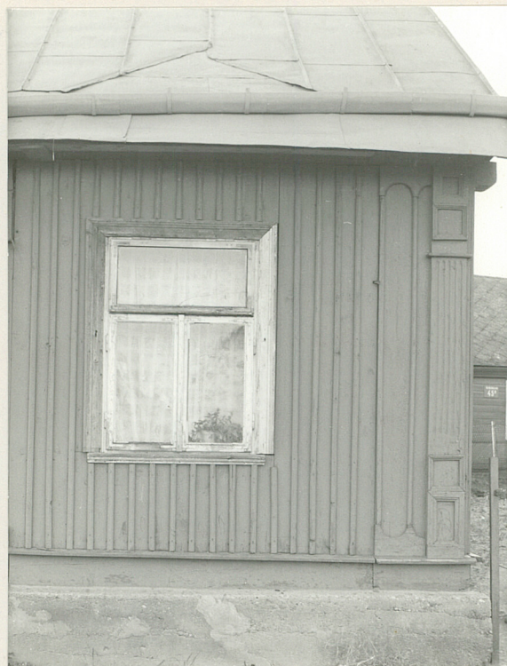
2. Fragment elewacji wsch. w miejscu dawnego ganku